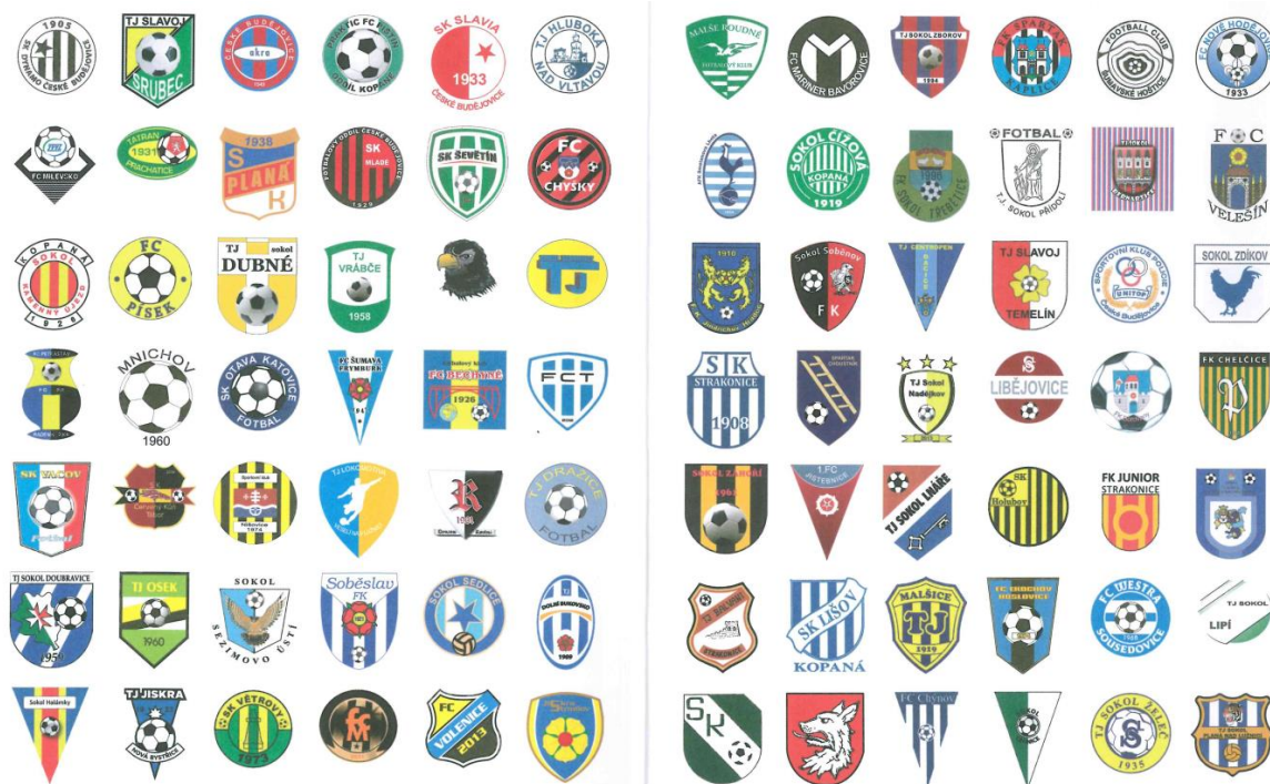
Obrázek 5: Fotbalové kluby Jihočeského kraje (Průcha & Zuntých, 2013)

pozoruhodné. Ukazuje popularitu fotbalu a obětavost lidí, kteří se fotbalu věnují a formují další nové hráče (Průcha & Zuntých, 2013).