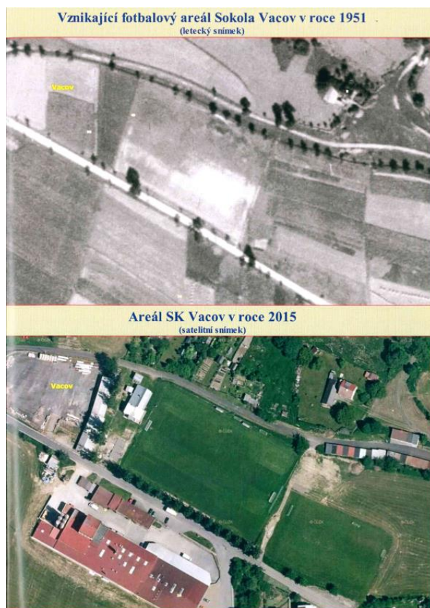
Obrázek 13: Areál SK Vacov rok 1951 a 2015