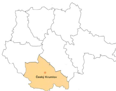
Obrázek 7: Českokrumlovsko (Průcha & Zuntých, 2013)