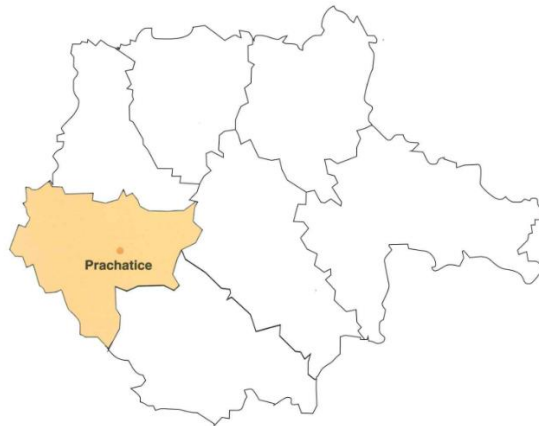
Obrázek 10: Prachaticko (Průcha & Zuntých, 2013)

FK Tatran Prachatice je klub, který následoval po klubu Český sportovní klub, který byl založený studenty gymnázia. Klub se věnuje mládeži i dospělému fotbalu. Žáci se dostali do ligy v roce 2000 a dorost do divize.