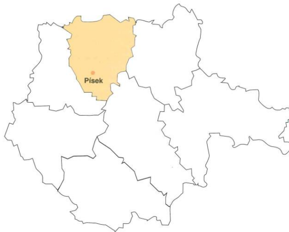
Obrázek 9: Písecko (Průcha & Zuntých, 2013)

FC Písek je největším fotbalovým klubem na Písecku. Především klub SK Písek vznikl spojením tenisového a fotbalového kroužku v roce 1910 a později se k němu přidal i odbor kopané. Klub má modernizované šatny, několik travnatých ploch, plochy s umělou trávou a kvalitní zázemí. Mezi mimořádné odchovance patří Jan Říha, který zavedl „jesle“.