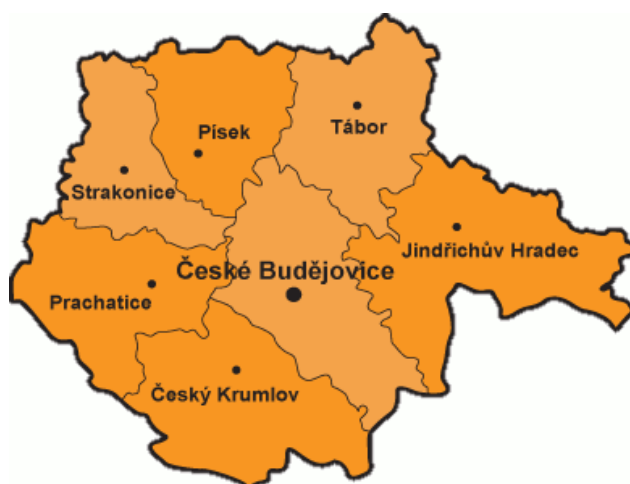
Obrázek 4: Jihočeský kraj

Jihočeský kraj patří mezi jeden z nejkrásnějších krajů v České republice. Kraj je proslulý cestovním a turistickým ruchem. Území Jihočeského kraje je velmi rozsáhlé a vyskytuje se zde mnoho turistických zajímavostí nejrůznějšího druhu. V kraji jsou proslulé tři fenomény: lidová architektura, mnoho památek a rybníků (Soukup & David, 2020).