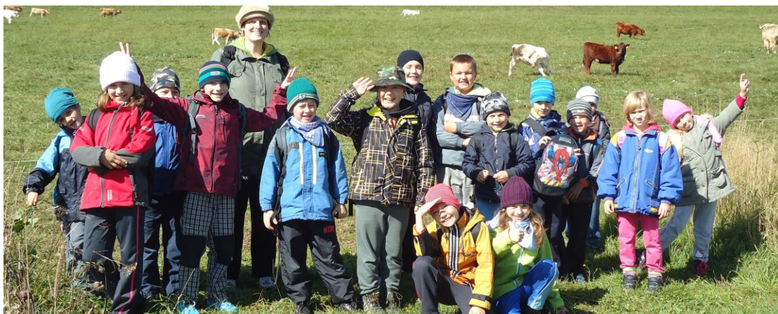
Obr. 8 Škola v přírodě