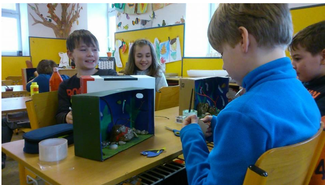
Obr. 4 Pracovní činnosti (výroba 3D akvárek)