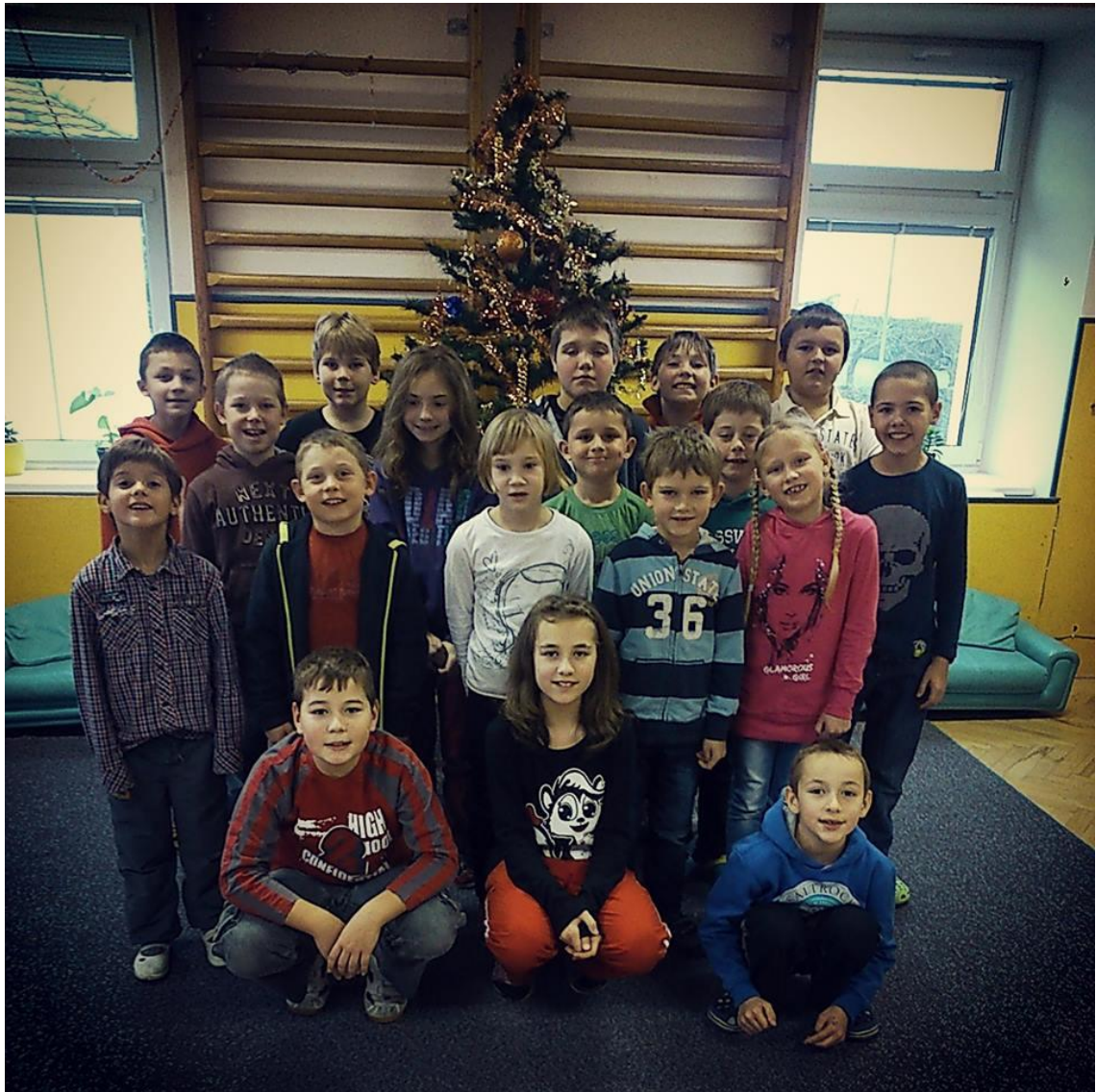
Obr. 2 Vánoce ve škole