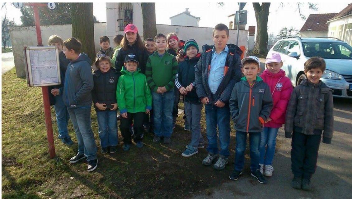
Obr. 3 Výlet do Filharmonie