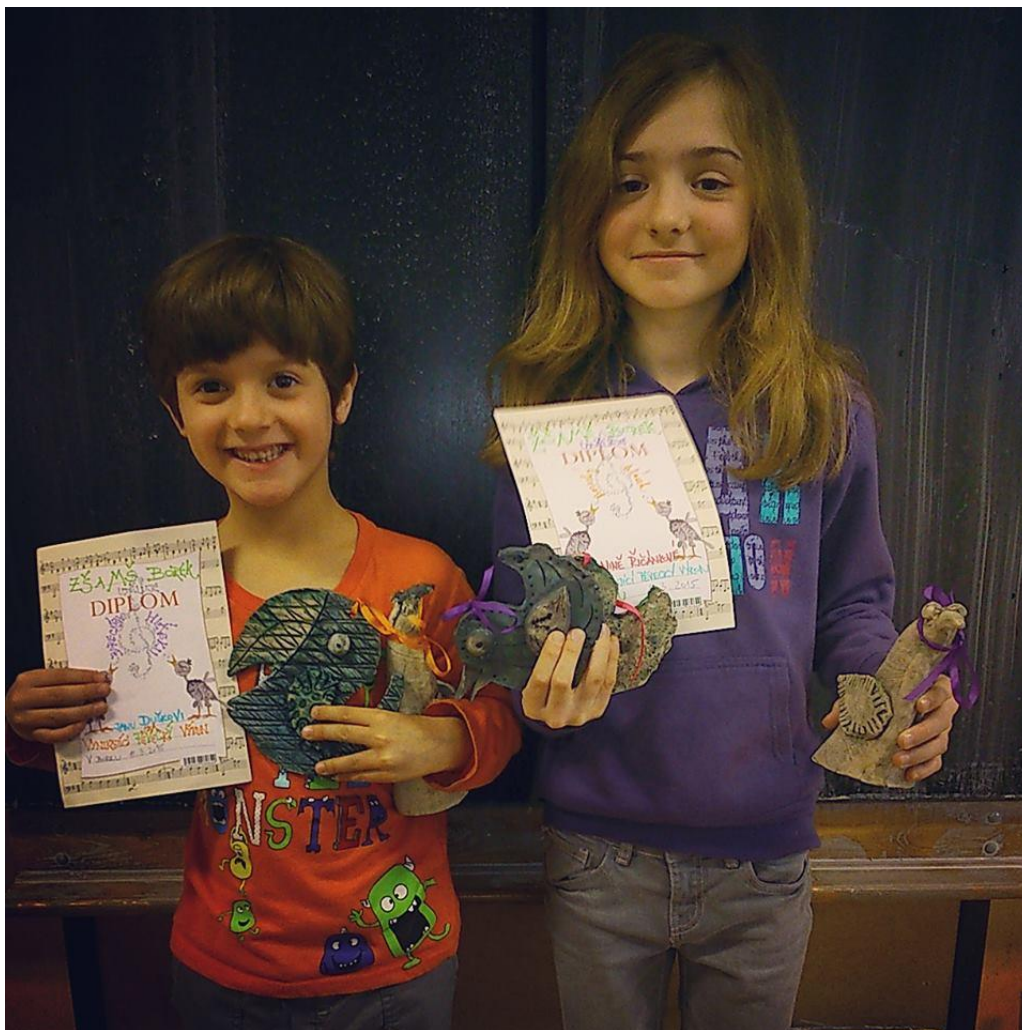
Obr. 6 Soutěž Borecký hlásek