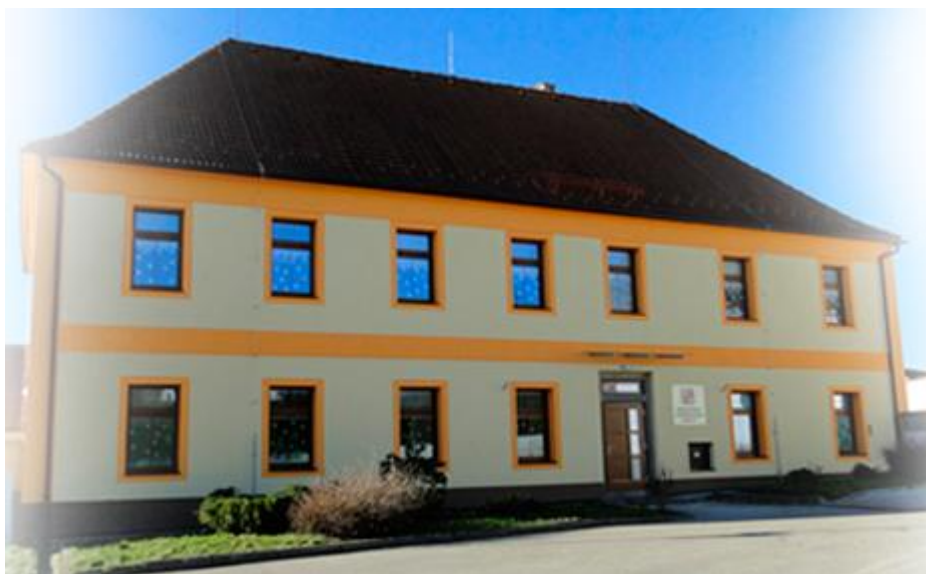
Obr. 1 Nová budova školy