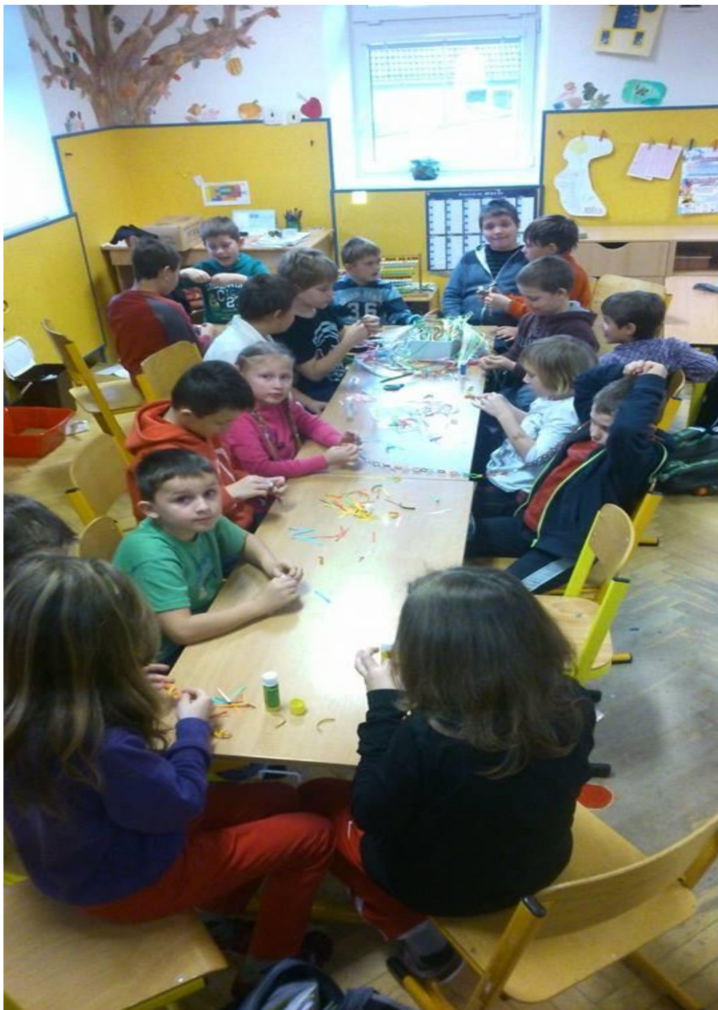
Obr.5 Pracovní činnosti