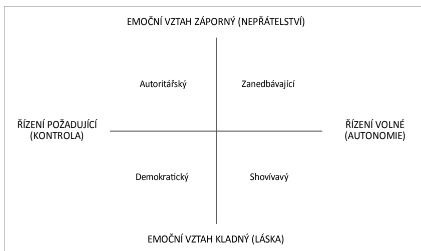
Ilustrace 1: Dimenze výchovných stylů, syntéza Schaefer, Čáp

Při výchově v rodině přijde na to, v jakém poměru se setkávají dva hlavní komponenty. Jedním je láska, která je pro děti životně důležitá. Druhým je kontrola, bez níž by věci ztratily řád. 104 Čáp charakteristiky komponent zobecňuje do dimenzí. Dimenze od emočně kladné k záporné vymezují míru lásky. Dimenze řízení od požadujícího k volnému vymezují míru kontroly. 105