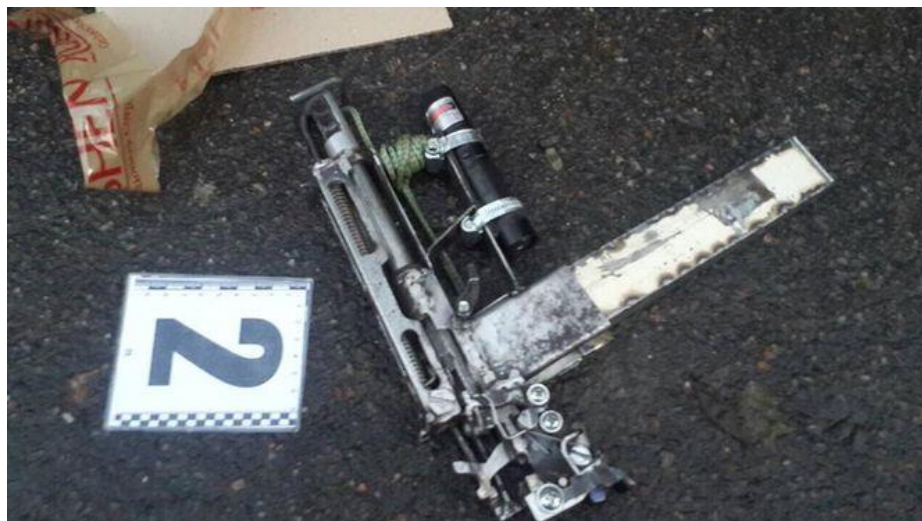
Obrázek 5 Po domácku vyrobená zbraň použitá v Oděse

oběti. Jiné ani z daleka nejsou podobny známým tvarům střelných zbraní a vypadají spíše futuristicky a oko zbraňového lajka, by v nich nehledalo střelnou zbraň. Jedna z těchto zbraní je přiložena na obrázku 5. Tato zbraň byla použita na Ukrajině v Oděse při přestřelce s místní policií. (Gavron, 2018)