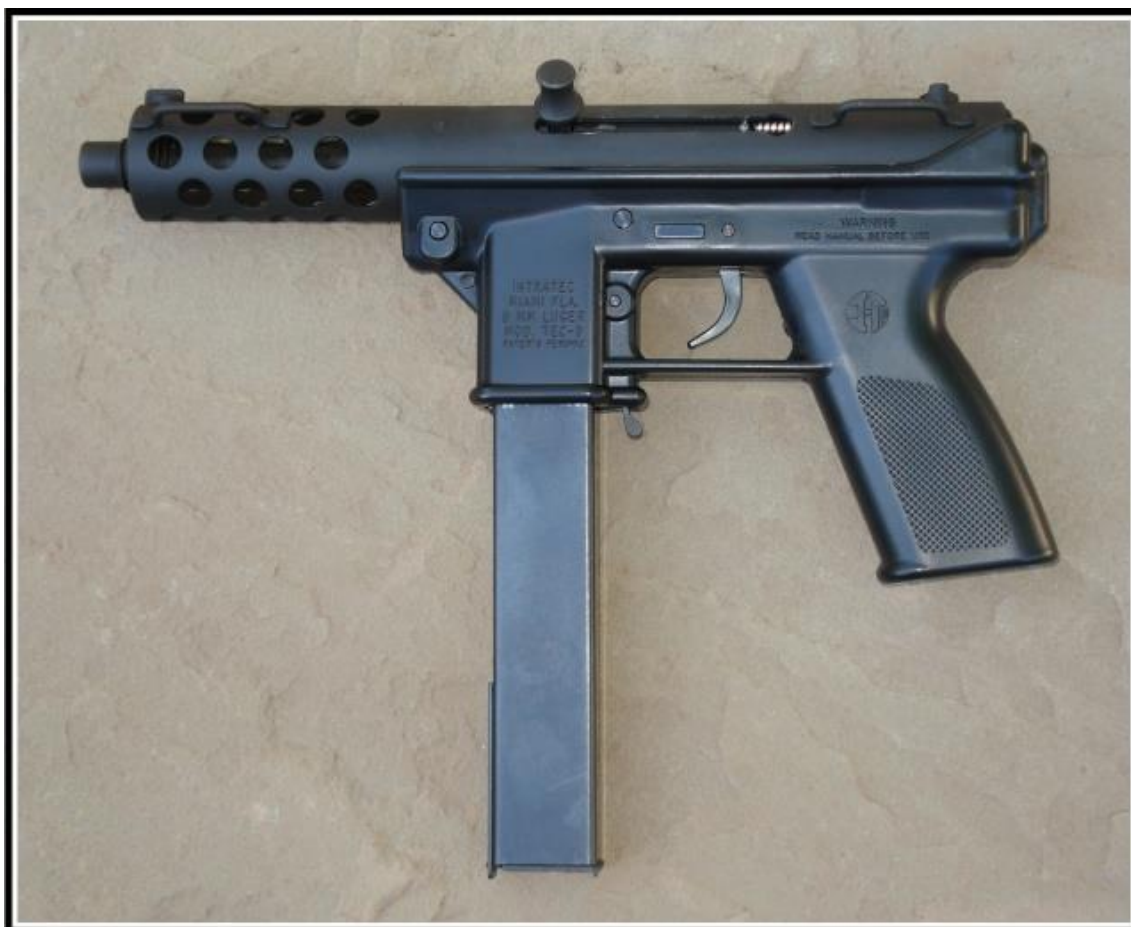
Obrázek 3 Intratec Tec 9

původního strojového zařízení z nějaké zbojní firmy. Země původu není v současné době přesně identifikována. (Gavron, 2018) Na obrázku číslo 3 je vyobrazení této zbraně.