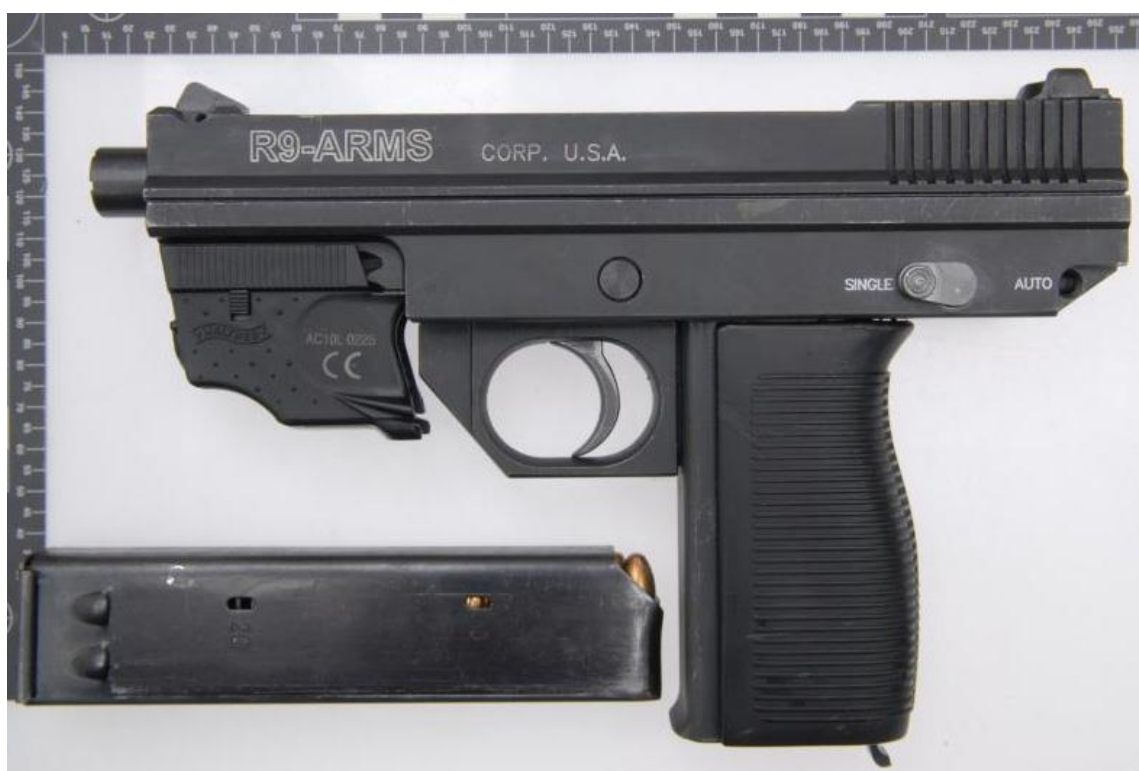
Obrázek 2 R9 ARMS CORP. U.S.A. se zásobníkem

Další známou, nelegálně vyráběnou, zbraní je poloautomatická pistole R9 ARMS CORP. U.S.A., která je vyobrazena na obrázku číslo 2. Název této zbraně odkazuje na neexistující společnost a její pravý původ není zcela znám, pouze se spekuluje o Chorvatsku, jako zemi výrobce. Zbraň se začala po roce 2012 objevovat v Nizozemsku, Francii, Velké Británii, Německu, Belgii a hlavně Chorvatsku. Tato zbraň je profesionálněji zpracována než Agram 2000, popsany v předchozí kapitole. Také je uzpůsobena na používání nábojů kalibru 9 mm, lze jí osadit tlumičem a umožňuje střelbu jednotlivými střelami a dávkou. Jedná se o oblíbenou zbraň v podsvětí, a to hlavně kvůli spolehlivosti a malé velikosti odpovídající pistoli. (McCollum, 2015)