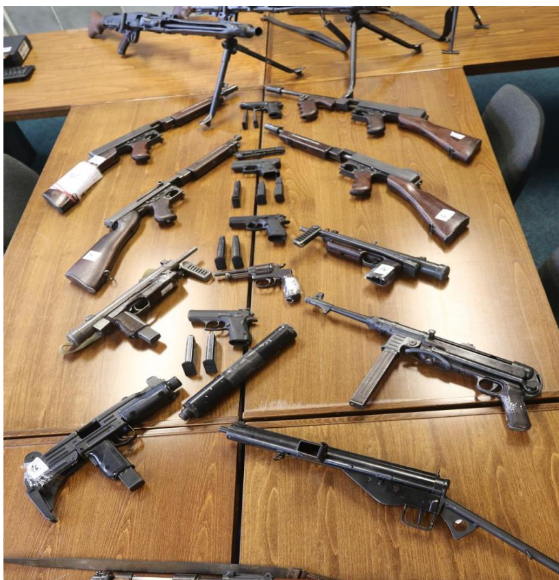
Obrázek 6 Zbraně zabavené NCOZ v březnu 2020

Kriminalisté Národní centrály proti organizovanému zločinu kriminální policie a vyšetřování (dále jen „NCOZ“) obvinili v březnu roku 2020 skupinu mužů z nedovoleného ozbrojování. Skupina kupovala znehodnocené zbraně, které následně reaktivovala a prodávala na černý trh. Celkový odhad reaktivovaných zbraní byl 100 kusů. Při domovních prohlídkách bylo zajištěno více než 10 tisíc kusů střeliva, 7 granátů, 7 kulometů, 12 samopalů, 5 pušek, 8 pistolí, 1 granátomet, 4 tlumiče hluku a větší množství hlavních částí zbraní a dalších dílů. Mezi zajištěnými zbraněmi se nacházela i upravená pistole z původní ráže flobert na ráži 9 mm. Část zajištěných zbraní je na obrázku číslo 6. (Ibehej, 2020)