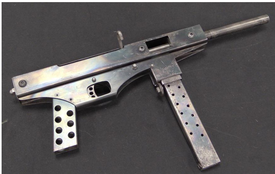
Obrázek 4 Luty's SMG v ráži 9 mm

na internetu knihu s názvem „Jak jednoduše vyrobit domácí samopal“, obsahující i návod na jeho výrobu. Zbraň tohoto konceptu byla následně pojmenována Luty's SMG. Luty byl za sestrojení funkční zbraně a vydání knihy, s návodem na výrobu zbraně pravomocně odsouzen za napomáhání terorismu. Vydanou knihou a konceptem Luty's SMG se inspirovalo nemalé množství lidí po celém světě, a proto je možné se s těmito zbraněmi setkat na různých kontinentech, například v USA, Austrálii, Rumunsku a Velké Británii. (Gavron, 2018) Zbraň je primárně určena k používání střeliva ráže 9 mm a umožňuje pouze střelbu automaticky. Bývá vyráběna v různých dílnách převážně v malém množství, a tak je možné se setkat s různou kvalitou zpracování, modifikacemi a také s využitím i jiných druhů střeliva. Na obrázku číslo 4 je zachycen jedno ze zdařilejších zpracování. (Ferguson, 2017)