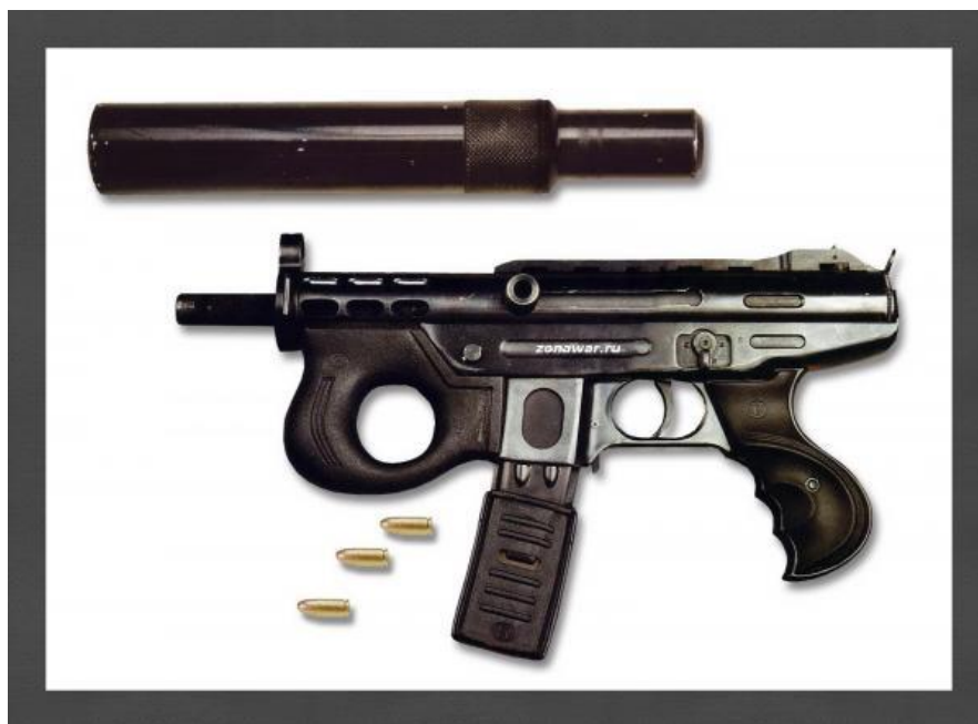
Obrázek 1 Agram 200 s tlumičem a náboji 9 mm

K nejznámějším nelegálně vyráběným zbraním patří samopal Agram 2000, který byl vyvinut v průběhu balkánských válek Chorvatem Mirko Vurgekem pro použití chorvatskými silami. Primárním cílem Vurgeka bylo vyvinutí zbraně, jednoduché na použití, údržbu a hlavně výrobu. Zbraň umožňuje střelbu automaticky, využívá náboje ráže 9 mm a lze jí osadit i tlumičem. Přestože se jedná o jednu z profesionálněji vypadajících zbraní, nikdy nezískala oficiální licenci pro legální výrobu. Zřejmě se na Balkáně stále vyrábí v menších manufakturách. Jedná se o velmi oblíbenou zbraň v kriminálních kruzích, ale ne zřídka se vyskytuje i na válečných bojištích. V České republice byl Agram 2000 kupříkladu využit v roce 2001 při přestřelce drogových gangů v Praze. Agram 2000 s tlumičem a náboji je vyobrazen na obrázku číslo 1. (Oddball Croatian room-broom: The Agram 2000)