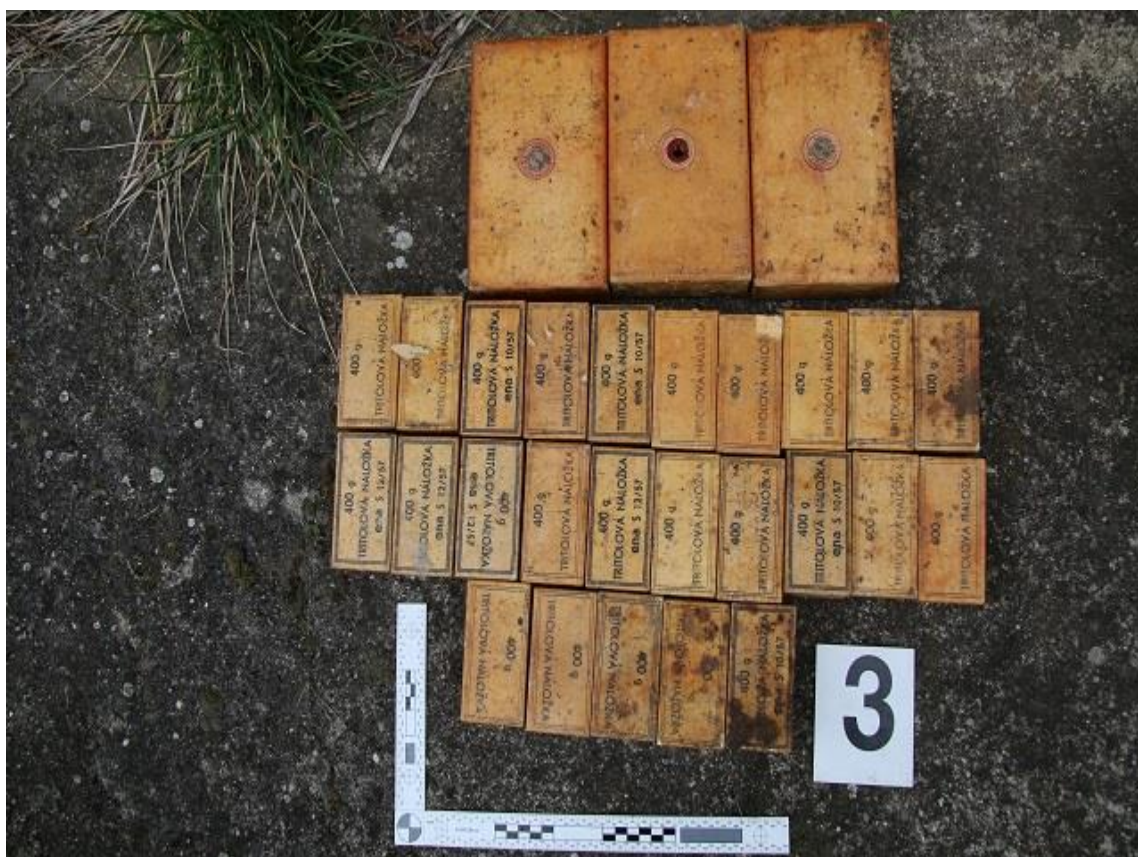
Obrázek 7 Zajištěné trhaviný při vyklizení pozůstalosti

Značné množství nelegálních zbraní je objeveno až po smrti majitele. Obdobně tomu bylo i v dubnu 2019 na Břeclavsku při vyklizení nemovitosti po zesnulém muži. Při vyklizení bylo objeveno větší množství nelegálně držených nábojů, dělostřeleckých granátů a trhavin. Právě důvody a účel vlastnictví těchto předmětů se již asi nepodaří zjistit. Na obrázku číslo 7 jsou zajištěné trhaviný při vyklizení pozůstalosti. (Haraštová, 2019)