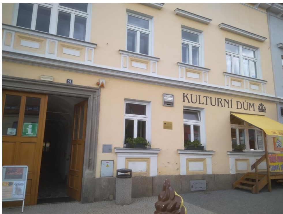
Obrázek 13.: kulturní dům Koruna (zdroj: vlastní).