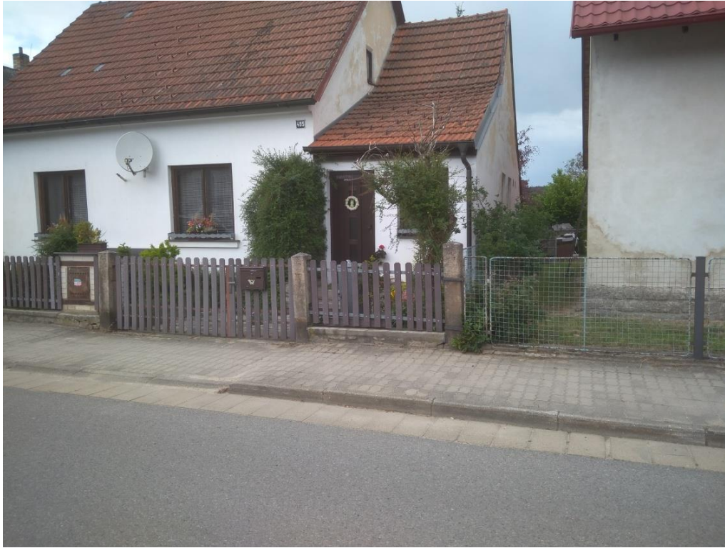
Obrázek 17.: dům s číslem popisným 495.