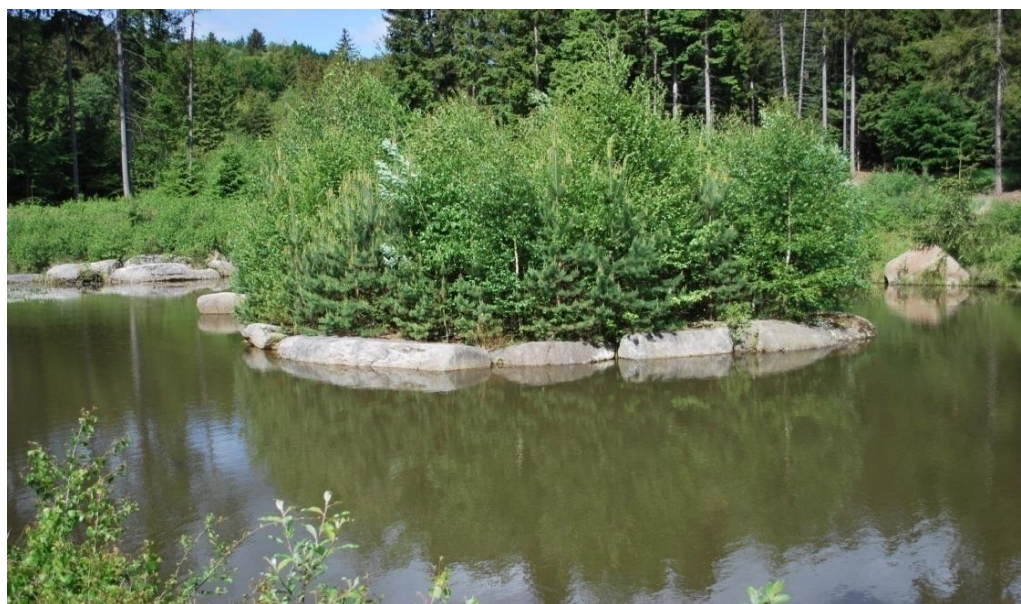
Obrázek 20.: rybník v České Kanadě.

Současné území České Kanady se formovalo po dobu více než jednoho tisíciletí (JIRÁSKO, 2011). Rozloha České Kanady činí něco kolem 250 km 2 a sdružuje více než 50 obcí. Nachází se na jihu České republiky u státní hranice s Rakouskem, mez obcemi Slavonice, Kunžak, Nová Bystřice a Český Rudolec. Česká Kanada se skládá převážně z rozsáhlých neporušených lesů, skalních útvarů, rybníků a různých stezek (JIHOČESKÝ KRAJ, 2017).