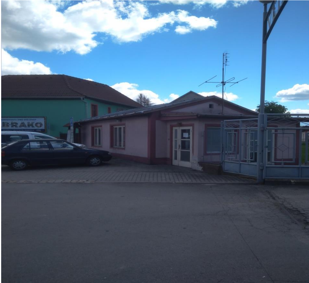
Obrázek 14.: dům s číslem popisným 133 v roce 2020.