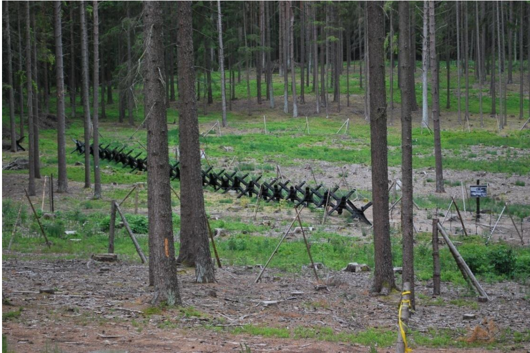
Obrázek 23.: Československé protitankové opevnění.