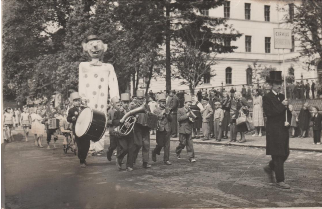
Obrázek 12.: masopustní průvod.