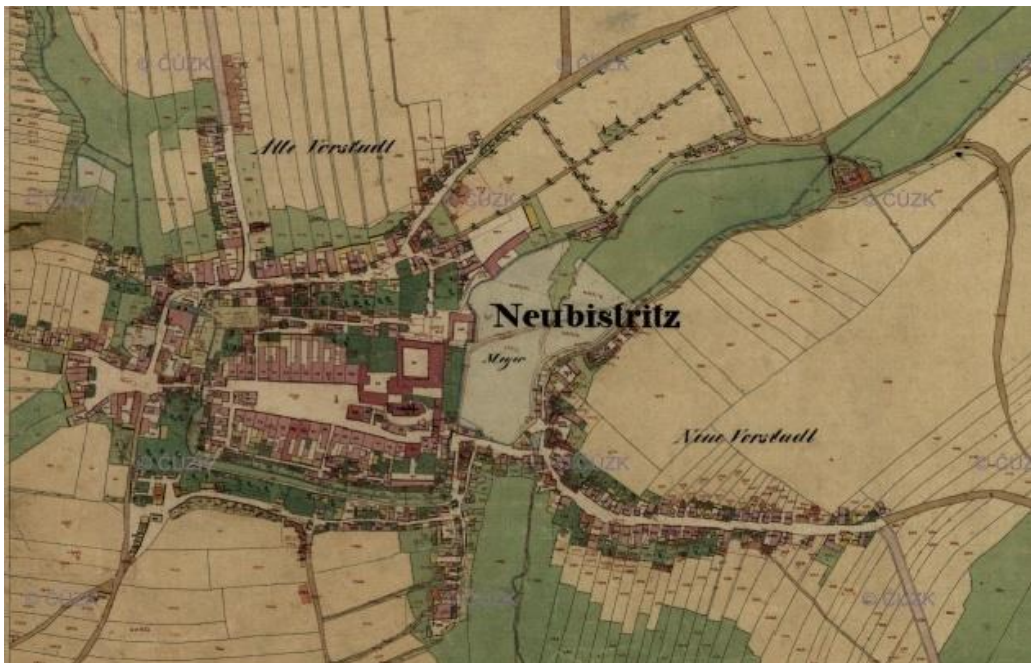
Obrázek 5.: výřez mapy Nové Bystřice z období mezi 1824 – 1843.