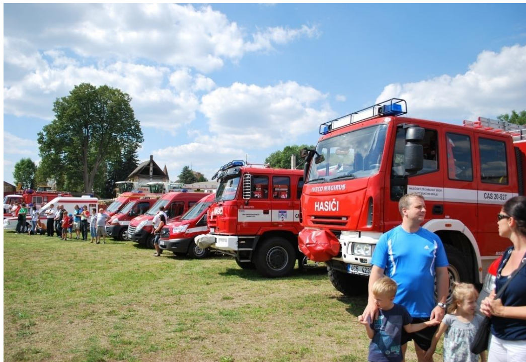
Obrázek 10.: hasičské slavnosti - technika 2015.

červeného kříže při dopravní nehodě osobního vozidla. Akci navštívili dokonce i některé Rakouské sbory se svojí technikou (GARTHOFER, 2015).