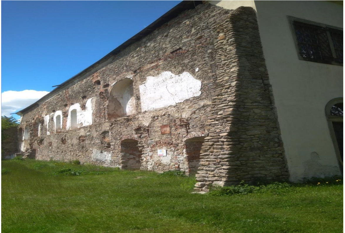
Obrázek 29.: poslední náznak toho že zde stával klášter.

V místech kde se nacházel klášter, se do dnešní doby zachoval pouze kostel Nejsvětější Trojice, který byl postavený v letech 1668-1682. Kostel byl vybudován ve stylu baroka a měl hned několik zajímavostí. Jedna z nich byla velký dřevěný oltář, který byl druhý největší v celé Evropě a největší zajímavostí byl unikátní bezmála dva metry vysoký Strom života. Strom života je unikátní dřevorezba z druhé poloviny sedmnáctého století, pravděpodobně jihoněmeckého původu. Tento unikát byl kompletně restaurován a roku 2001 vystaven v národní galerii v Praze. Začátkem listopadu roku 2001 došlo k přesunu Stromu života do Muzea Jindřichohradecka. Přímo pod kostelem se nachází krypta, kterou je možno navštívit. Kostel bohužel dlouhé roky chátral, ale v posledních letech dochází k renovaci (JANOŠOVÁ, 2007).