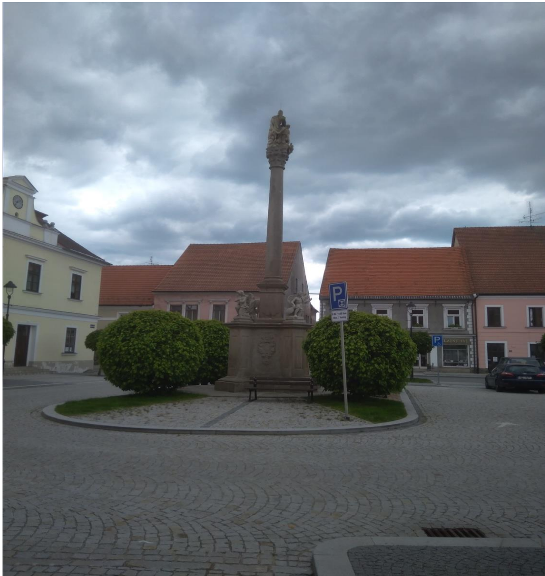
Obrázek 2.: Morový sloup.

Následně panství okolo roku 1693 připadlo rodu Fünfkriehenů, do něhož se provdala Kateřina Terezie Slavatová. Rodu Fünfkriehenů patřilo město dlouhých 114 let. V roce 1713 ve městě včetně starého předměstí bylo 112 domů a na novém předměstí 38 domů. Roku 1774 došlo v Bystřici k dalšímu požáru, který se rozšířil ze zámku. Požár poznamenal také radnici, kostel, 68 domů a 33 stodol. Domy na náměstí dostaly po přestavbě podobu, ve které je můžeme vidět v dnešní době. Po zrušení paulánského kláštera Nejsvětější Trojice koupila okolní pozemky hraběnka Clary und Aldringen z rodu Fünfkriehenů. Na těchto pozemcích vznikla osada dnes známá jako Klášter. Za její vlády začala v Bystřici fungovat panská přádelna a tkalcovna.