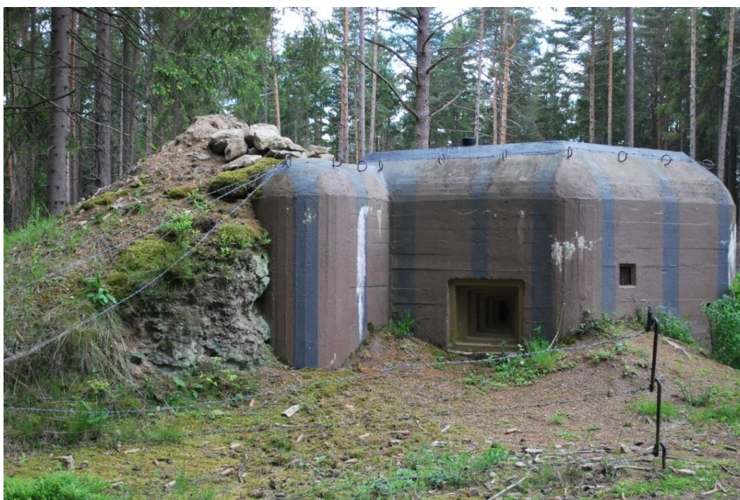
Obrázek 22.: Československý bunkr z druhé světové války.

Jedná se o muzeum československého opevnění, které se nachází České Kanadě v blízkosti Slavonic. Toto muzeum vzniklo v roce 1992 a jedná se o nejstarší muzeum tohoto druhu v jižních Čechách a jedno z nejstarších v celé České republice. Je tvořeno osmi objekty lehkého opevnění, které byly vybudované v létě roku 1938 k obraně Československa před nacistickým Německem. Nejzajímavější je bunkr označený číslem 159, který je zařízen a vybaven tak jak byl v době mobilizace v roce 1938. Mimo bunkry zde můžeme vidět také zákopy, protitankové zátarasy nebo strážní chatu (SVITÁK, 2007).