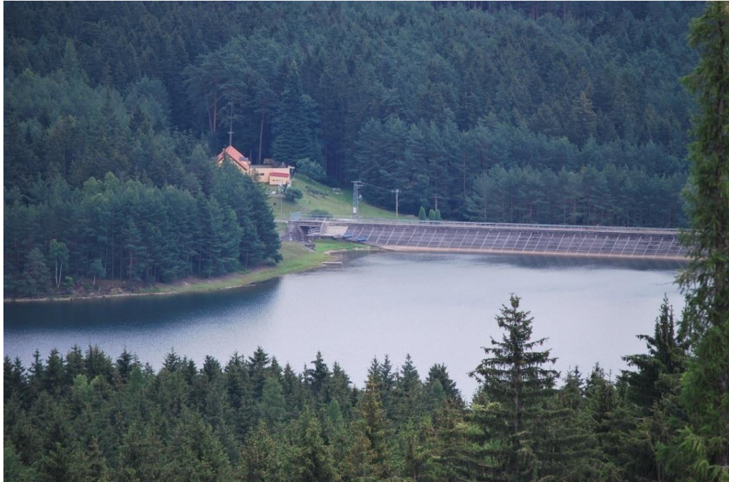
Obrázek 27.: Nádrž Landštejn.

Hrad Landštejn byl vybudován nejpozději v první polovině 13. století za vlády českého krále Přemysla Otakara I. Do hradu vedou dva prameny, jeden do studny ve střední části hradu a druhý do místa poslední obrany takzvaného donjonu (MAJER, 2000). Landštejn byl vybudován jako strážní hrad, k zabezpečení zemské hranice. Tento hrad střežil nejen zemskou stezku, ale i část hranice mezi Rakouskem a českými zeměmi.