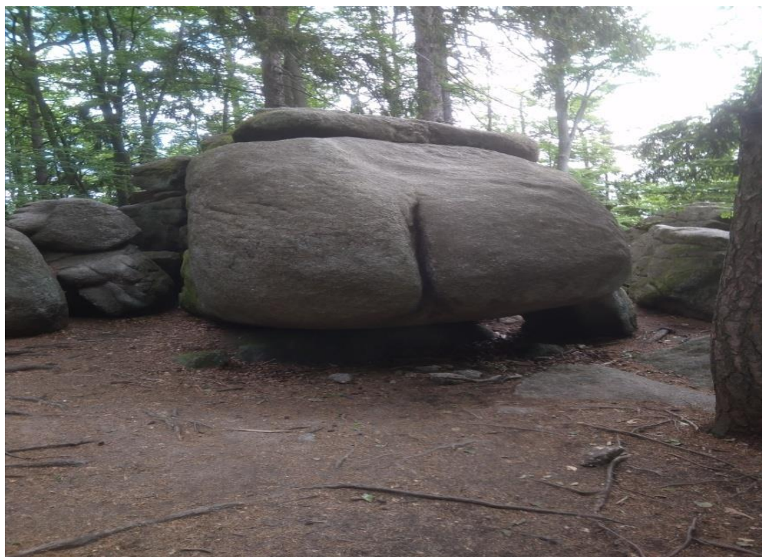
Obrázek 21.: Ďáblova prdel.

Další významnou částí zdejší krajiny jsou rozsáhlé skalní útvary, které pomáhají dotvářet zdejší charakter. Jedná se hlavně o žulové skalní útvary v podobě kamenných ostrůvků, skalních misek nebo mohutných balvanů na březích rybníků nebo přímo v nich. Nejvyšším bodem této oblasti je útvar nazývaný Vysoký kámen, který v minulosti sloužil jako hraniční bod Čech, Moravy a Rakouska. Na vysokém kameni byla v letech 1860 až 1890 rozhledna, která sloužila jako významný bod zeměměřičské sítě a dodnes je zde trigonometrický pilíř. Za nejznámější skalní útvar je v České Kanadě považována Ďáblova prdel.