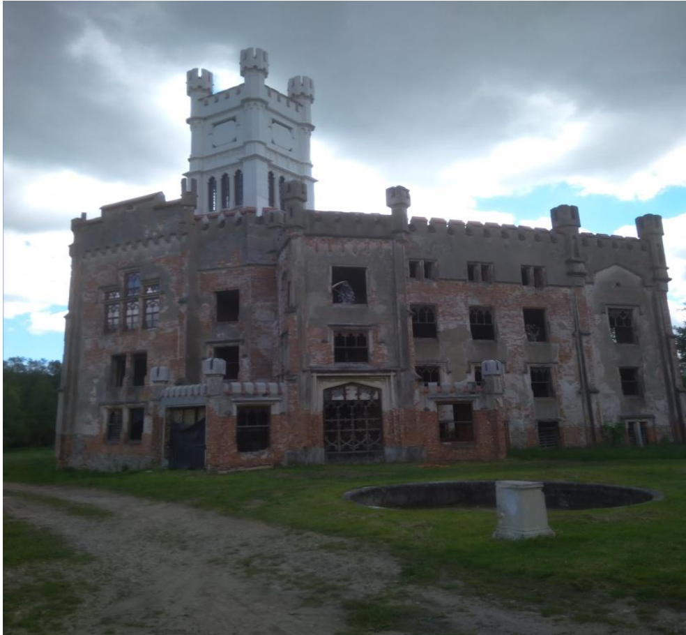
Obrázek 31.: Český Rudolec.