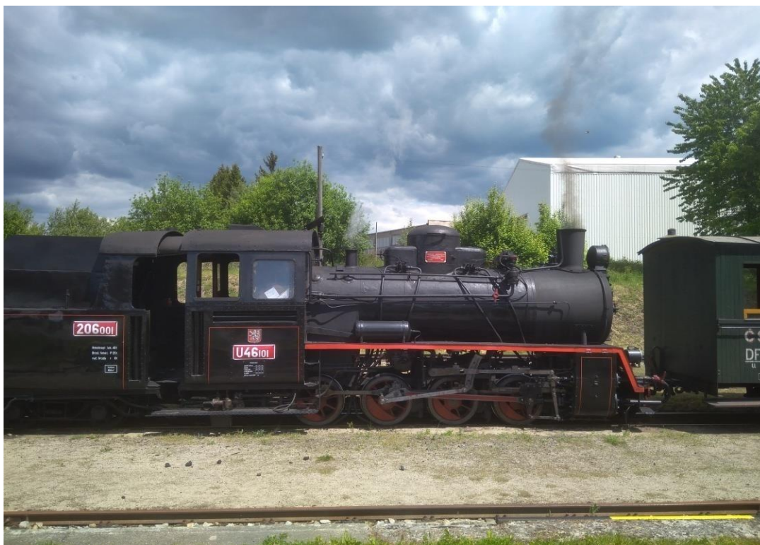
Obrázek 25.: Úzkokolejka.