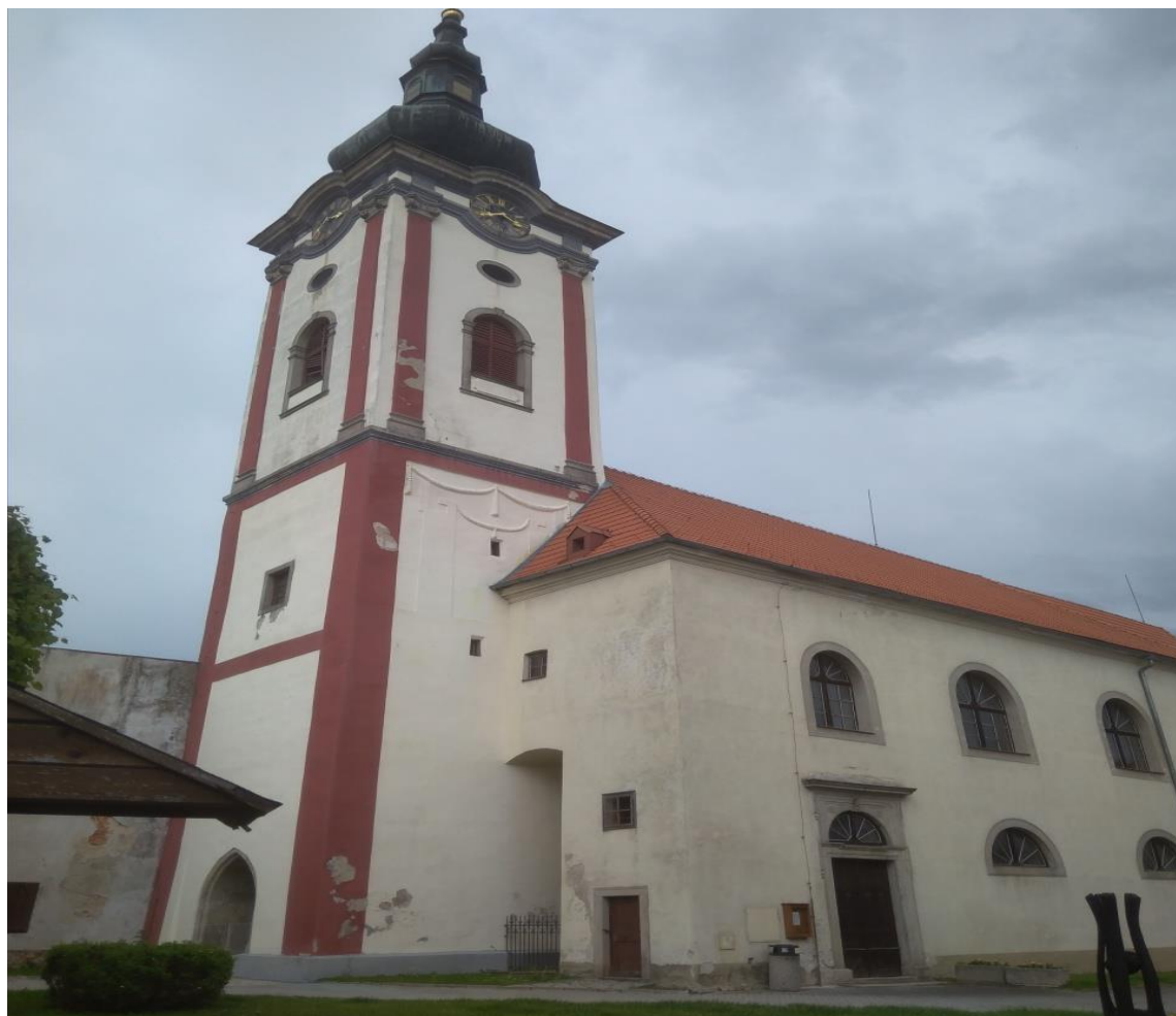
Obrázek 1.: Novobystřický kostel.

a Pavla. Pod kostelem se nachází základy sakrální kruhové stavby o vnitřním průměru 13,5m. Kolem kostela se v této době nacházel první městský hřbitov, který byl oddělen od zámku vysokou zdí a vydržel zde až do vlády Josefa II. Okolo obce byly hradby a vodní příkop, do kterého se přiváděla voda z potoků, které byly okolo Bystřice. V době, kdy byl vlastníkem panství Vilém z Landštejna, došlo k povýšení Bystřice na město.