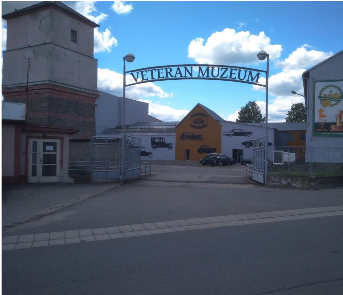
Obrázek 8.: Veterán muzeum.

Roku 2017 dochází v Bystřici k znovuzaložení pivovaru, který zde fungoval v roce 1482. Pivovar se nachází v areálu Veterán Muzea a vaření piva bylo obnoveno na jaře roku 2018. Vaří se zde převážně pivo plzeňského typu, ale jsou zde i různé speciály. K vaření zdejšího piva se používají české slady a žatecký chmel. Místní piva jsou nefiltrovaná a nepasterizovaná.