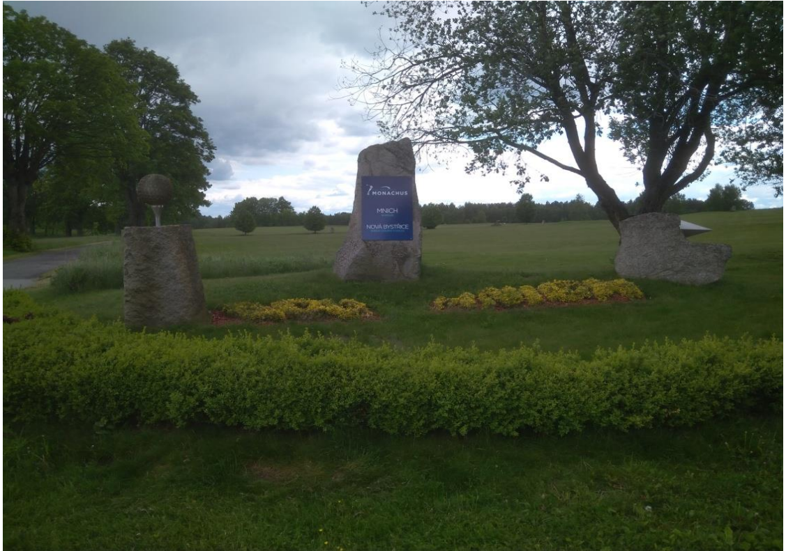
Obrázek 26.: Golfové hřiště Mnich (zdroj: vlastní).