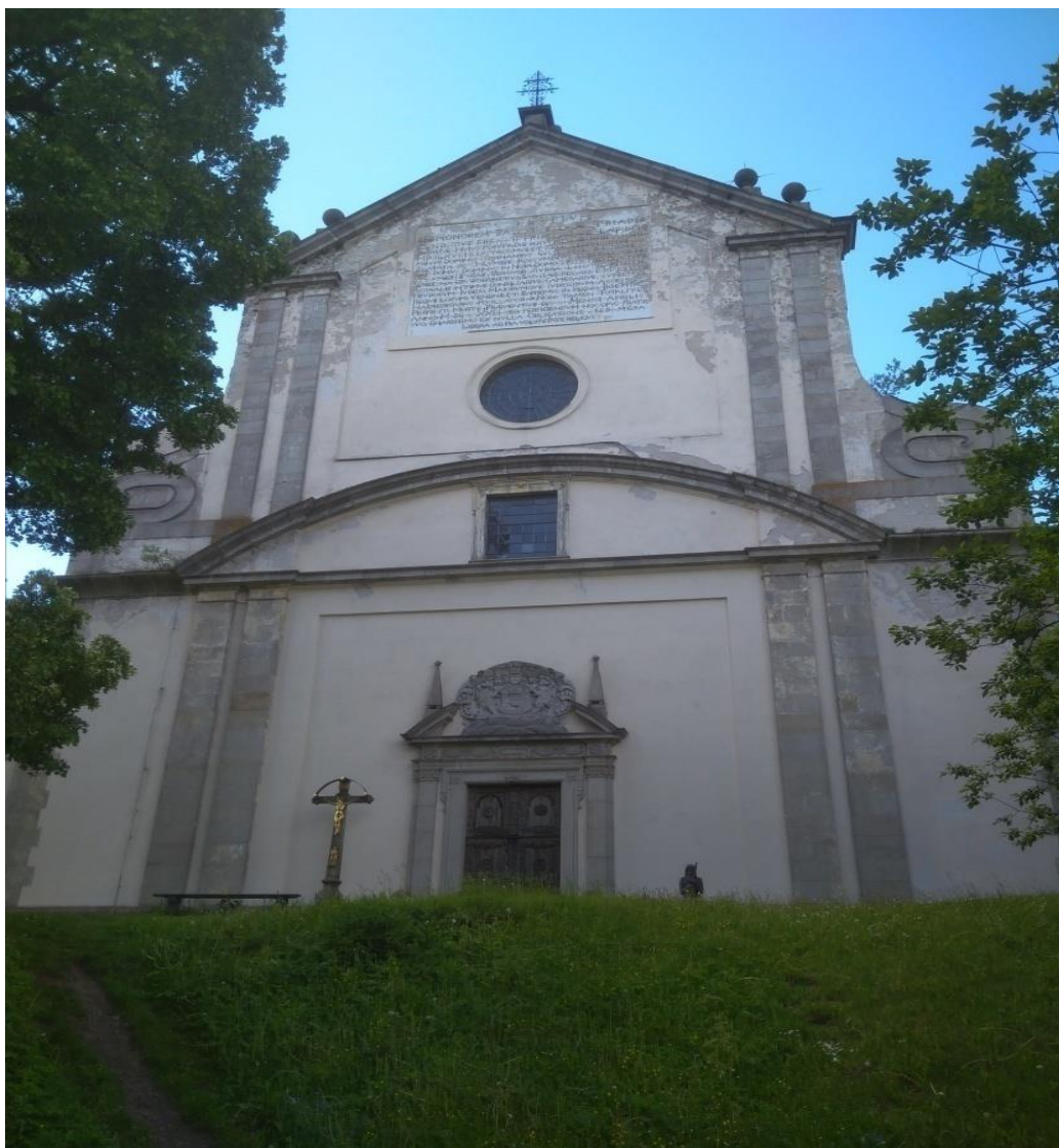
Obrázek 30. kostel Nejsvětější trojice