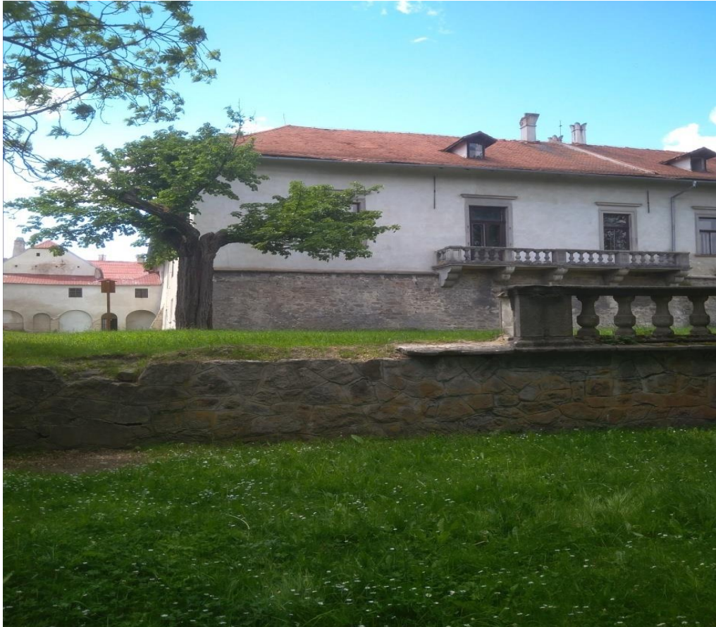
Obrázek 4.: Kalopanax pestrý a Bystřický zámek.