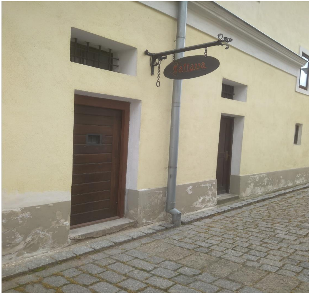
Obrázek 9.: Věznice.