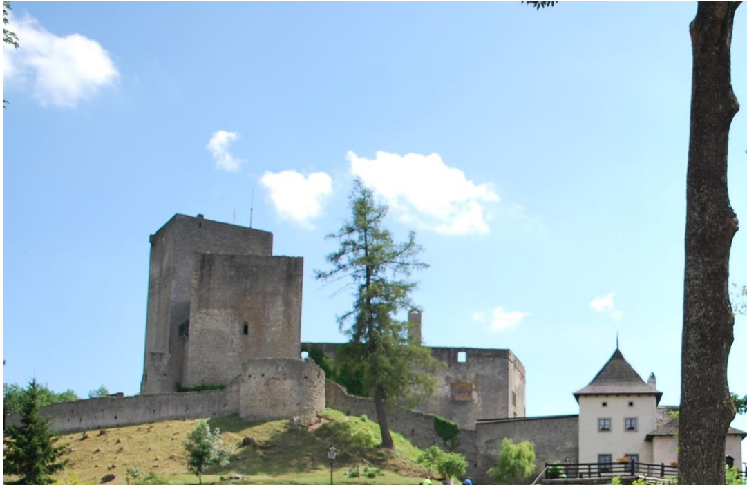
Obrázek 28.: hrad Landštejn.