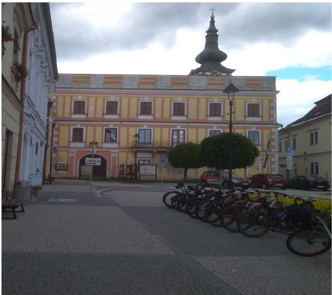
Obrázek 3.: Hochbergův dům.