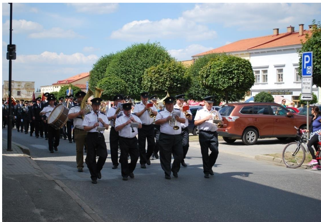
Obrázek 11.: hasičské slavnosti - 2015.