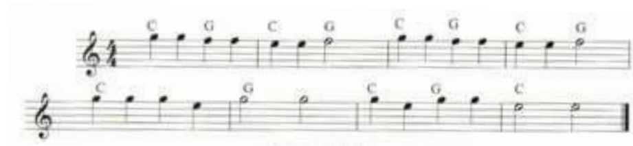
Obrázek č. 8: Chodí pešek okolo