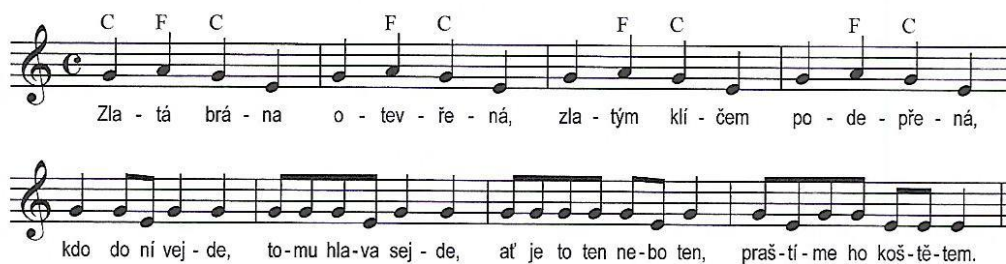
Obrázek č. 9: Zlatá brána