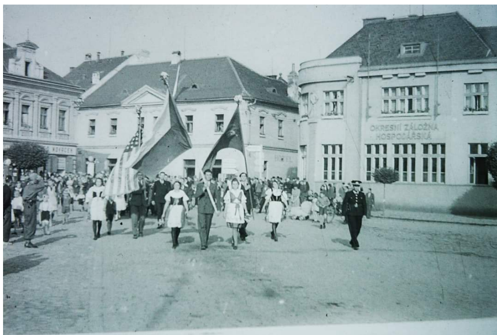
Obr. 6 - Slavnostní průvod náměstím Netolic, 1945