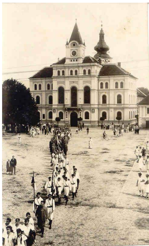
Obr. 2 - Sokol Netolice – příprava na I. Vsesokolský slet