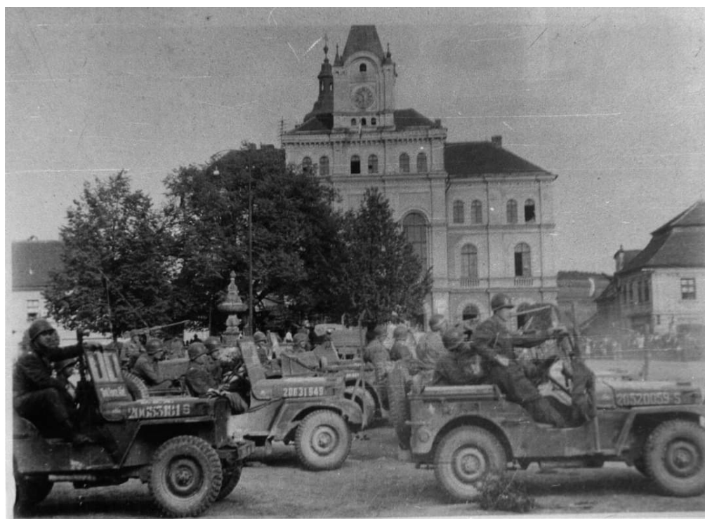
Obr. 5 - Osvobození Netolic americkou armádou, 1945