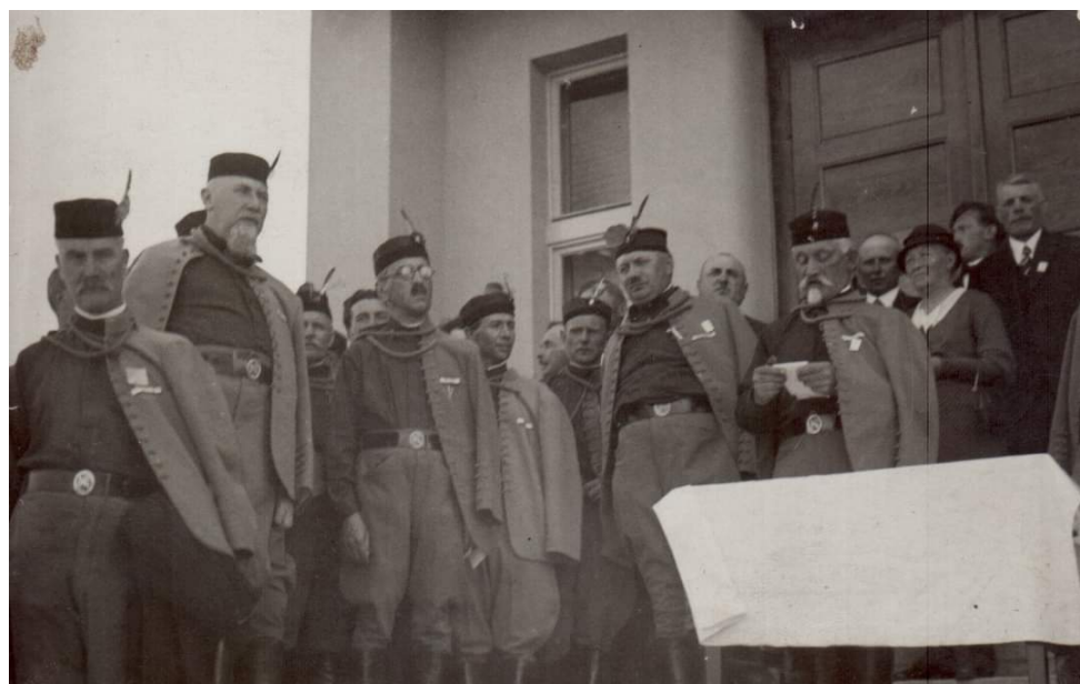
Obr. 3 - Členové vedení Sokola - Netolice, 1927