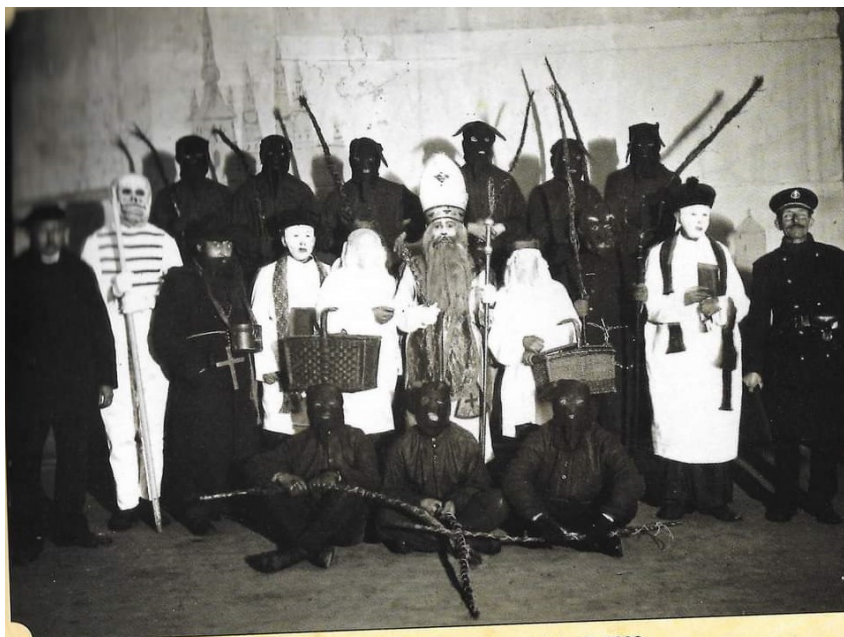
Příprava na mikulášský průvod, členové Divadelního spolku Tyl 6. 12. 1923 Vorbereitungen für den Nikolaus - Umzug, Mitglieder des Theatervereins „Tyl“ am 6. 12. 1923 Preparation for the St. Nicholas pageant, members of the Tyl Theatre Group on 6 December 1923