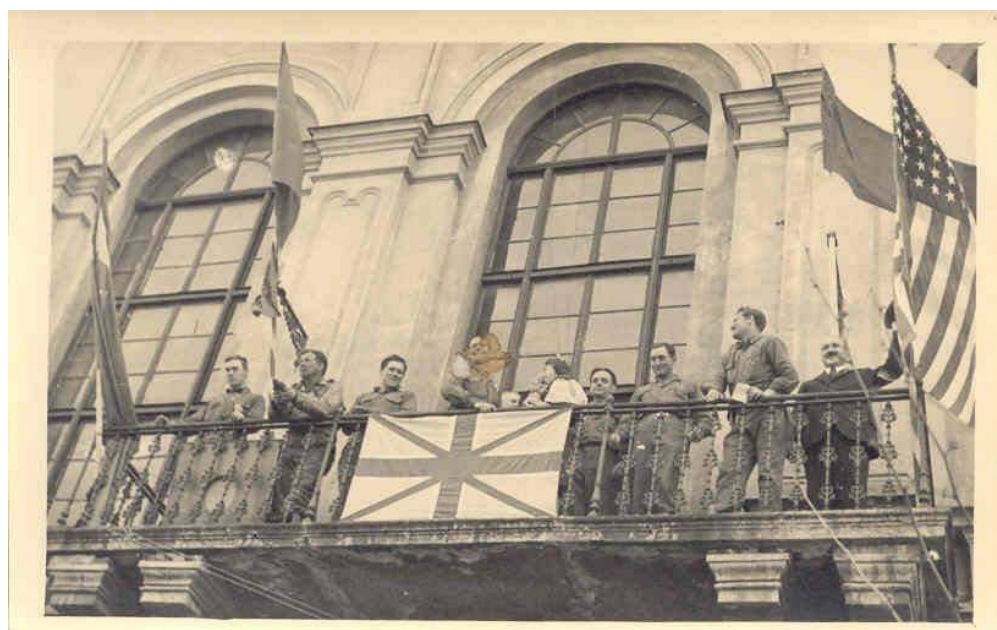
Obr. 7 - Děkování osvoboditelům na radnici Netolic, 1945