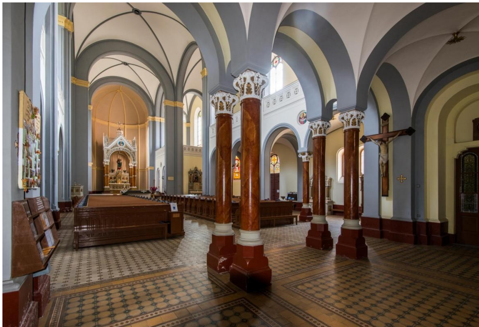
Obr. č. 14