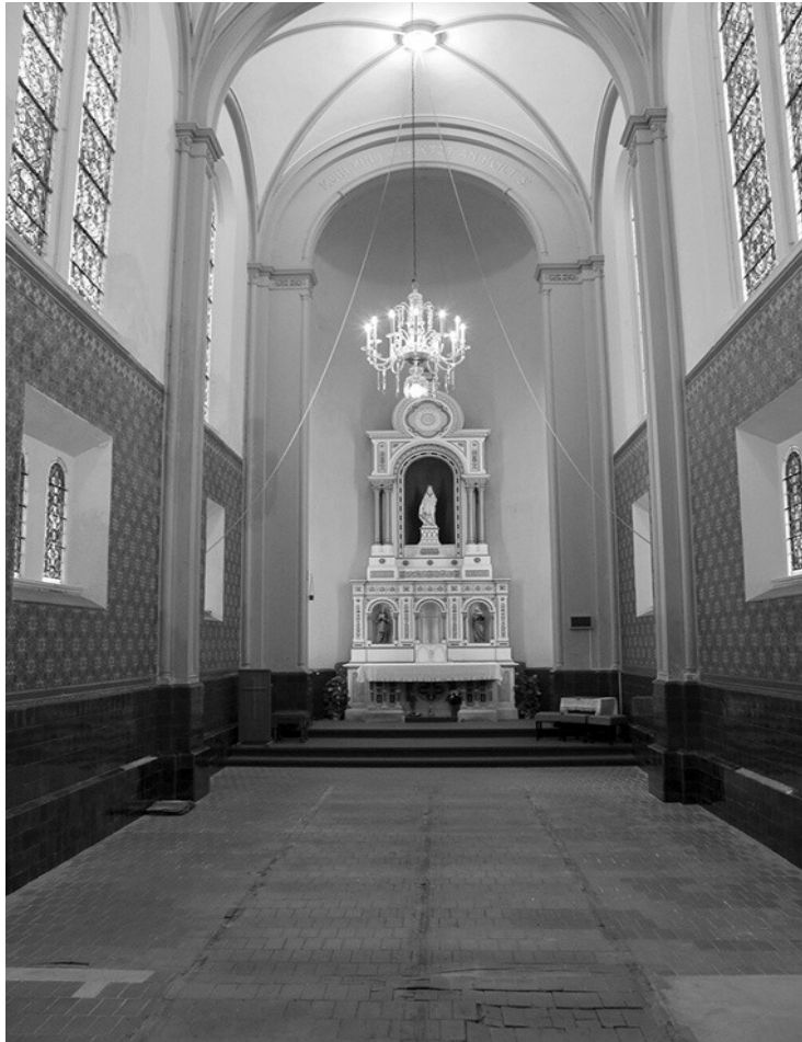
Obr. č. 13