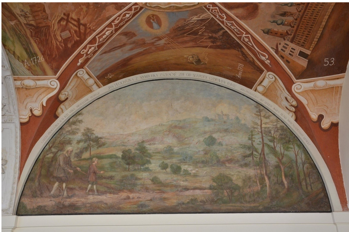
Obr. č. 21