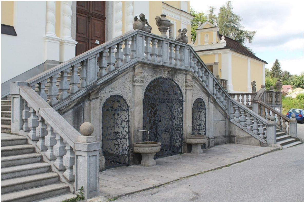
Obr. č. 23