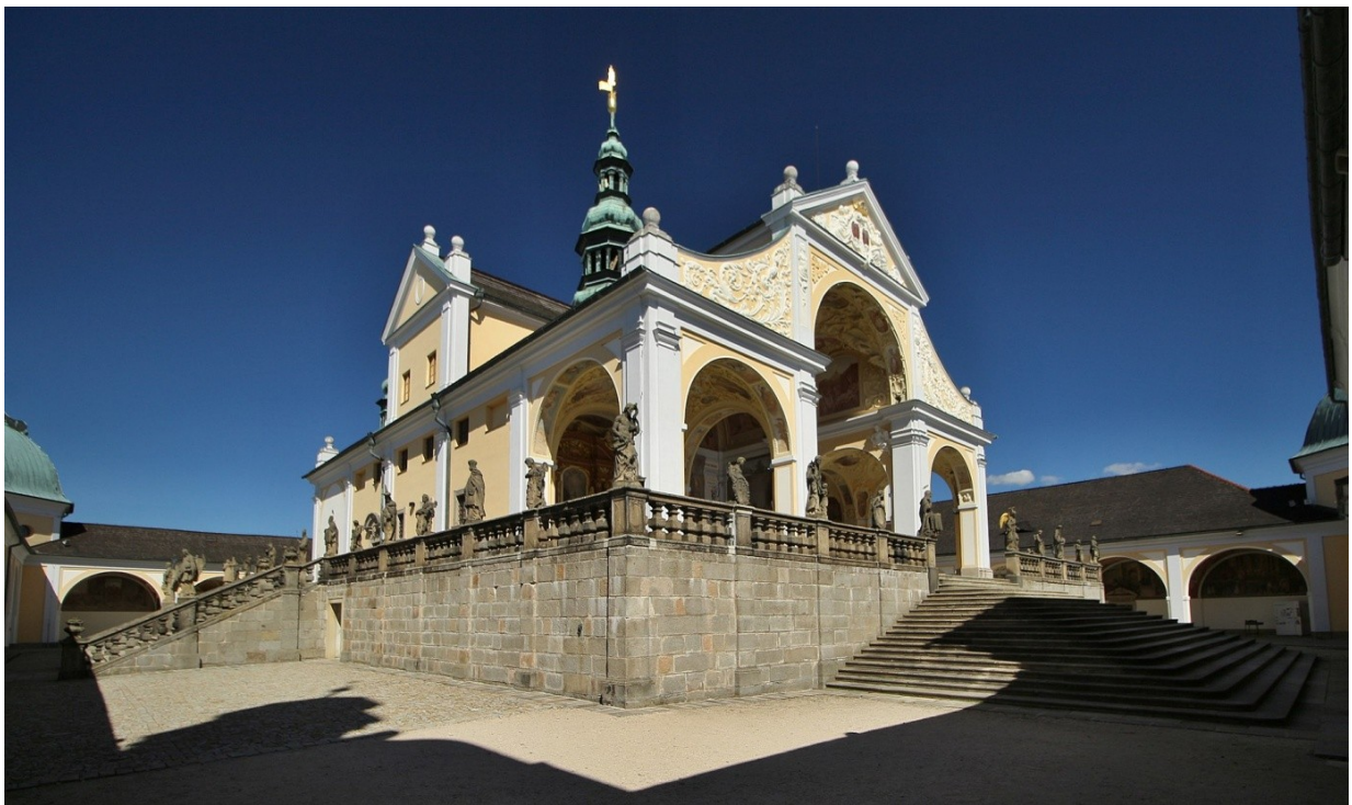
Obr. č. 18