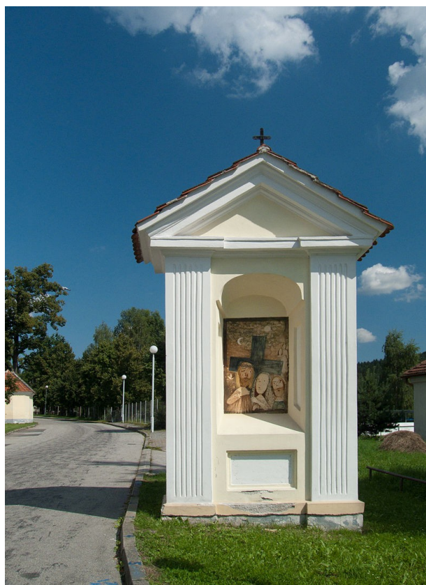
Obr. č. 10