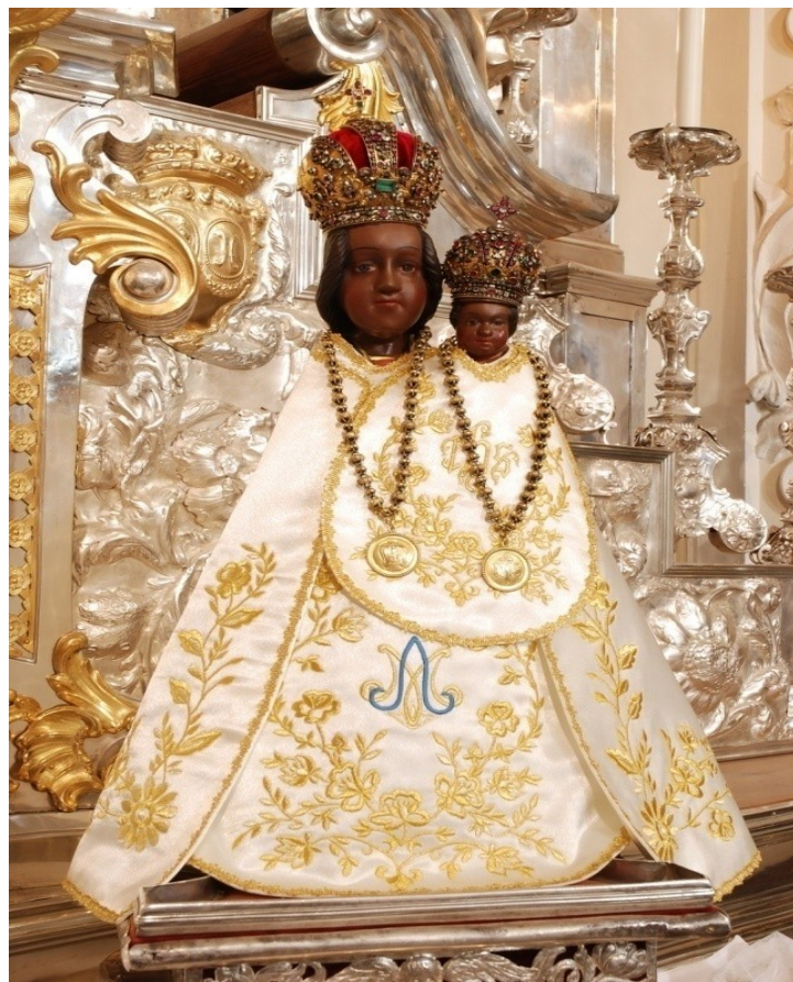
Obr. č. 20