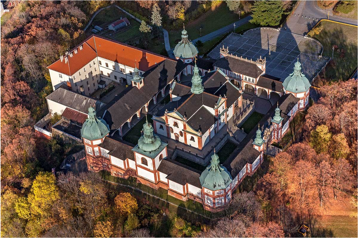
Obr. č. 17