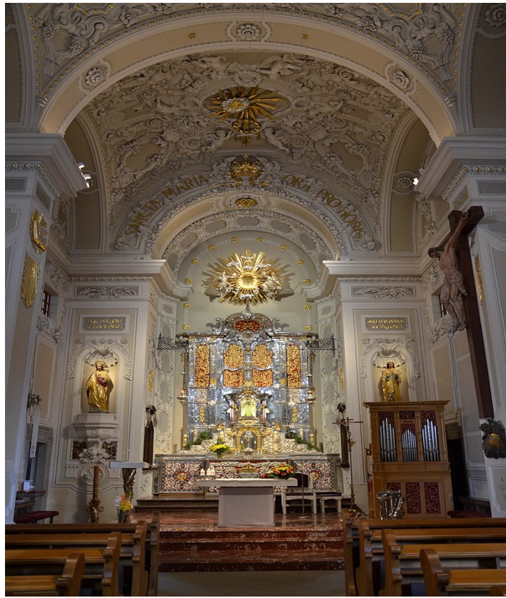
Obr. č. 19