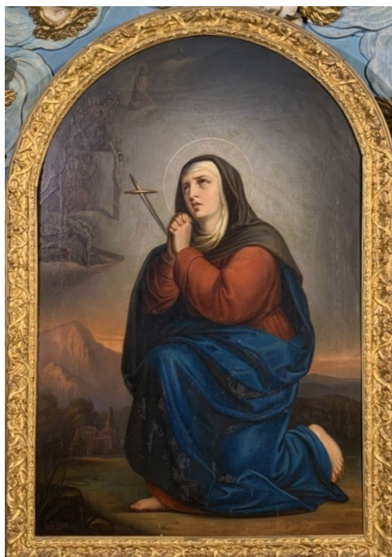
Obr. č. 9