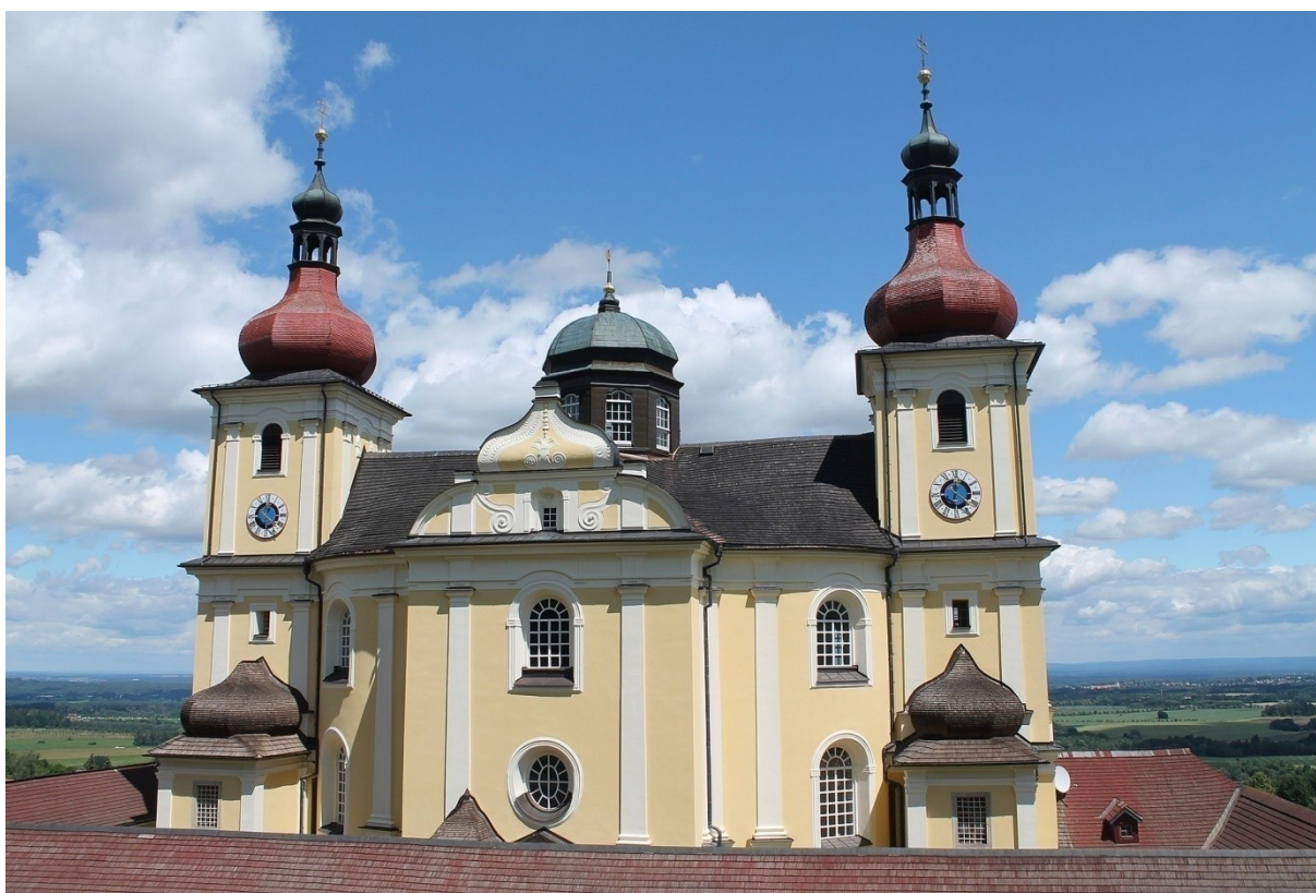
Obr. č. 22