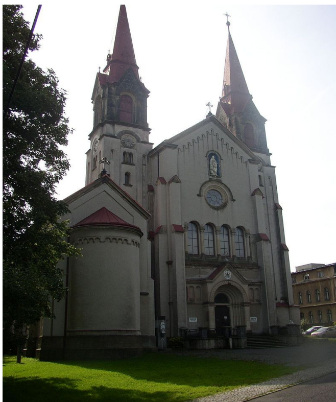
Obr. č. 12