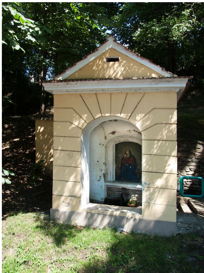
Obr. č. 11