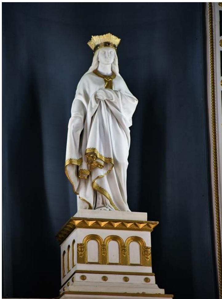
Obr. č. 15