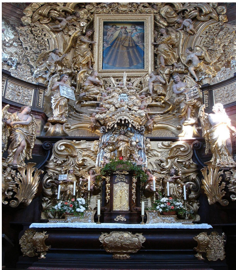
Obr. č. 24