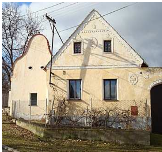
Statek č.p. 27 - Chvalovice