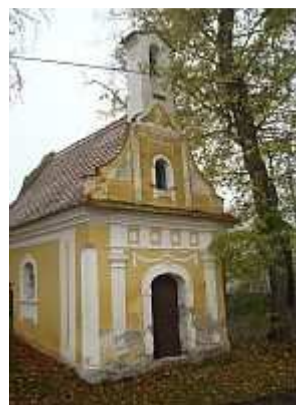
Návesní kaple - Zvěřetice