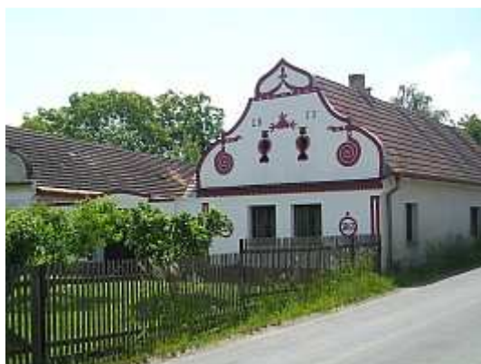
Statek č.p. 28 - Olšovice