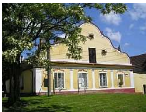
Statek č.p. 26 - Mahouš