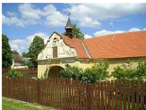
Kovárna - Mahouš