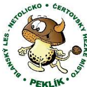
Obrázek 5: Logo MAS Blanský les - Netolicko