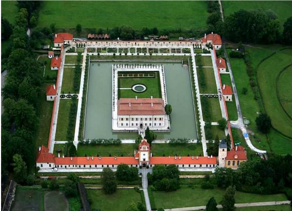
Zámek Kratochvíle - letecký pohled