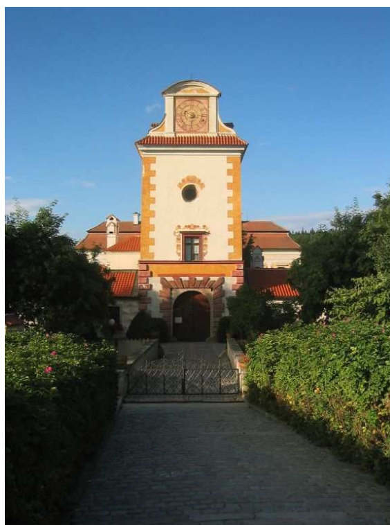
Letní sídlo Kratochvíle - Netolice