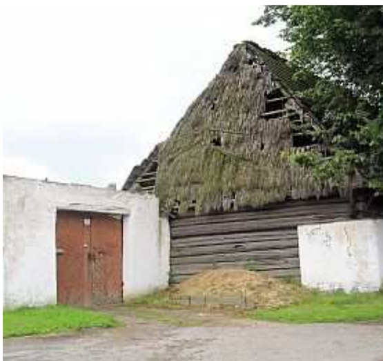
Roubená stodola č.p. 1 - Malovice