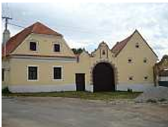
Statek č.p. 31 - Hracholusky