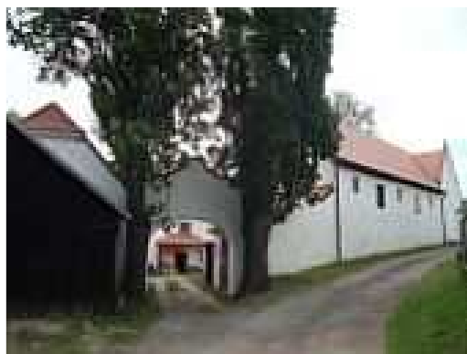
Bürgerův mlýn - Vitějovice