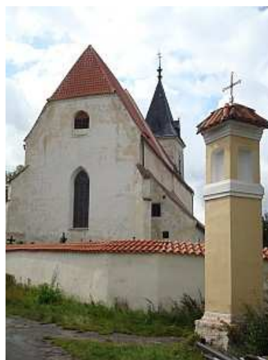
Kostel sv. Mikuláše - Němčice