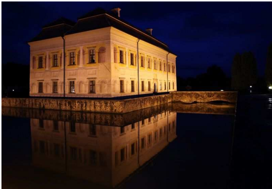
Zámek Kratochvíle - vila