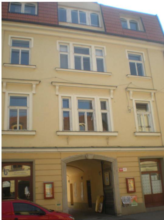
Revizní oddělení Krajské finanční správy v Českých Budějovicích. Krajinská č. 42: