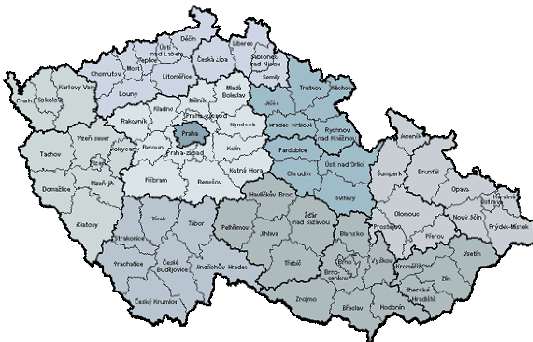
Obr. 1: Územní působnost finančních ředitelství [23].

Jako součást soustavy územních finančních orgánů byla, jako orgány druhé instance, zřízena finančních ředitelství a jako orgány první instance pak vznikly finanční úřady (jejichž původní počet by 218, v roce 2010 už zmíněných 199). Na následujícím obrázku je znázorněna územní působnost finančních ředitelství.