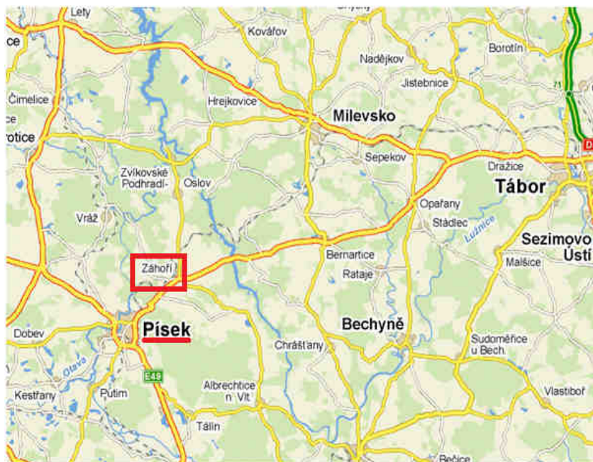
Mapa č. 2: Vymezení obce Záhोří

Lokalizace je pro objekt velmi vhodná neboť knihovna, čítárna, kulturní sály a infocentrum v této oblasti chybí, ale zařízení tohoto typu by mohly být velmi vyhledávané. Vliv stavby na své okolí bude kladný a to zejména z funkčních a estetických důvodů. Na ŽP nebude mít objekt záporné vlivy.