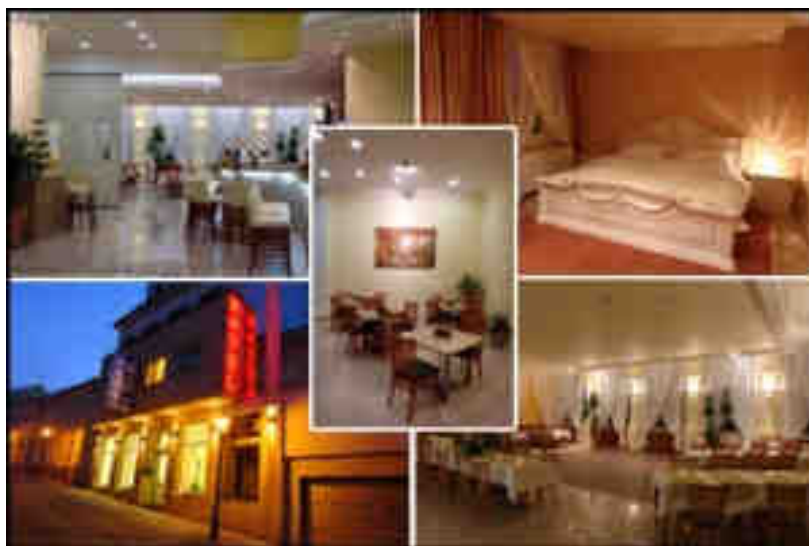
Obrázek č. 9: Hotel Bílá růže***