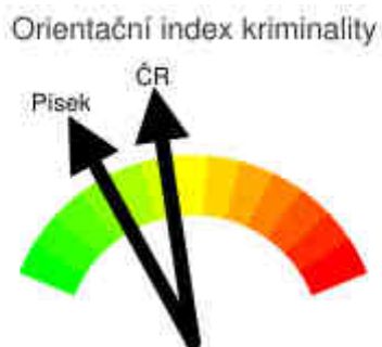
Graf č. 2: Orientační index kriminality