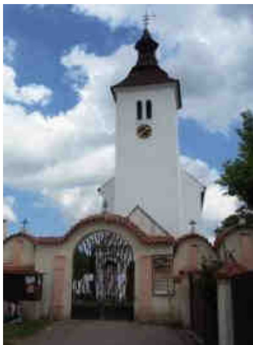
Obrázek č. 5: Kostel sv. Petra a Pavla – Albrechtice nad Vltavou