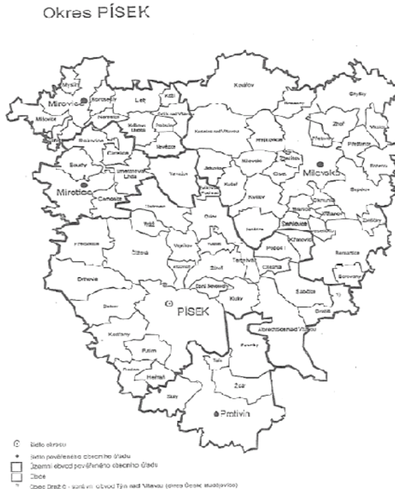
Mapa č. 1: Územní vymezení Písecka