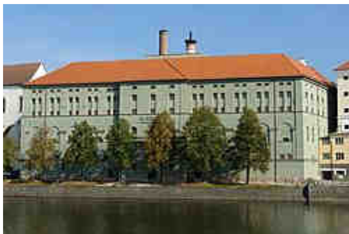
Obrázek č. 8: Sladovna Písek