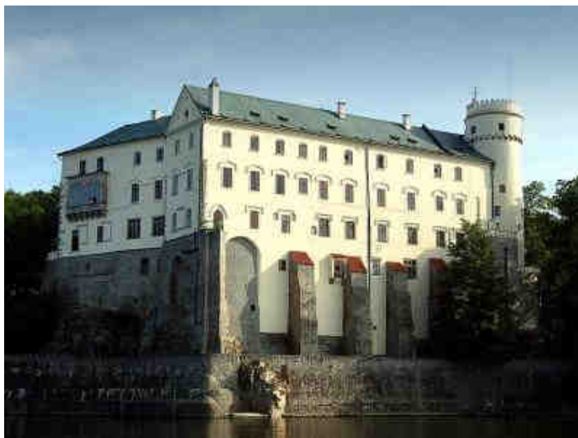
Obrázek č. 3: Zámek Orlík nad Vltavou