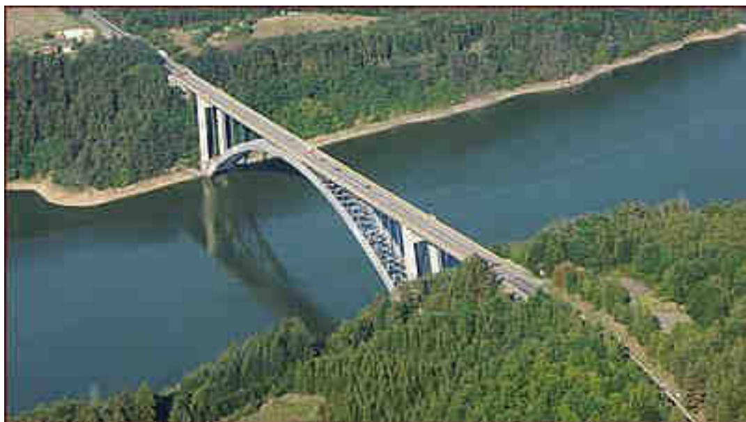
Obrázek č. 2: Žďákovský most