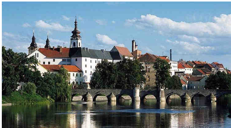
Obrázek č. 1: Město Písek