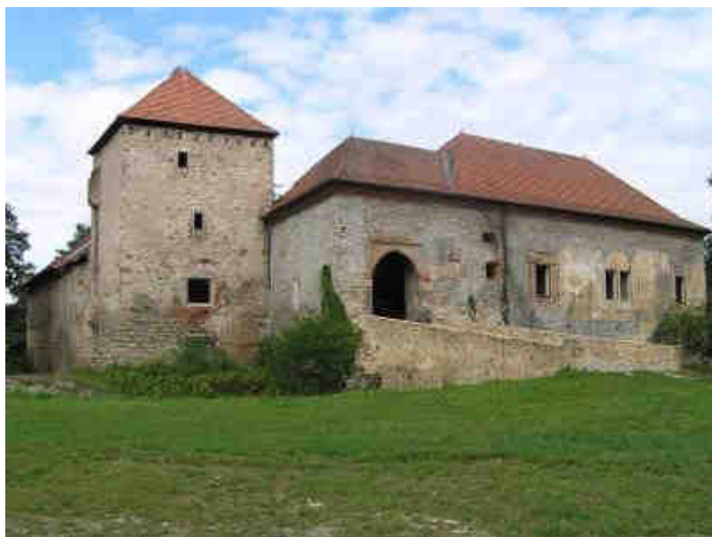
Obrázek č. 7: Tvrz v Kestřanech