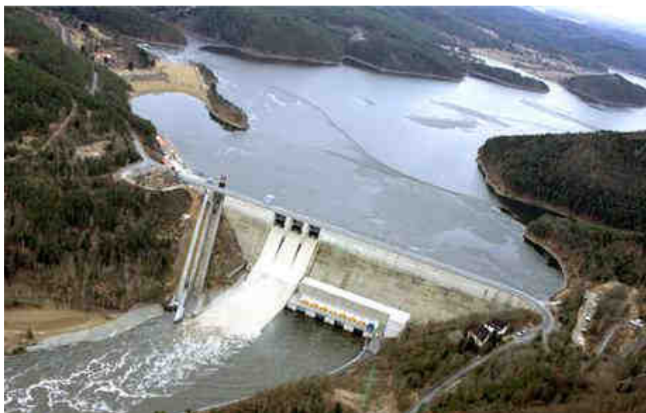
Obrázek č. 6: Orlická přehrada