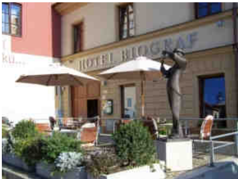
Obrázek č. 10: Hotel Biograf****