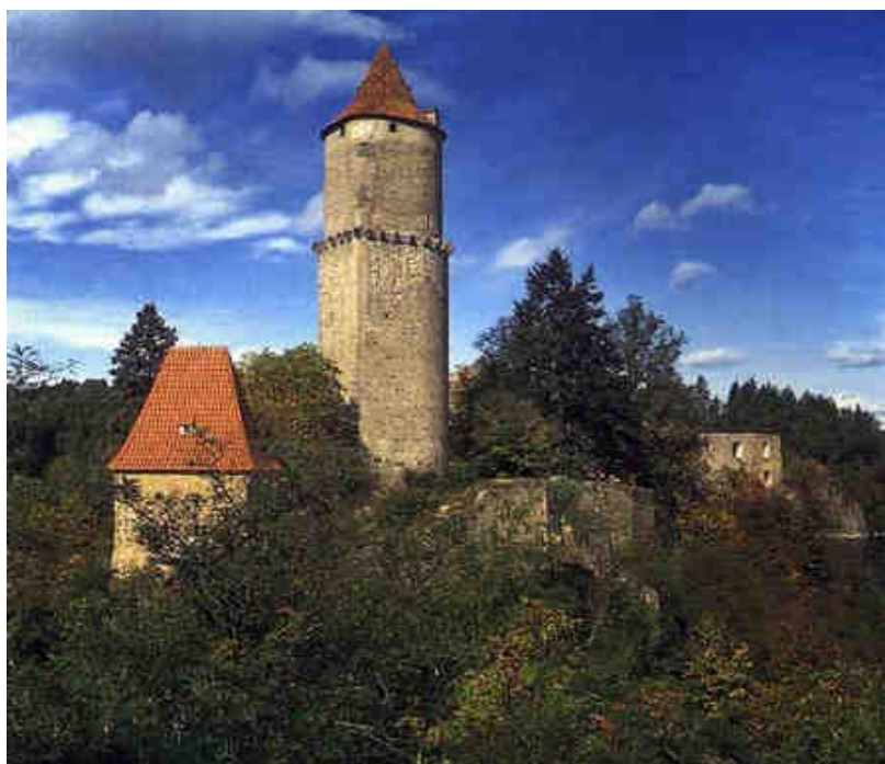
Obrázek č. 4: Hrad Zvíkov

Zdroj: http://www.zamky-hrady.eu/hrady-zvikov-detaily,69 , 2012-03-11