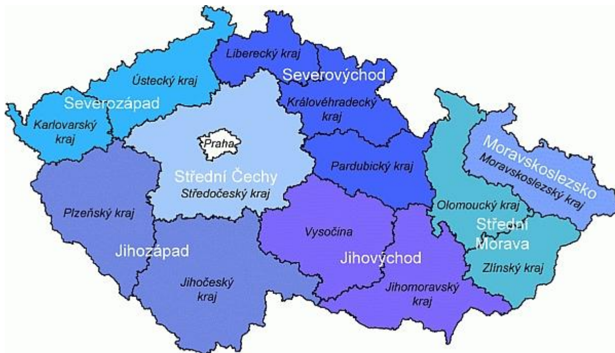
Obrázek č. 1: Mapa 14 krajů (NUTS III) a 8 regionů soudržnosti (NUTS II)

V rámci cíle Konvergence je pro období 2007-2013 připraveno 7 regionálních operačních programů s cílem zvýšení konkurenceschopnosti regionů, urychlení jejich rozvoje a zvýšení atraktivity pro investory. Tyto programy jsou určeny pro celé území České republiky s výjimkou Hlavního města Prahy. Z fondů EU je pro ně vyčleněno 4,6 mld. €.