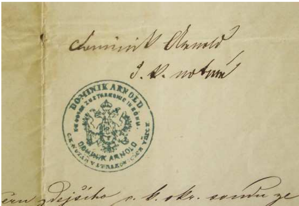
Obrázek č. 8 notářská razítka