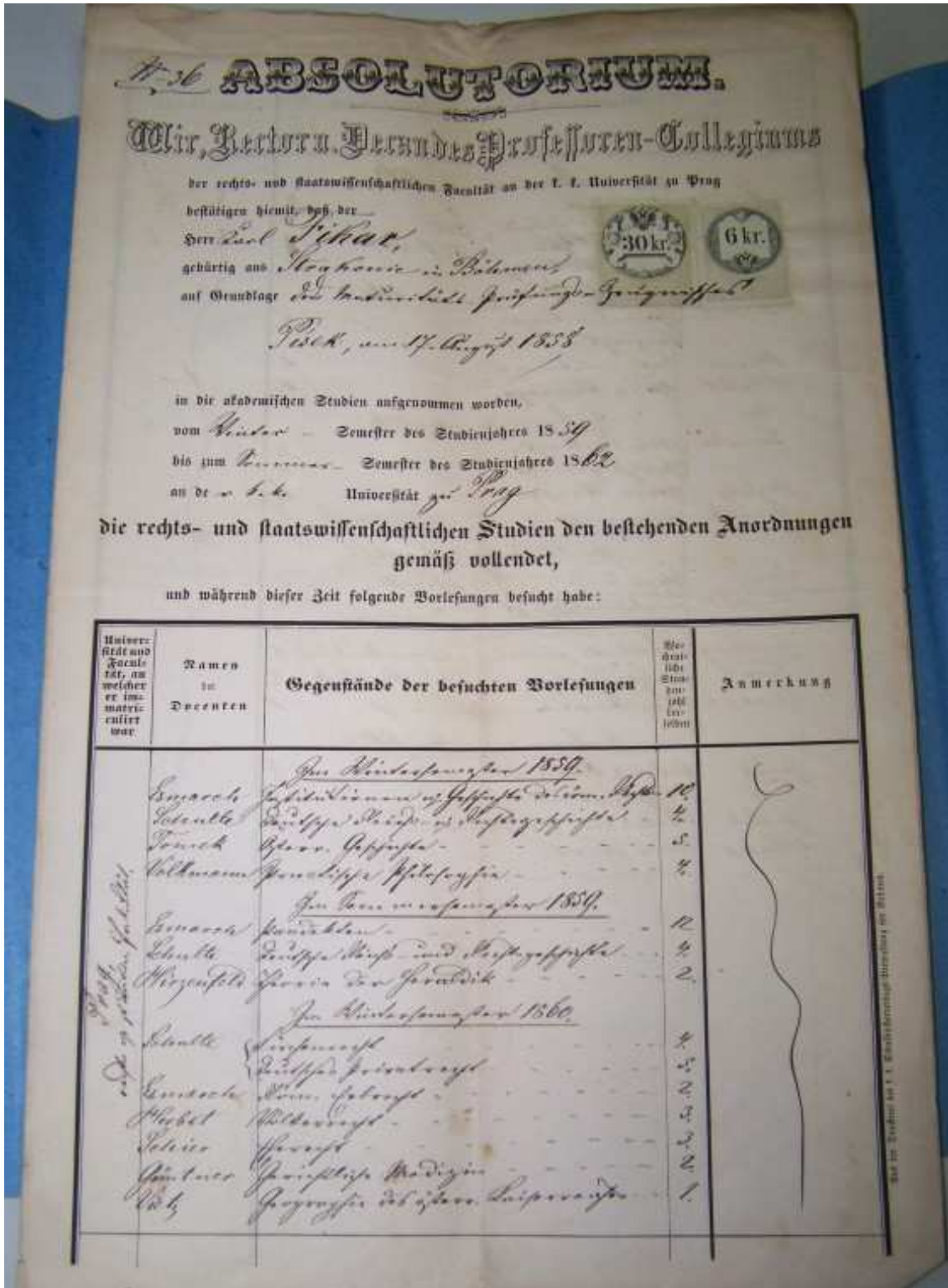
Obrázek č. 1 absolventský list Karla Fikara