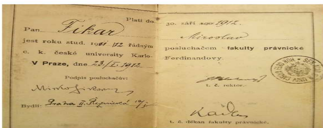
Obrázek č. 5 studentská legitimace Miroslava Fikara