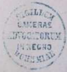
Obrázek č. 3 potvrzení o zápisu do seznamu advokátů