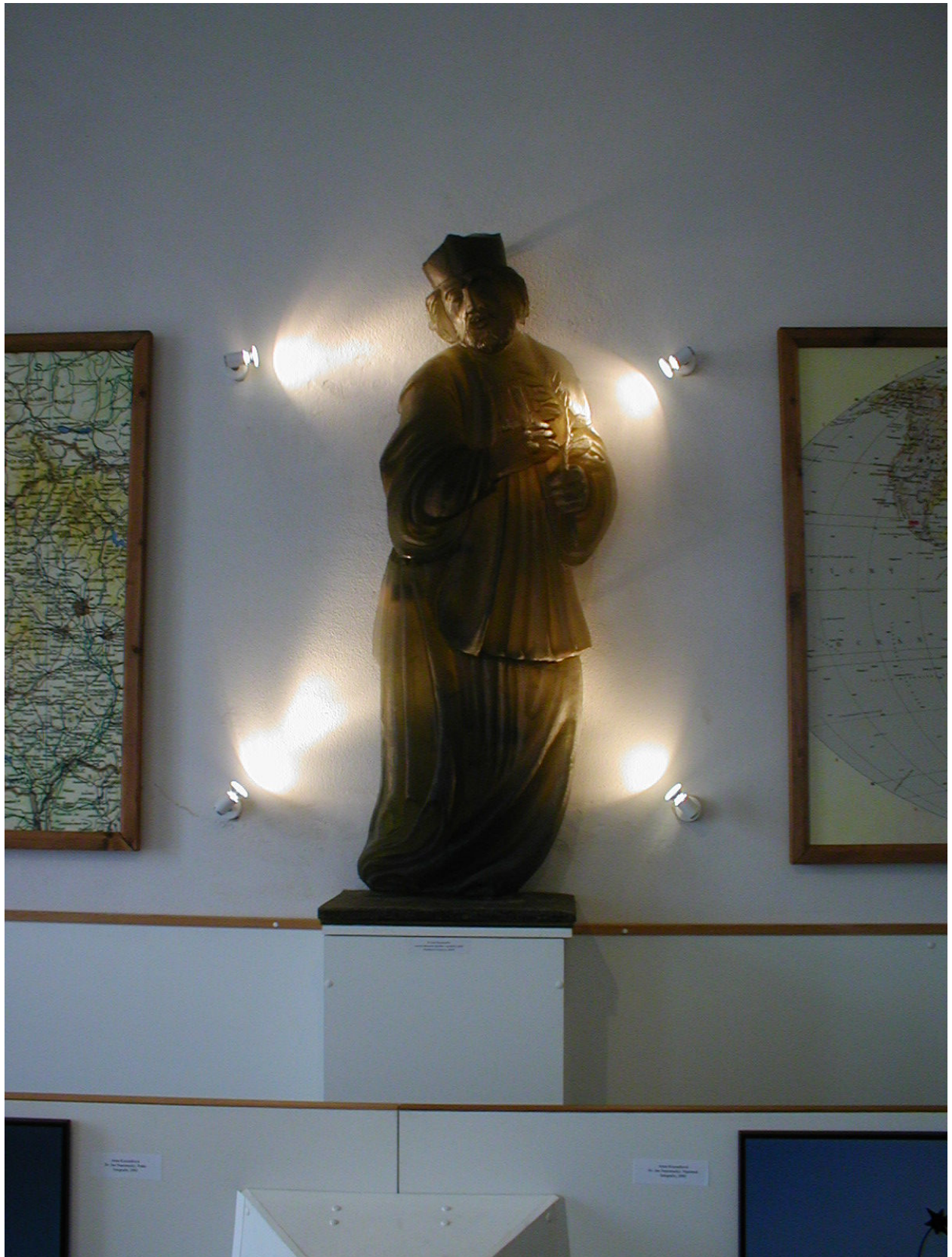
V. Příloha č. 5