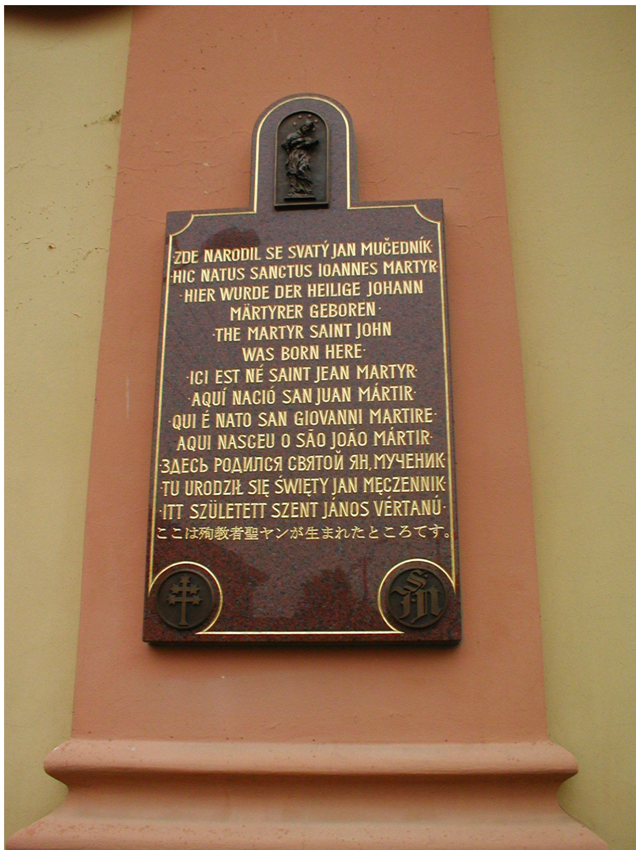
III. Příloha č. 3