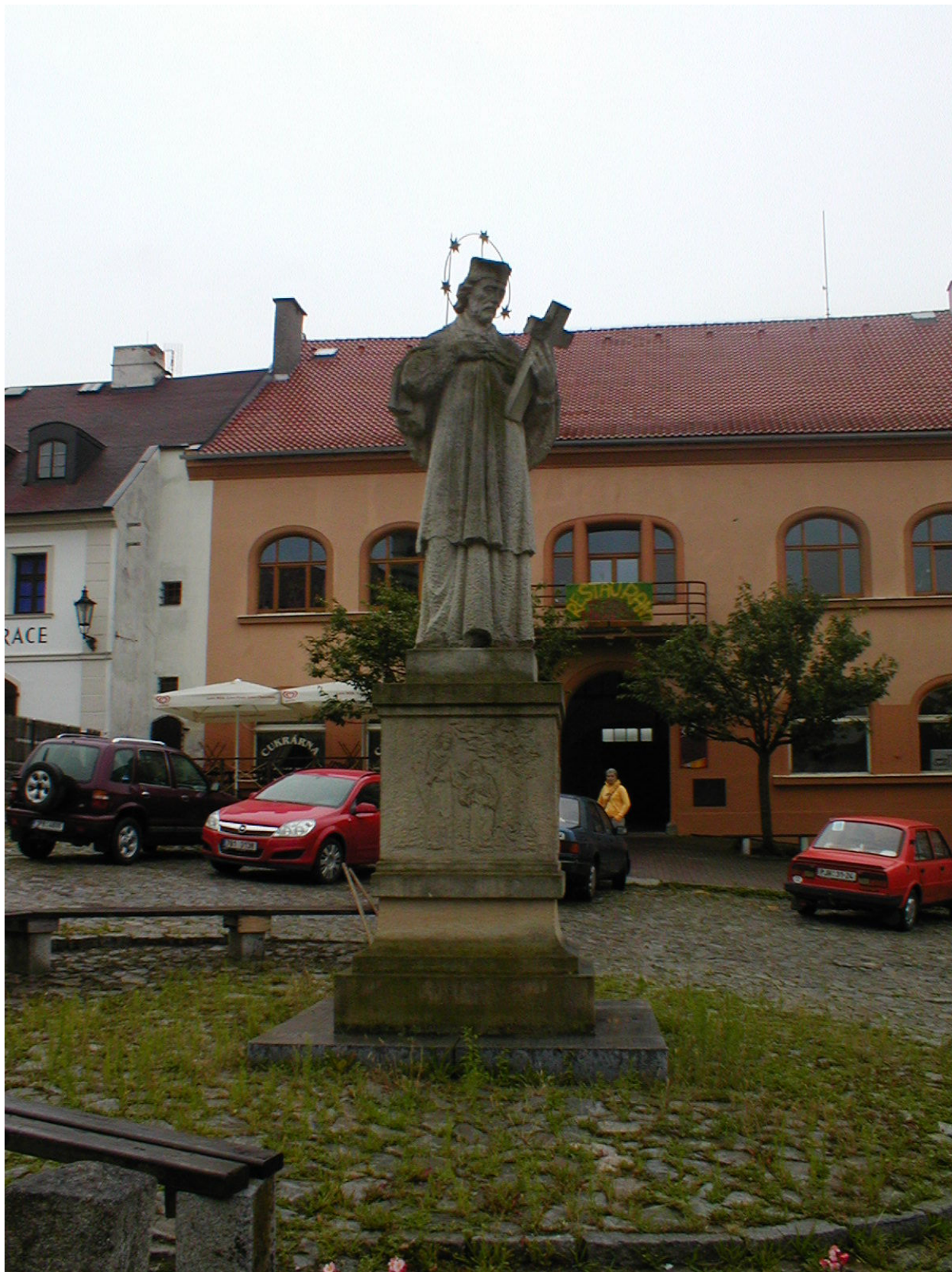
I. Příloha č. 1