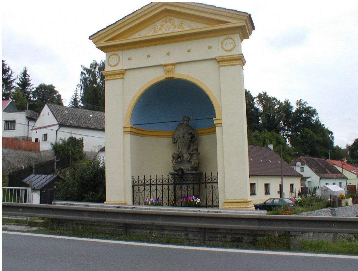
VI. Příloha č. 6