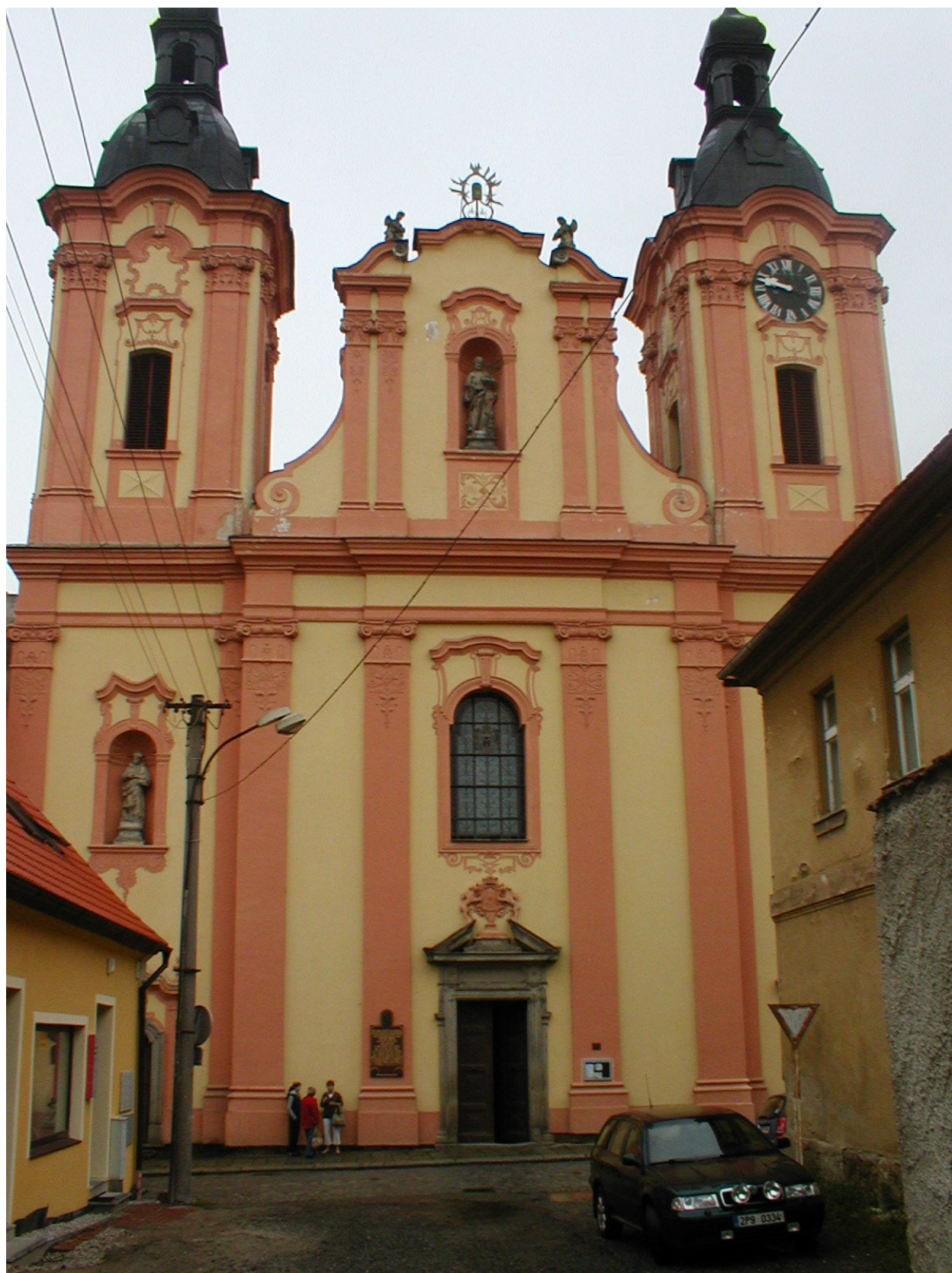
II. Příloha č. 2