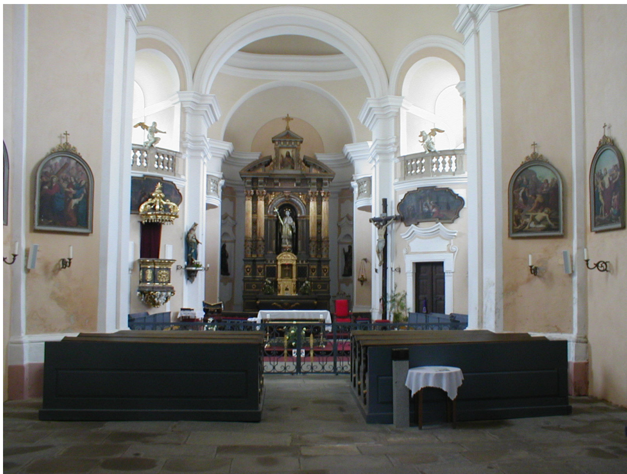
IV. Příloha č. 4