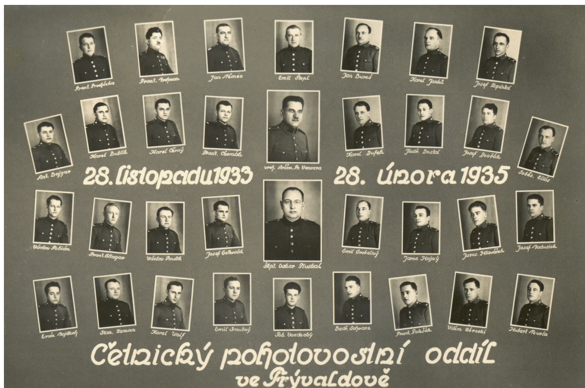
Obr. č. 7. Tablo ČPO