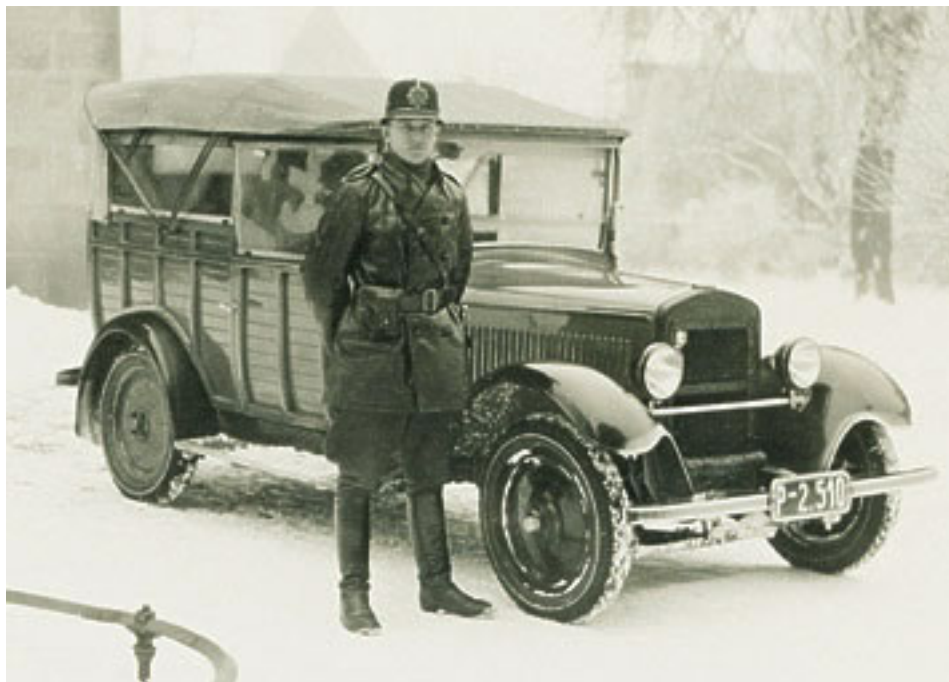
Obr. č. 5. Četník se služebním vozem ( www.codyprint.cz )