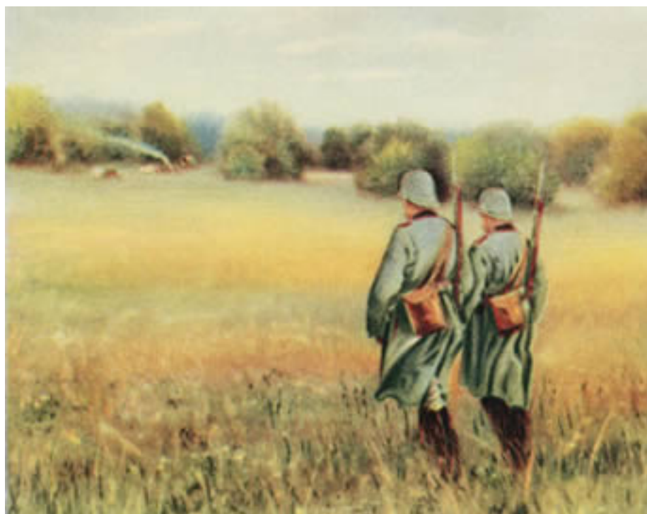
Obr. č. 2. Četníci na obchůzce (AA)