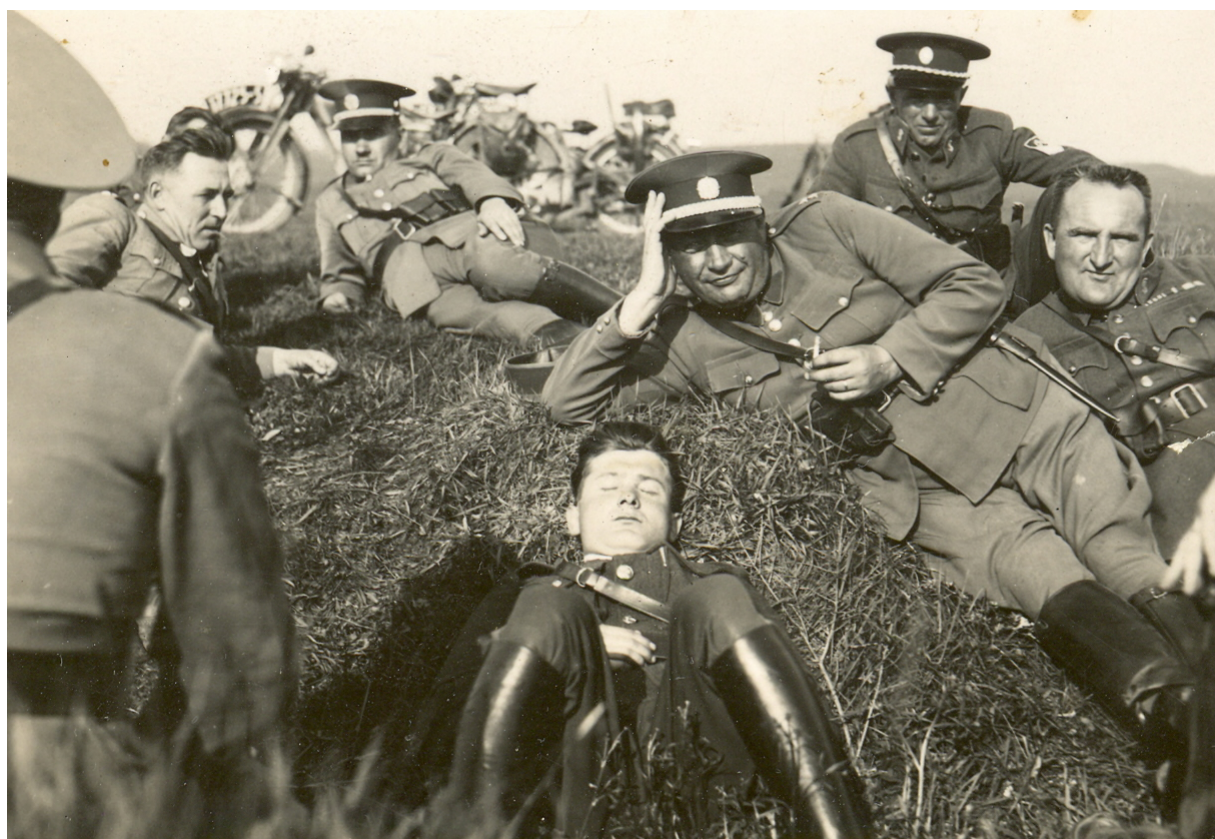
Obr. č. 8. Četníci při odpočinku