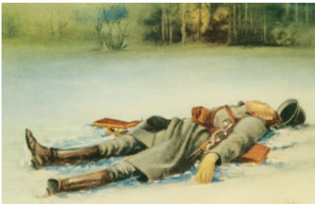
Obr. č. 1. Mrtvý četník