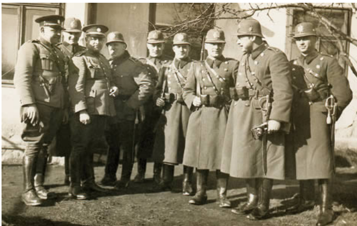
Obr. č. 3. Četníci před stanicí