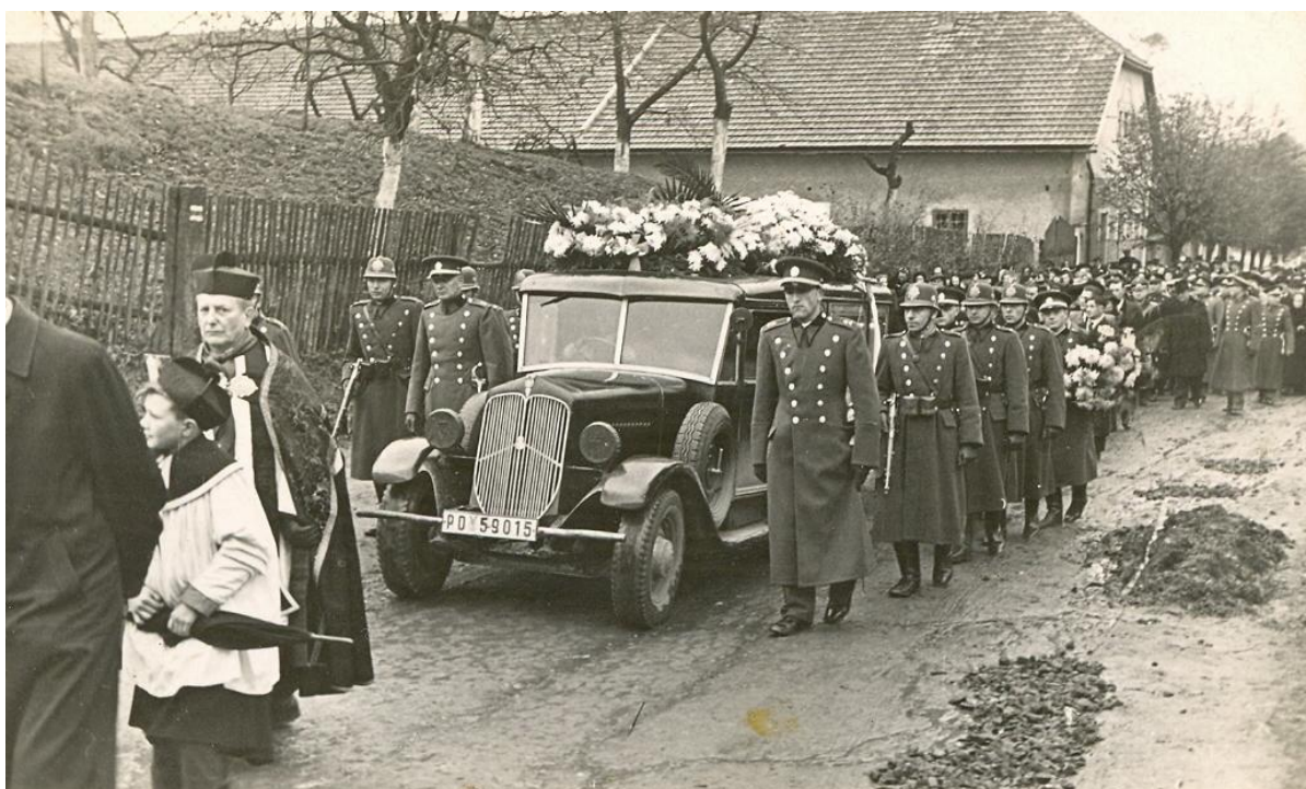
Obr. č. 6. Pohřeb četníka ( www.innoboediens.estranky.cz )