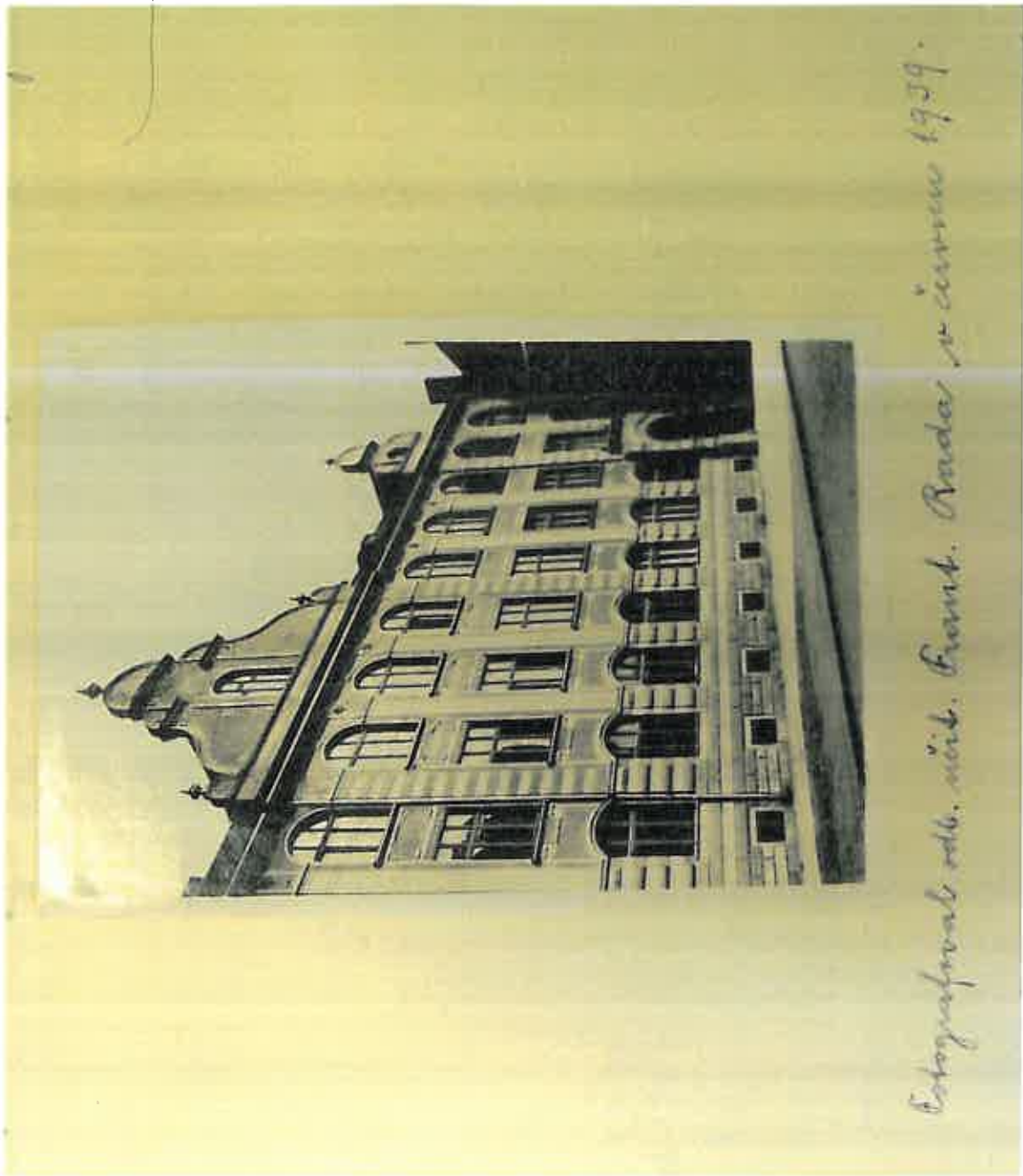
Estogofrontal edb. n. n. n. Front. Rada n. n. n. 1959.