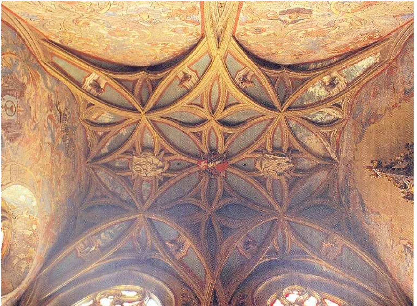
Obrázek 4 Pohled na zdobený strop Špulířské kaple.