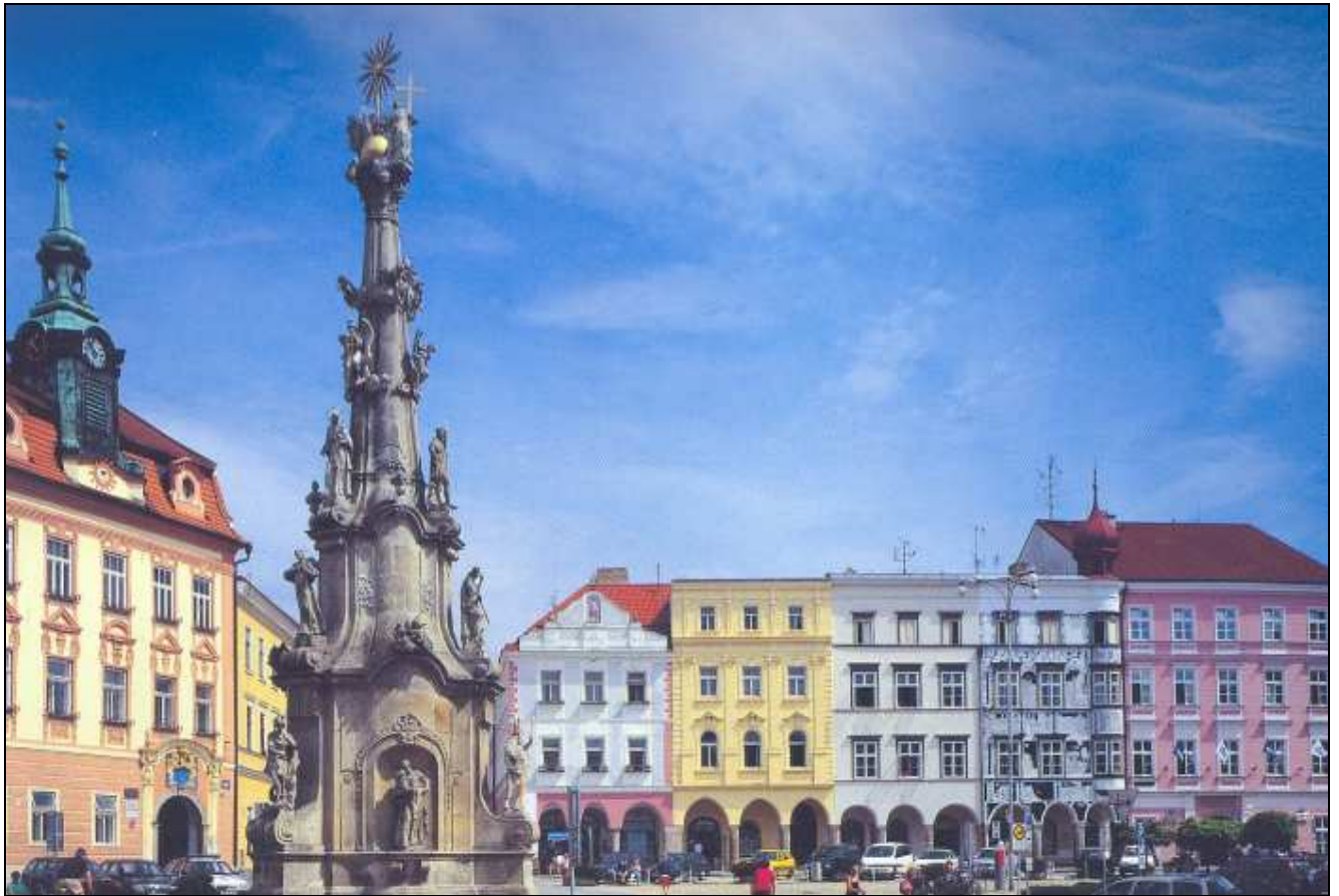
Obrázek 6 Z levé strany radnice čp. 88, v popředí socha Nejsvětější Trojice a dále následují domy s loubím na severovýchodní straně náměstí čp. 136, 137, 138/139 (Langrův dům) a 140.