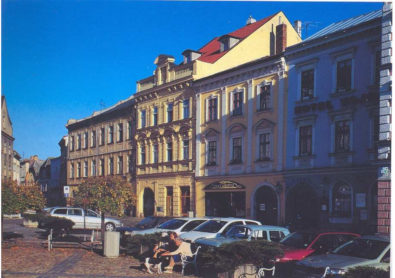
Obrázek 11 Pohled na jihozápadní část náměstí zleva s domy čp. 158, 159, 160, 161.