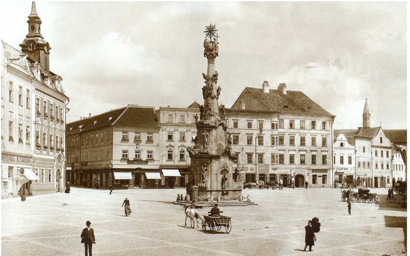
Obrázek 2 Náměstí na fotografii kolem roku 1900 (Muzeum Jindřichohradecka).