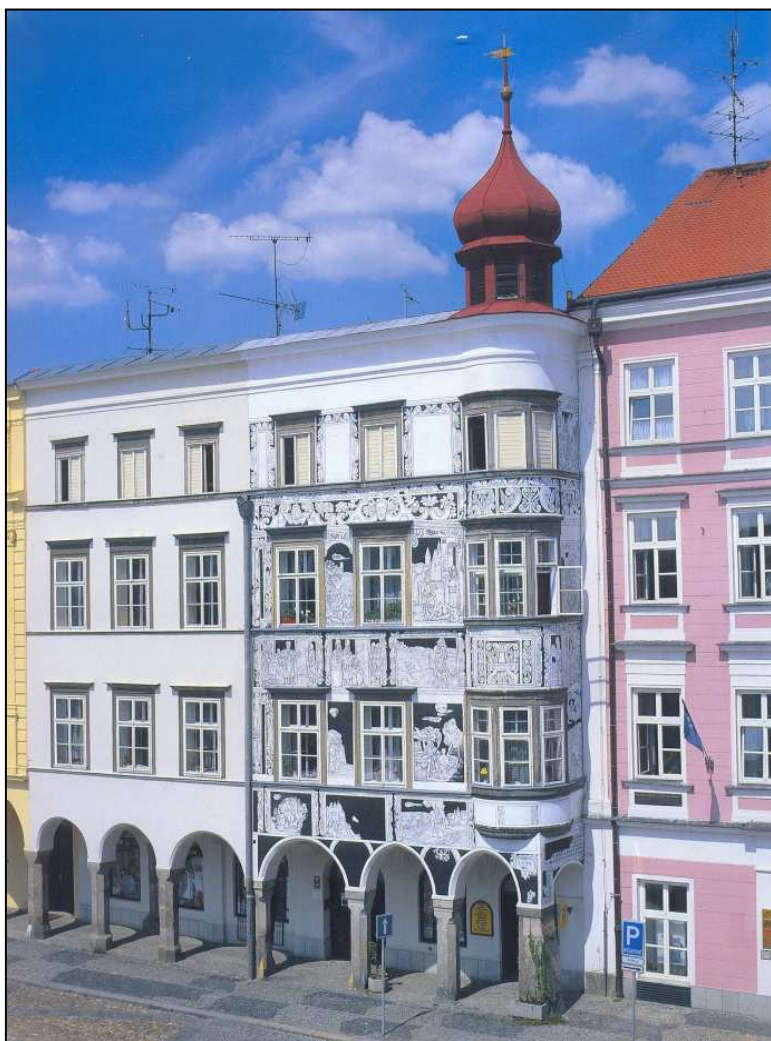
Obrázek 9 Langrův dům s biblickými.

V přízemí je loubí o šesti polokruhových arkádách. Pravá polovina průčelí je pokryta figurálním sgrafitem s biblickými výjevy, které jsou orámovány toskánskými ornamenty. Prostor v zadním traktu je považován v architektuře za ojedinělý, býval původně kaplí. Atika byla po spojení obou domů v 16. století rozšířena i na levý dům. 344 Dispozice domu čp. 139 je zhruba obdobná. Objekt si zachoval množství gotických a renesančních portálů, v druhém patře s kovanou renesanční mříží. V dvorním průčelí je fragment sgrafita s letopočtem roku 1627. Sgrafita domu pocházejí z roku 1579, rozšíření sgrafit na druhou stranu domu došlo roku 1586, kdy oba domy dostaly společného majitele. Loubí bylo zrušeno v 17. století a obnoveno v letech 1956-1963. 345