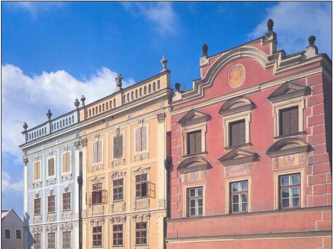
Obrázek 3 Pohled na západní stranu náměstí s třemi domy zleva čp. 6, 7, 8.

Dům čp. 6/9 - dům Šaurovský (druhé popisné číslo domu je uváděno ve starší literatuře)