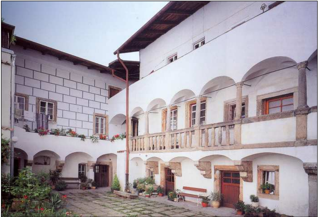
Obrázek 10 Atrium Langrova domu.