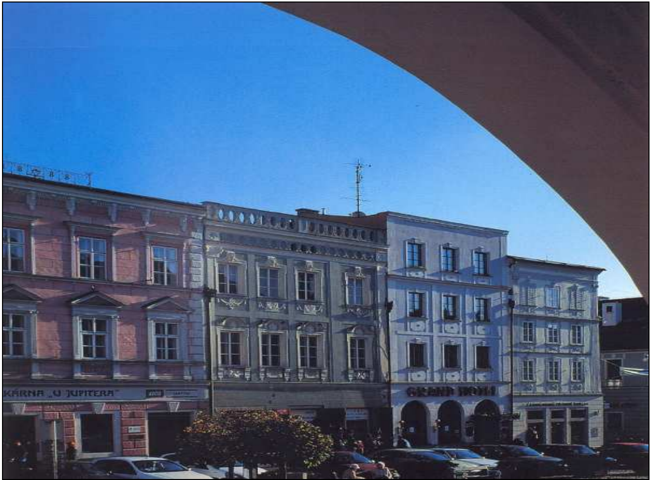
Obrázek 12 Pohled na jižní stranu náměstí zleva s domy čp. 166, 165, 164, 163.