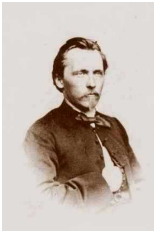
Příloha 5 Julius Grégr