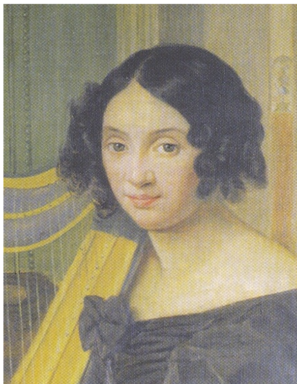
Příloha 10 Terezie Palacká