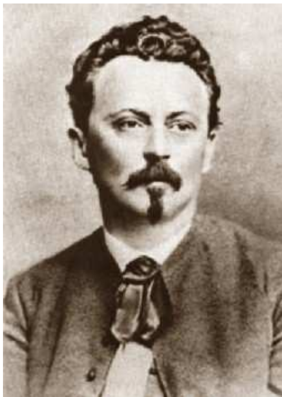
Příloha 13 Miroslav Tyrš