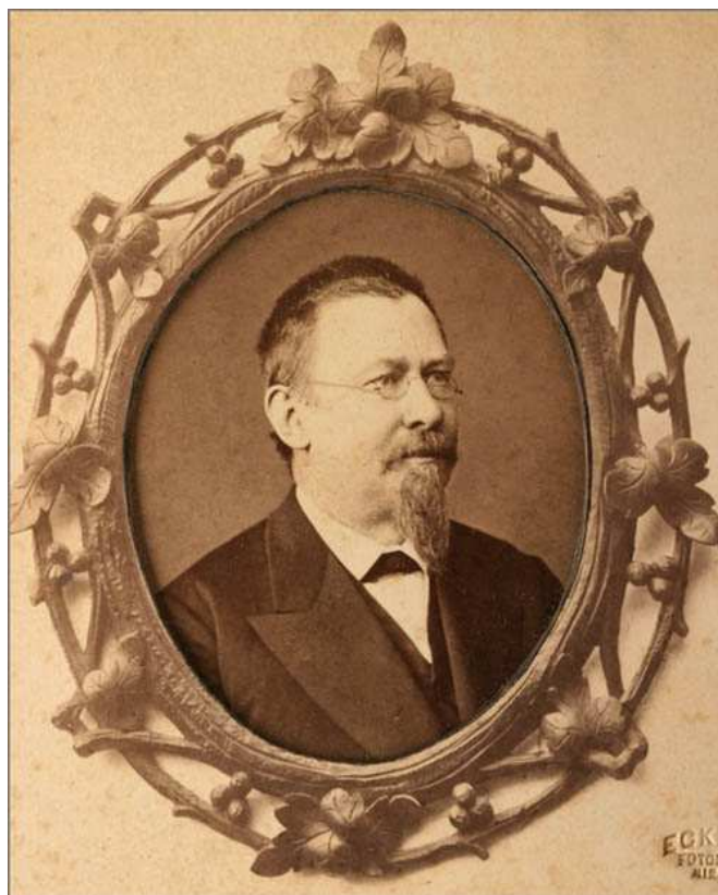
Příloha 7 Vojtěch Náprstek