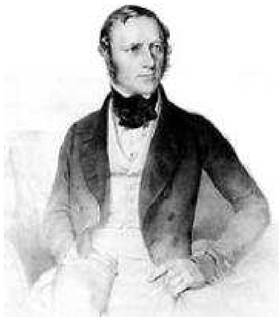
Příloha 9 František Palacký