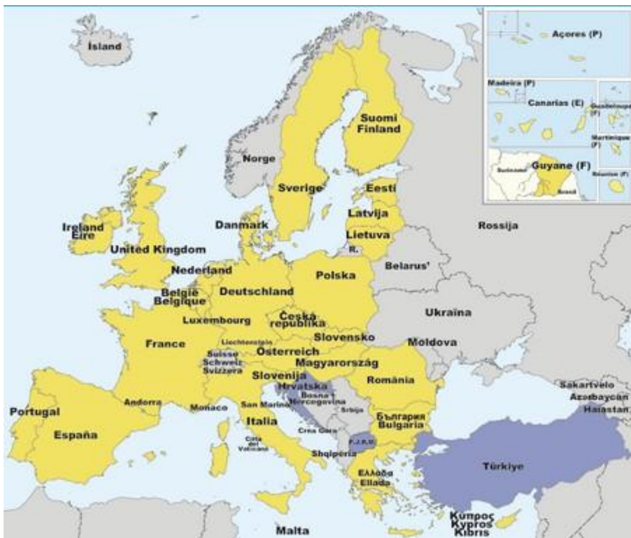
Mapa území patřících do EU 92