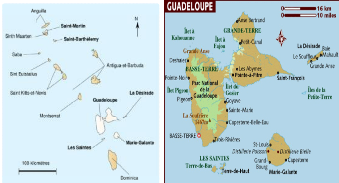
Mapa Guadeloupe 88