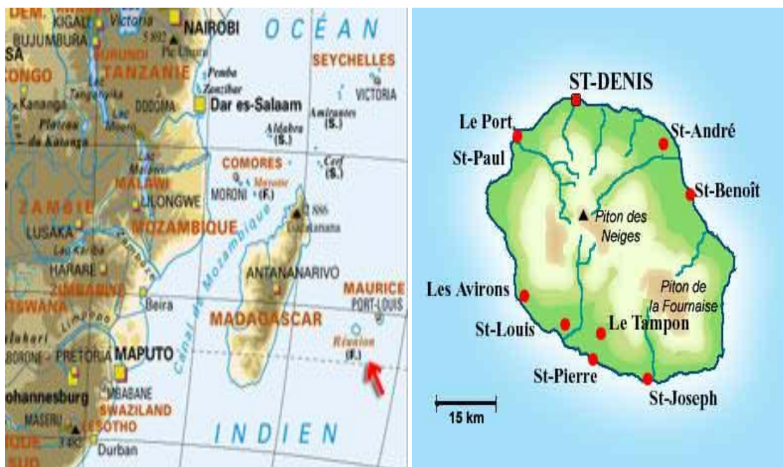
Mapa Réunionu 90