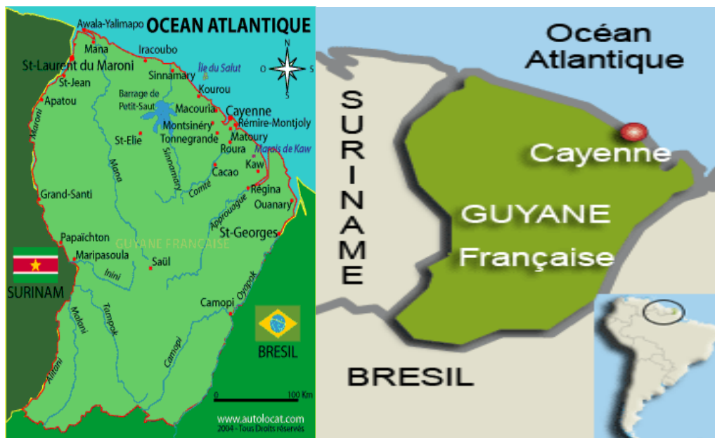
Mapa Francouzské Guyany 89