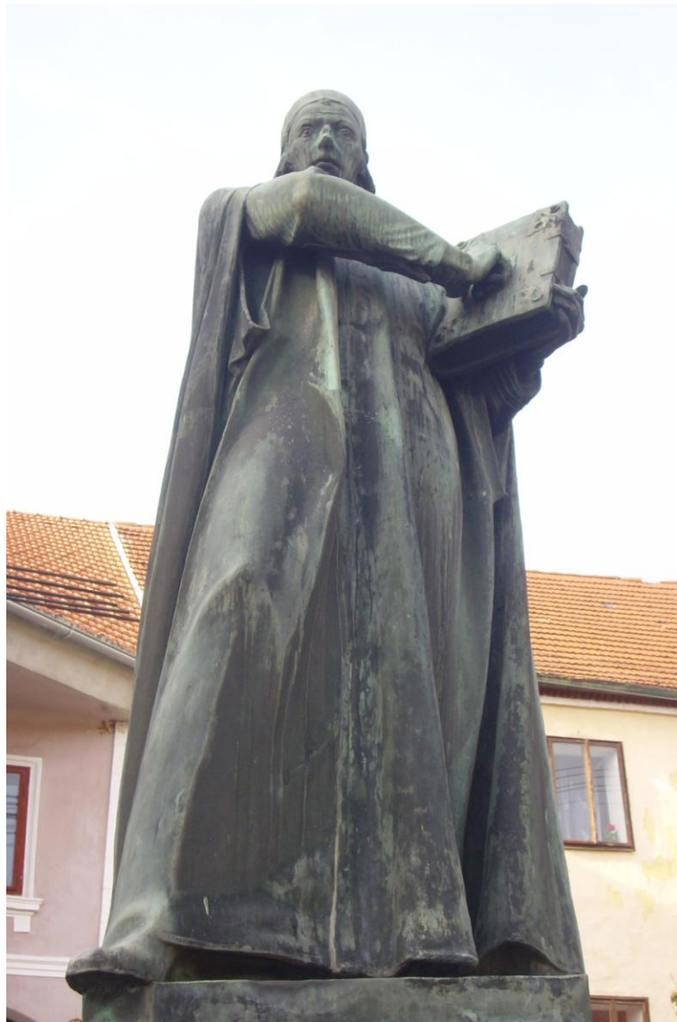
Socha Mistra Jana Husa (Husinec [22. 4. 2009])