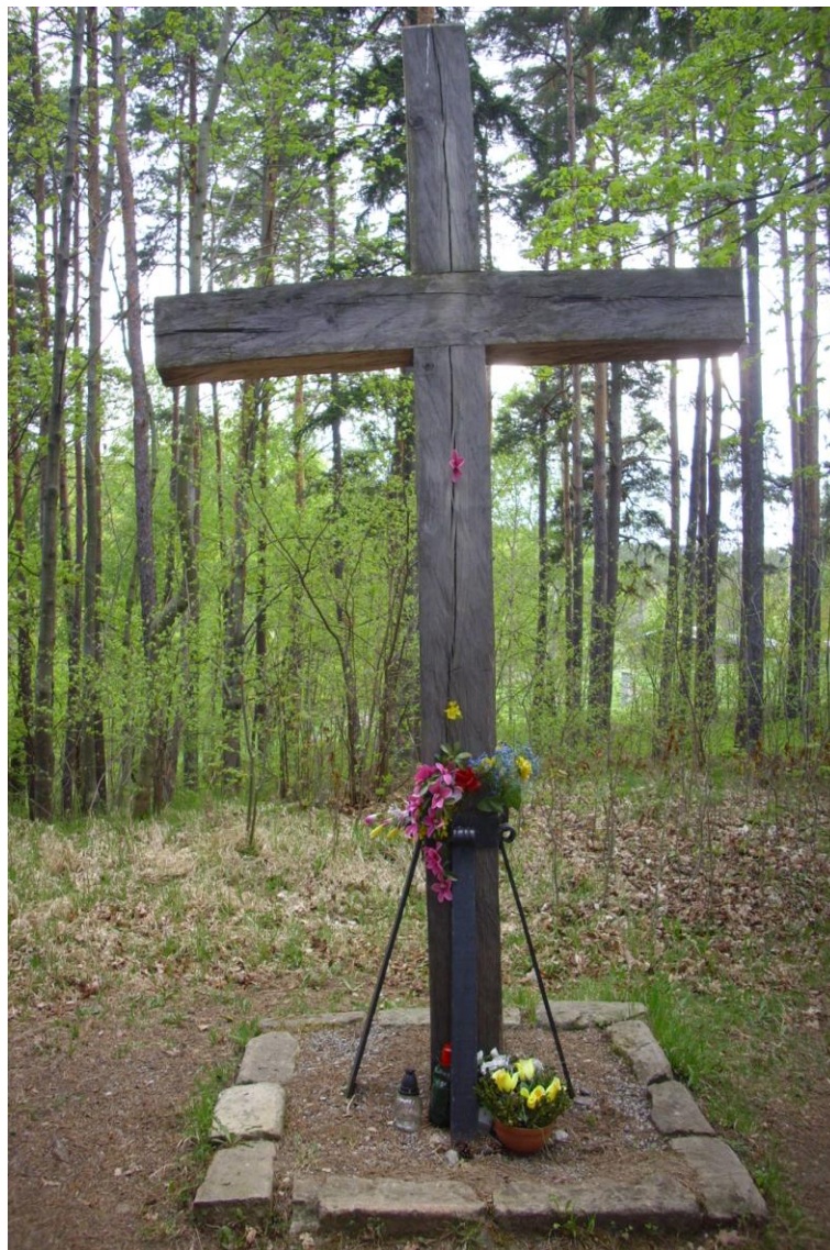
Kříž jako symbol křesťanství, utrpení i naděje. (Křížová cesta, Vimperk [24. 4. 2009])