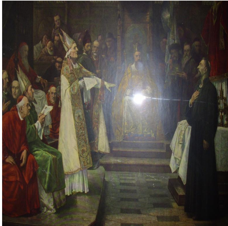
Vyobrazení církevního koncilu v Kostnici roku 1415.