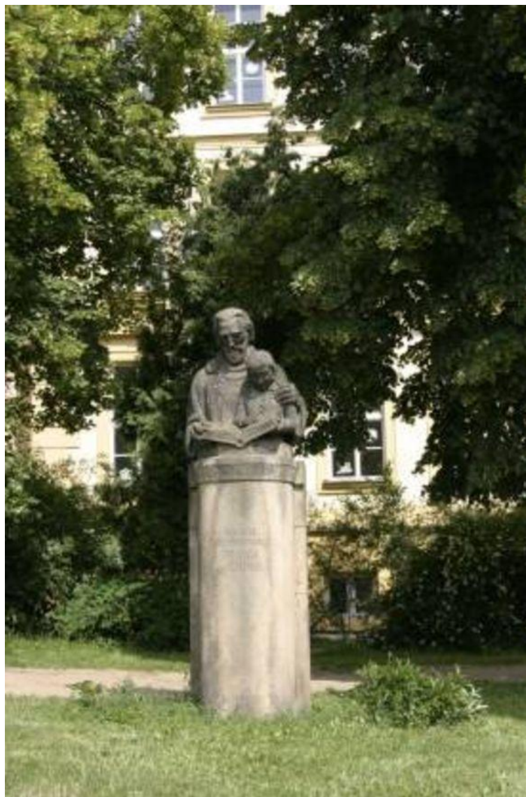
Památník Tomáše Štítneého v Olomouci ( http://www.olomouc-travel.cz/fotografie.php?lang=1&id=876&kategorie=220 , [22. 4. 2009])