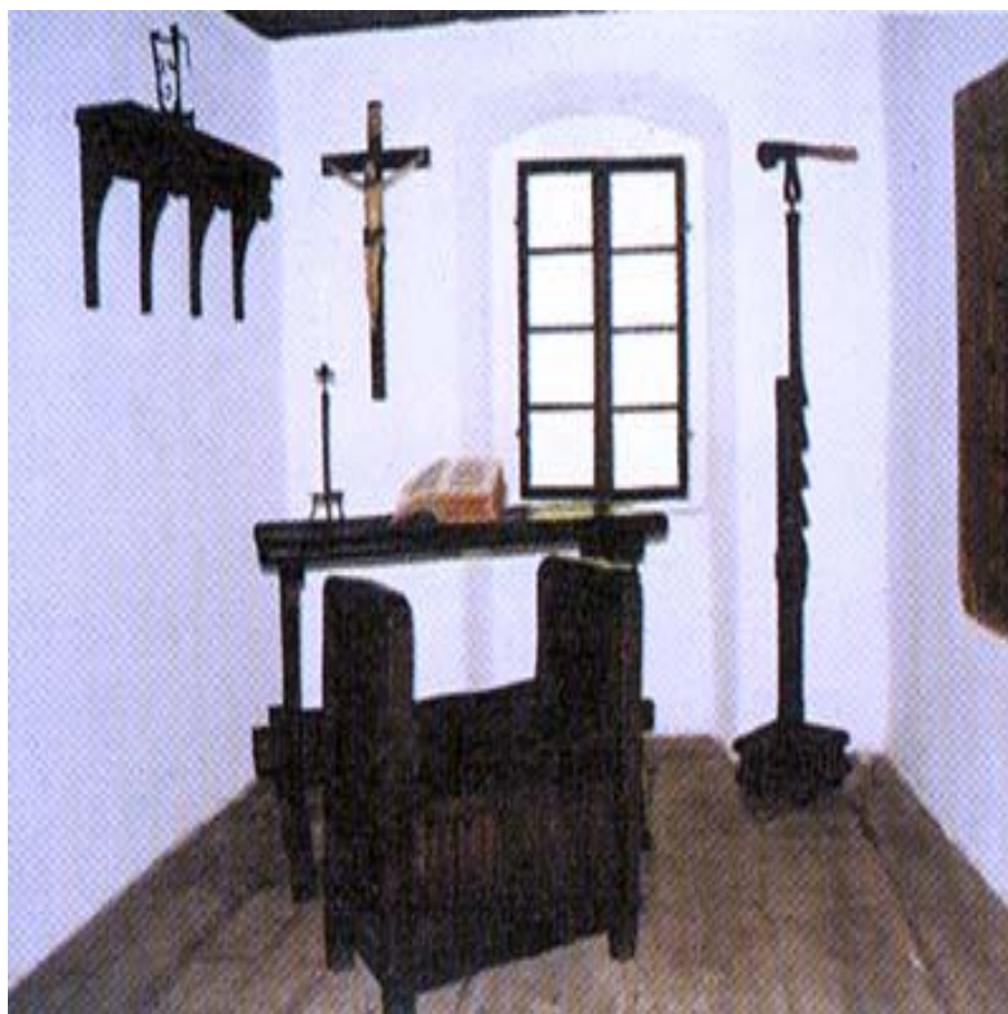
Husův skromný příbytek v rodném domě v Husinci.