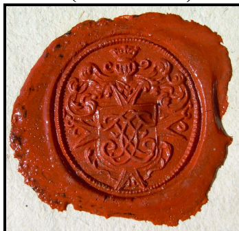
15. Pečet' faráře Chmelíčka (1773 – 1785).