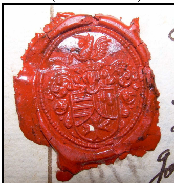
14. Pečet' faráře Spinky (1733 – 1745).