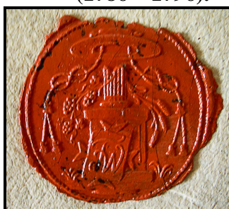
16. Pečet' děkana Wilhelma (1786 – 1796).