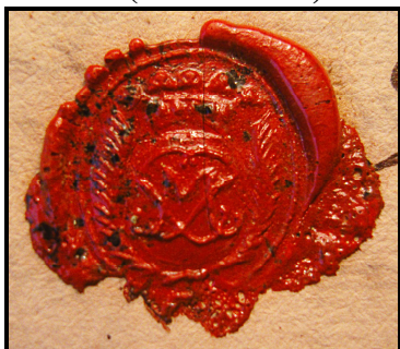
13. Pečet' faráře Matznera (1716 – 1732).