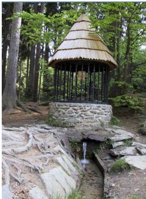
č. 5 Kaplička se studánkou