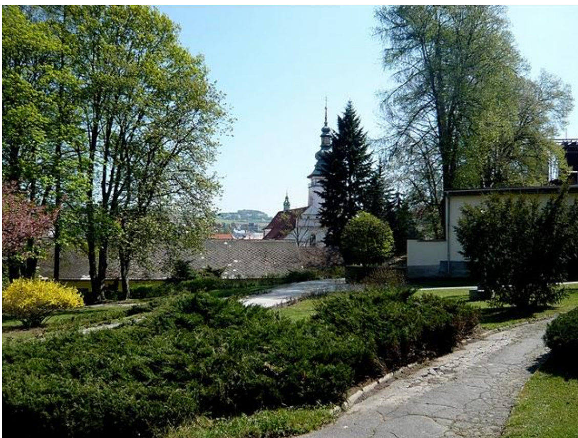
č. 10 Děkanská zahrada v současnosti