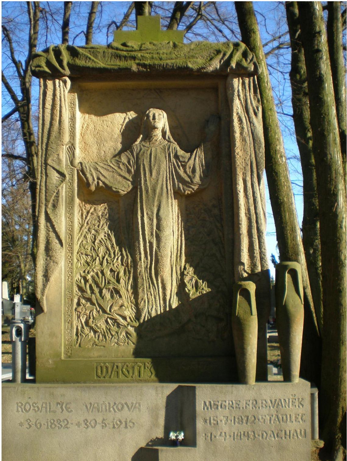
č. 3 Magnificat