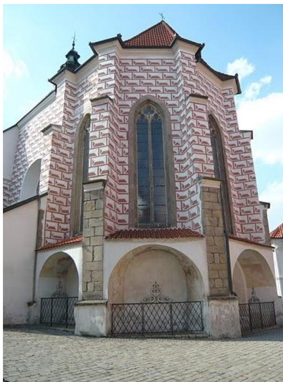
č. 12 Kostel sv. Bartoloměje v Pelhřimově