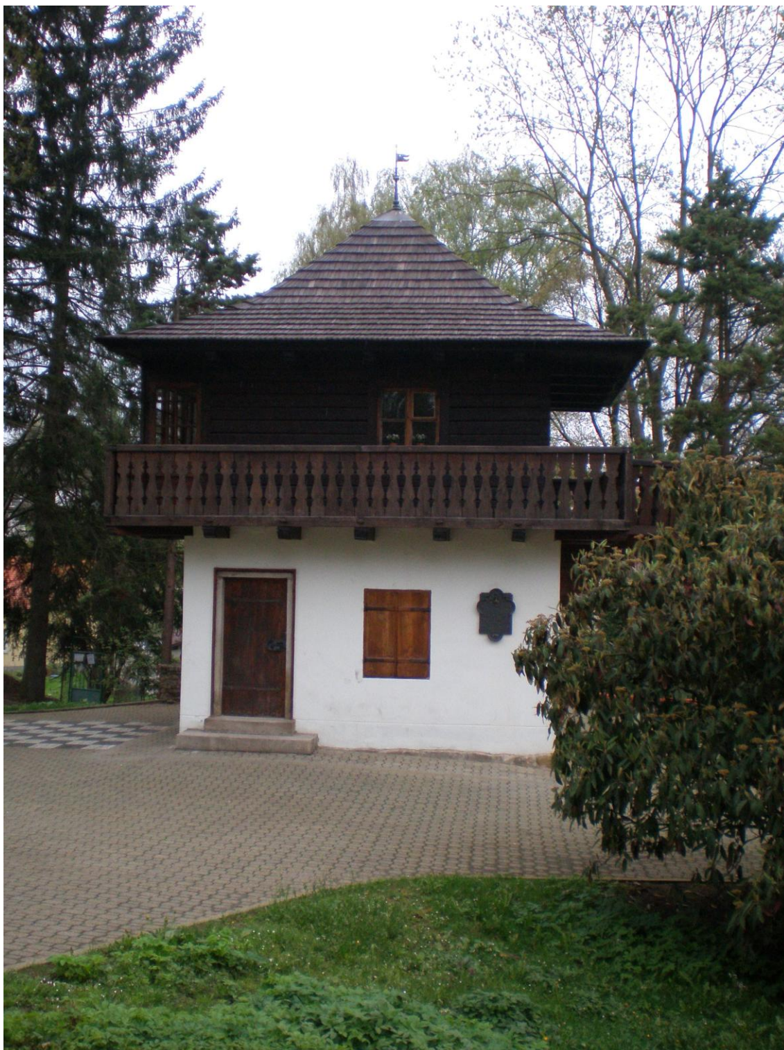
č. 9 Vaňkova „perníková chaloupka“