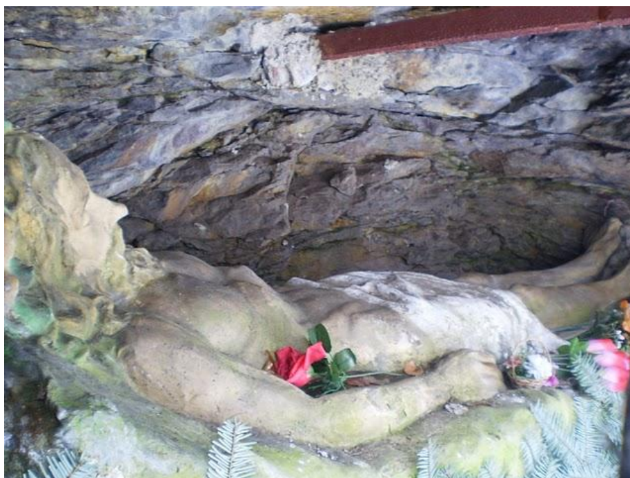
č. 13 Boží hrob – 14. zastavení křížové cesty