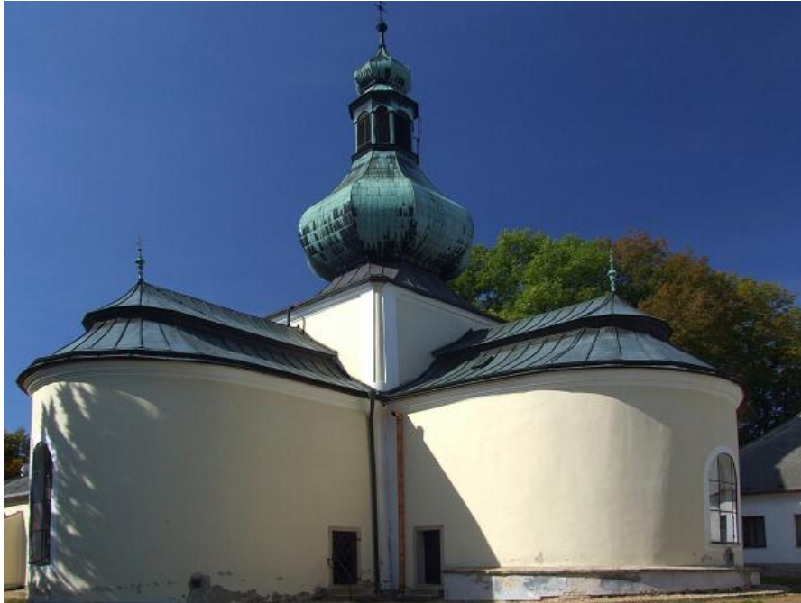
č. 4 Kostel Nejsvětější trojice na Křemešníku