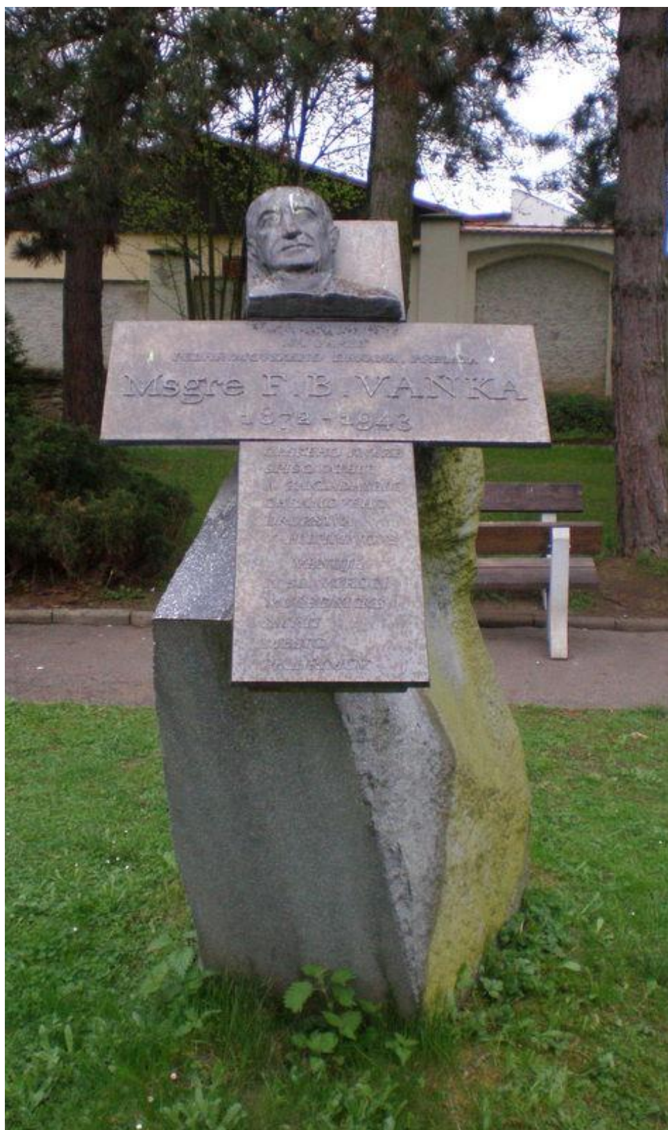
č. 11 Památník F. B. Vaňka v děkanské zahradě