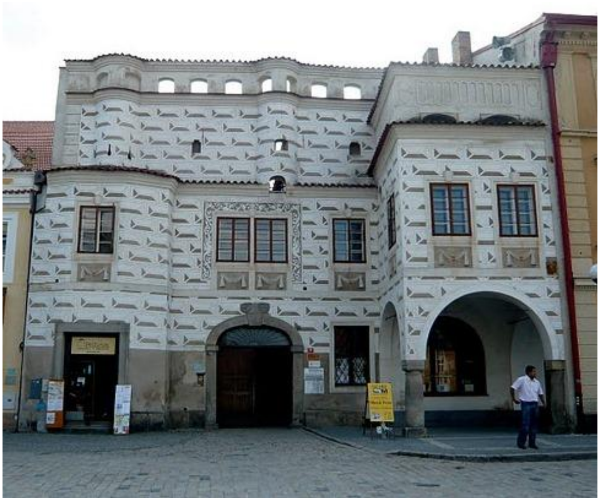
č. 7 Purkrabský dům č. 17 na pelhřimovském náměstí