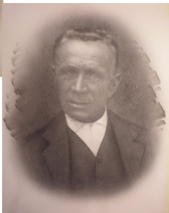
č. 2 Portréty Vaňkových rodičů