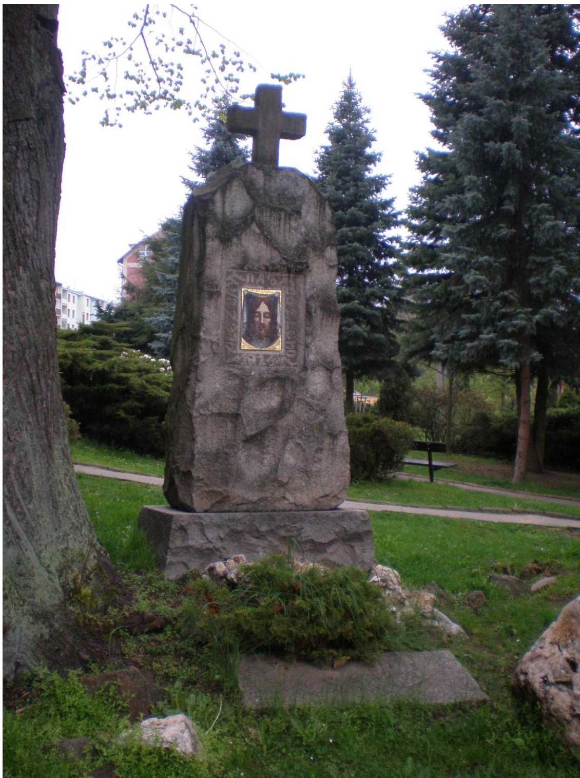
č. 8 Přírodní kaple v děkanské zahradě