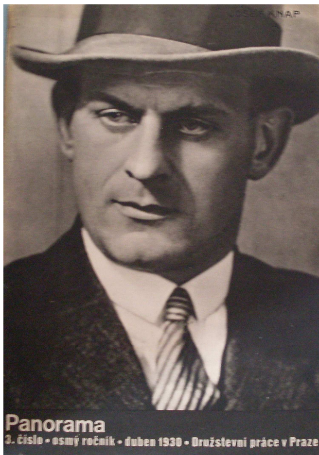
Knapův portrét na titulní stránce časopisu Panorama z roku 1930