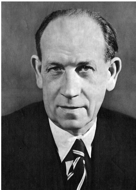
Příloha č. 2.