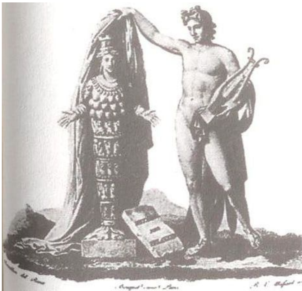
Příloha č. 4. Apollón snímá závoj ze sochy Isidy-Artemidy. Rytina Bertela Thorwaldsena z frontispisu knihy Alexandra von Humboldta Ideen zu einer Geographie der Pflanzen , Tübingen 1807.