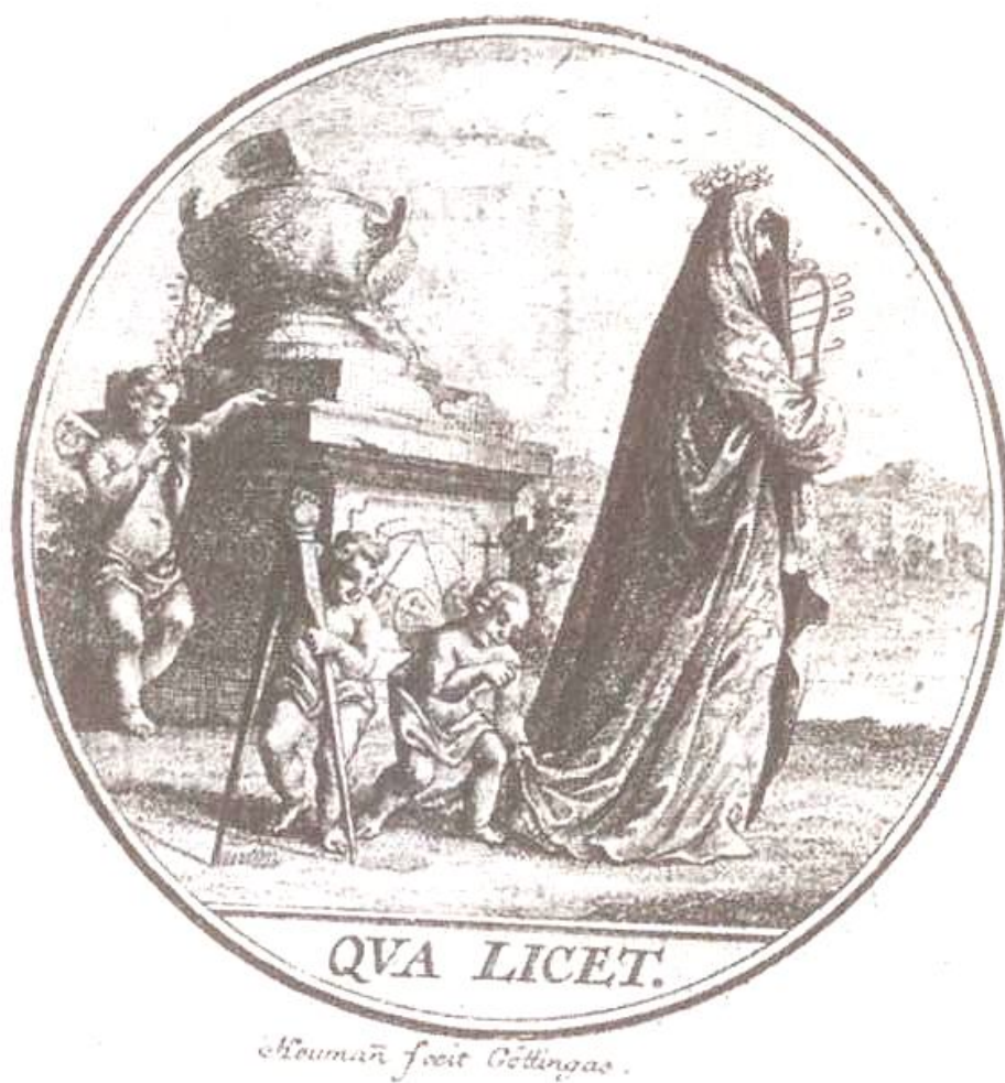
Příloha č. 5. Vědy zkoumají šlépěje Isidy-Přírody. Vyobrazení z knihy Andream von Segnera, Einleitung in die Natur-Lehre , Göttingen 1754.