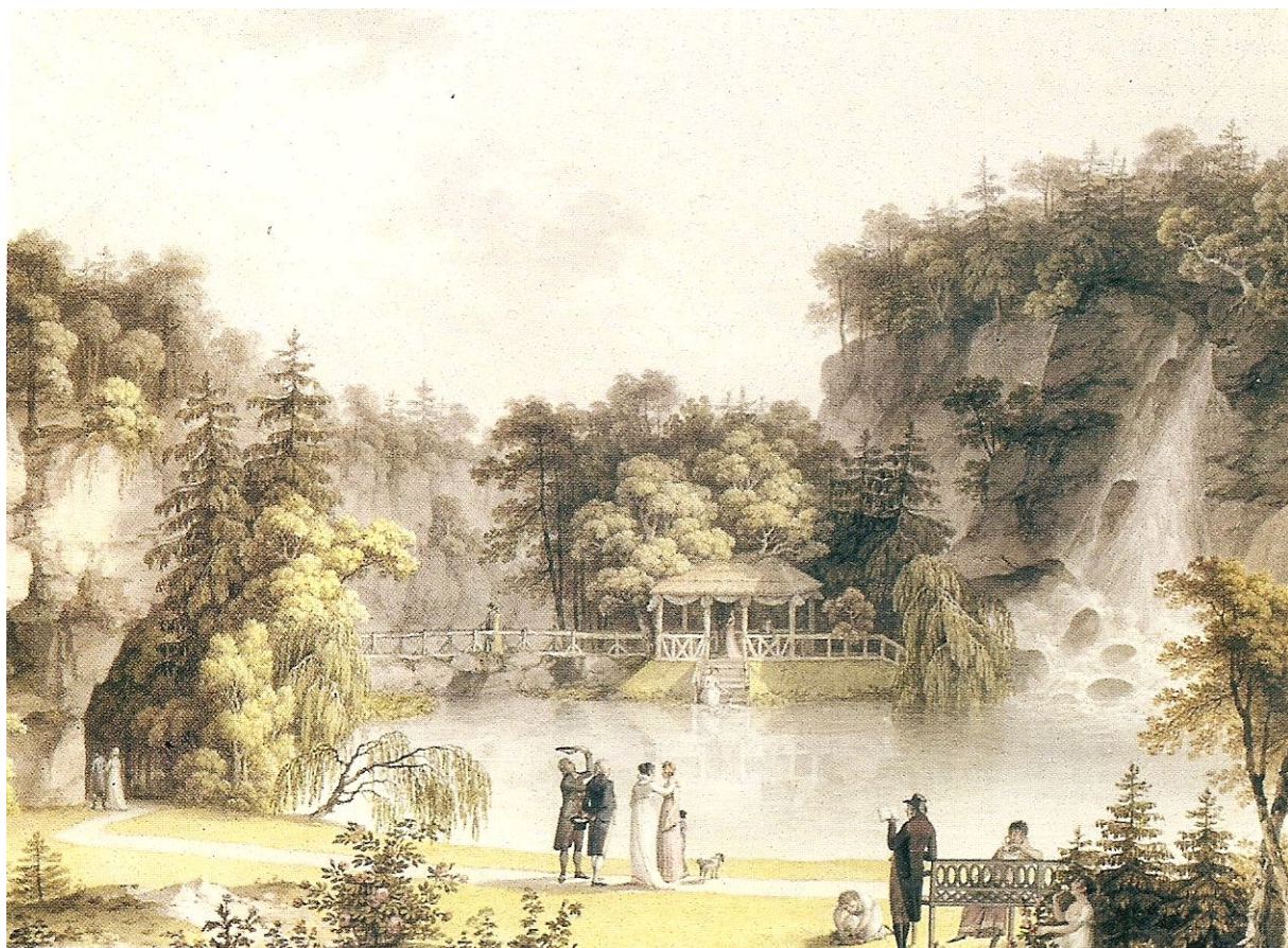
Příloha č. 3. Umělý vodopád v Terčíně údolí u Nových Hradů jako příklad romanticky upravené krajiny. Autorem akvarelu pravděpodobně L. Janscha, polovina 19. století.