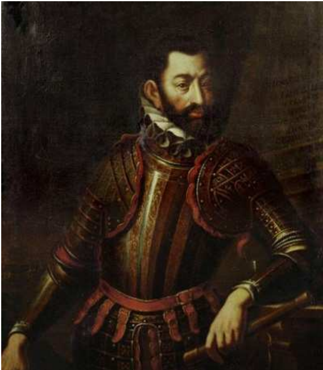
Obr. 2 Adolf ze Schwarzenberku