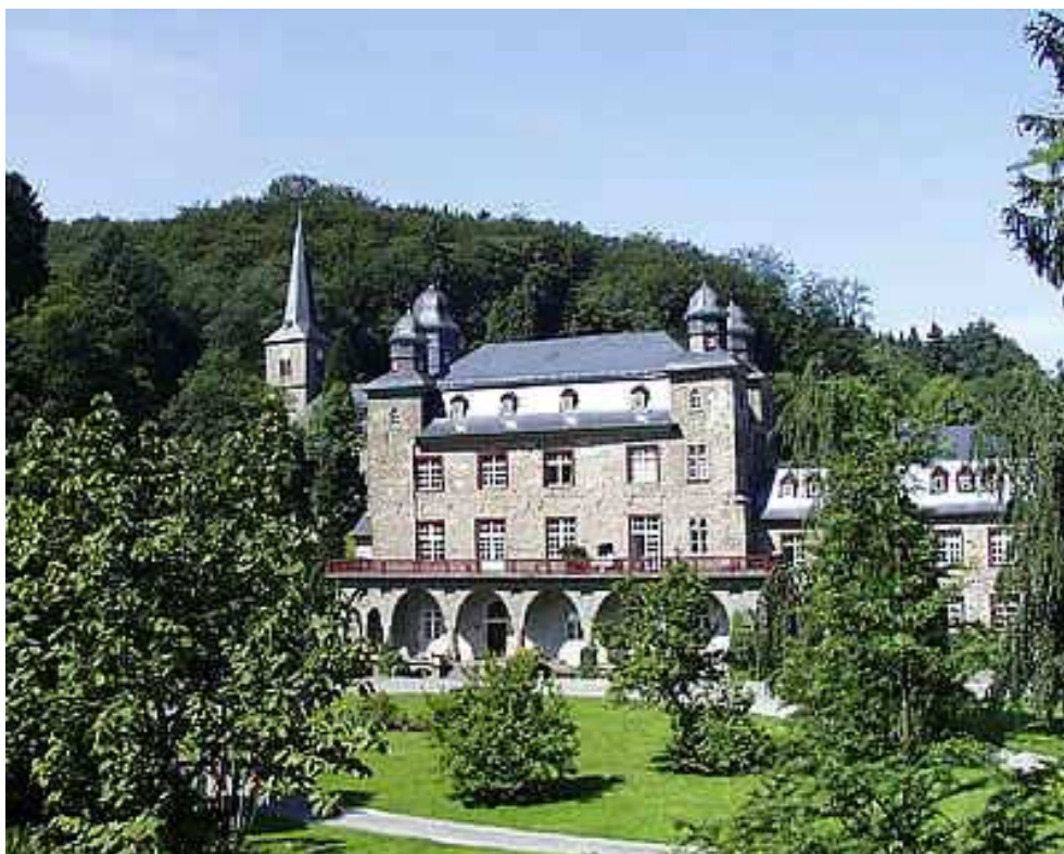
Obr. 7 Rodný zámek Adama ze Schwarzenberku, Gimborn - dnešní stav