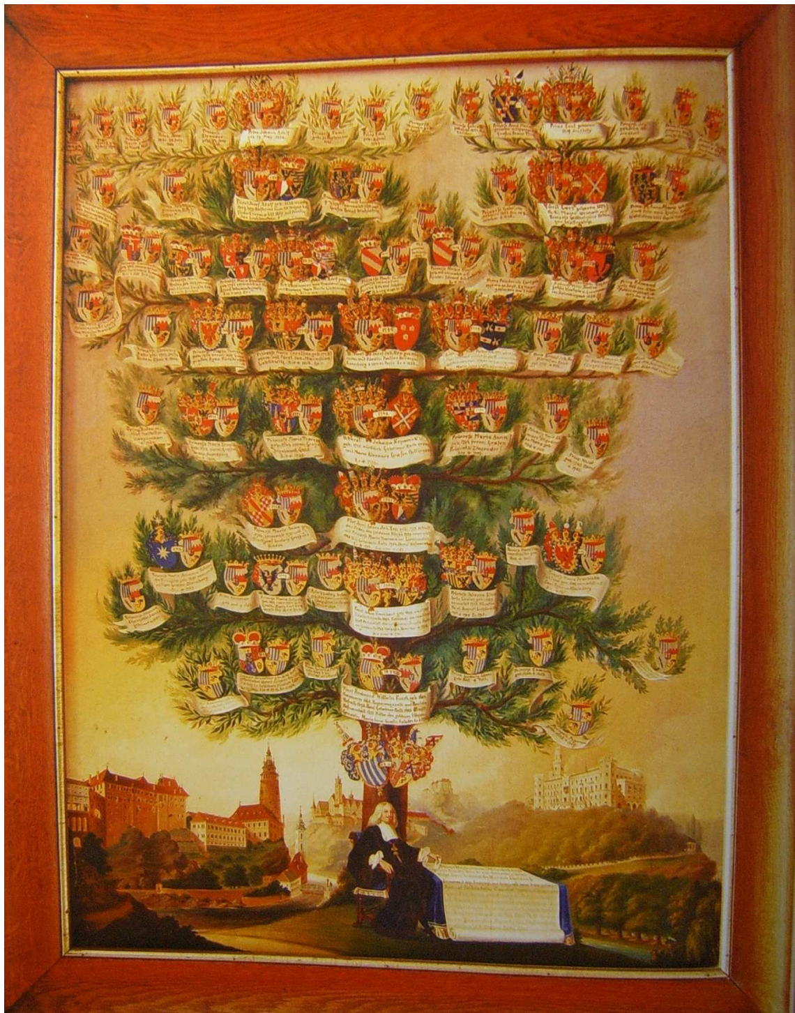
Obr. 1 Schwarzenberský rodokmen