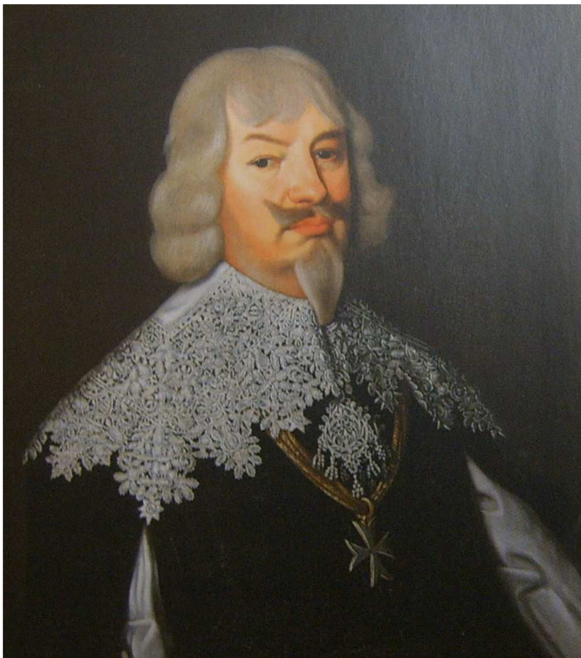
Obr. 3 Adam ze Schwarzenberku