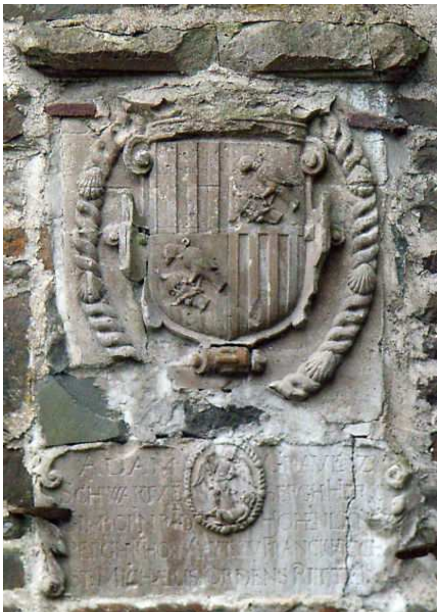
Obr. 5 Erb Adama ze Schwarzenberku na zámku Gimborn