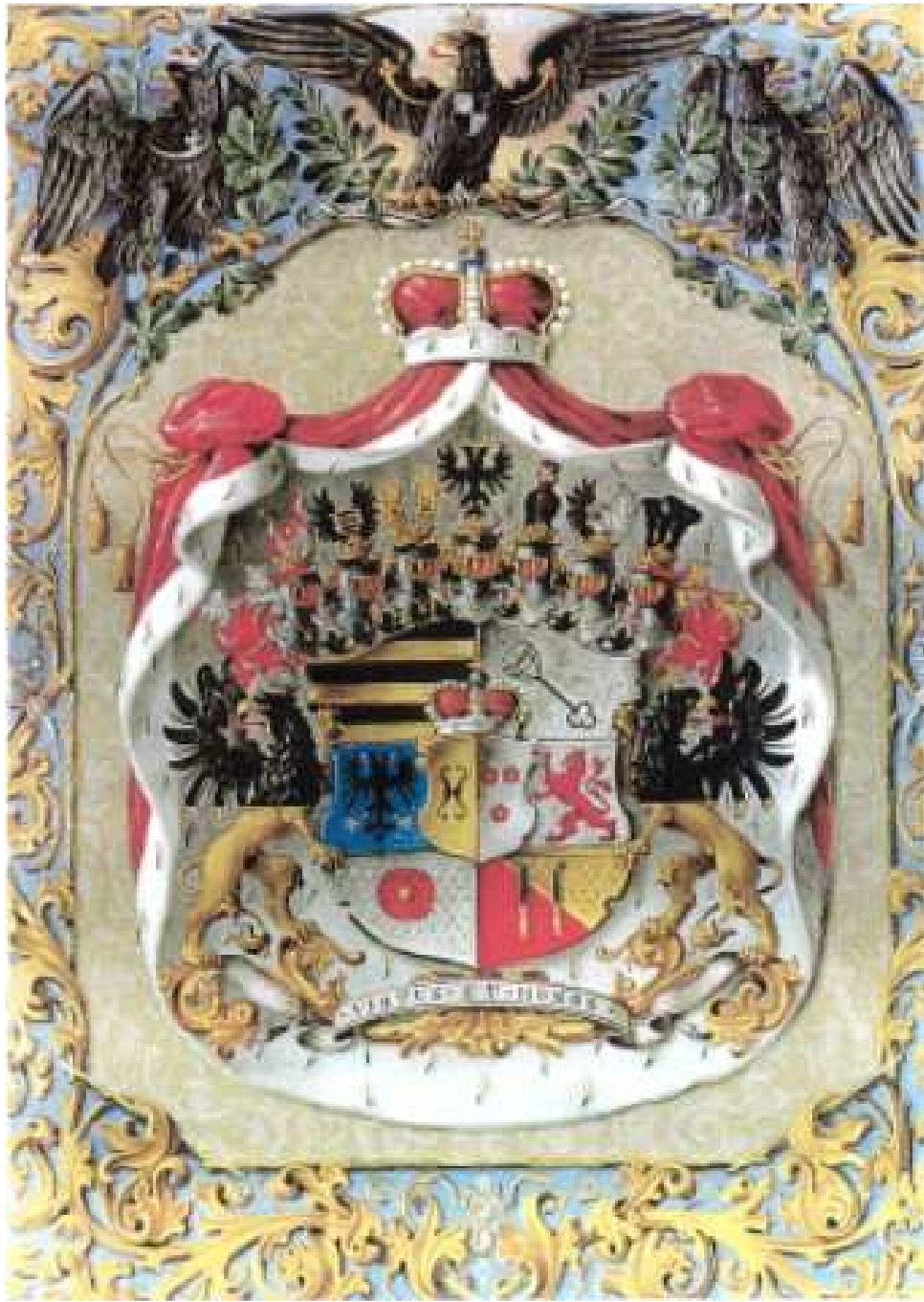
Obr. 6 Rodový erb šlechticů z Pallantu