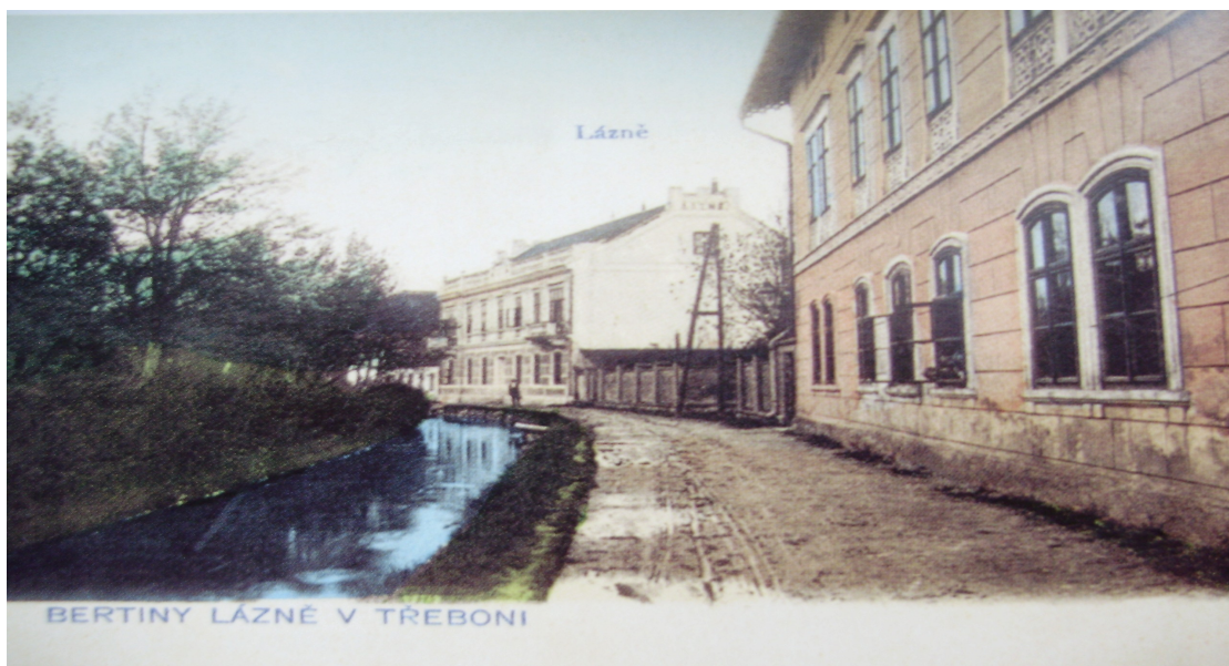
4. Bertiny lázně v Třeboni v 2. polovině 19. století