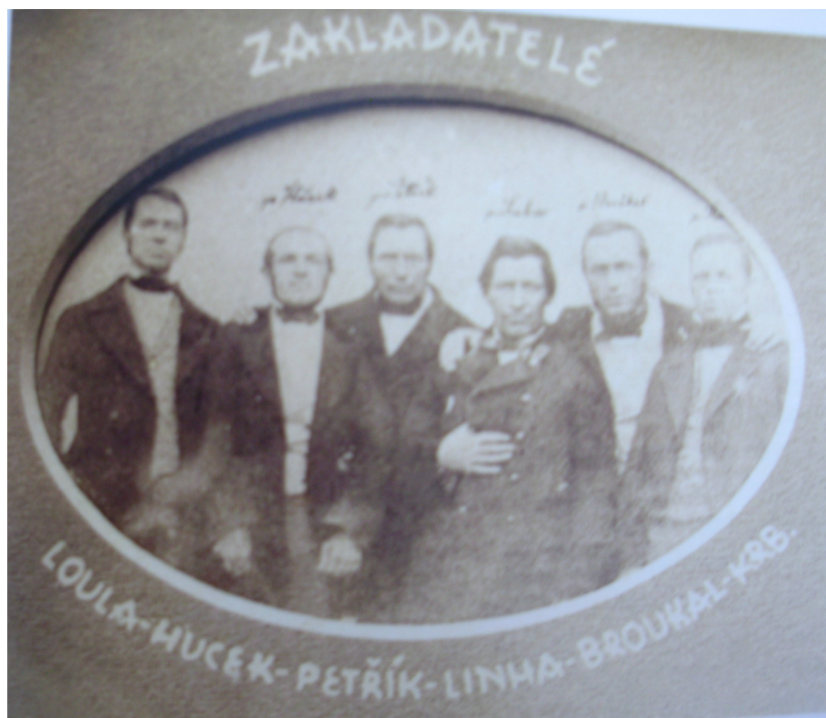
7. Zakladatelé spolku Pěslav