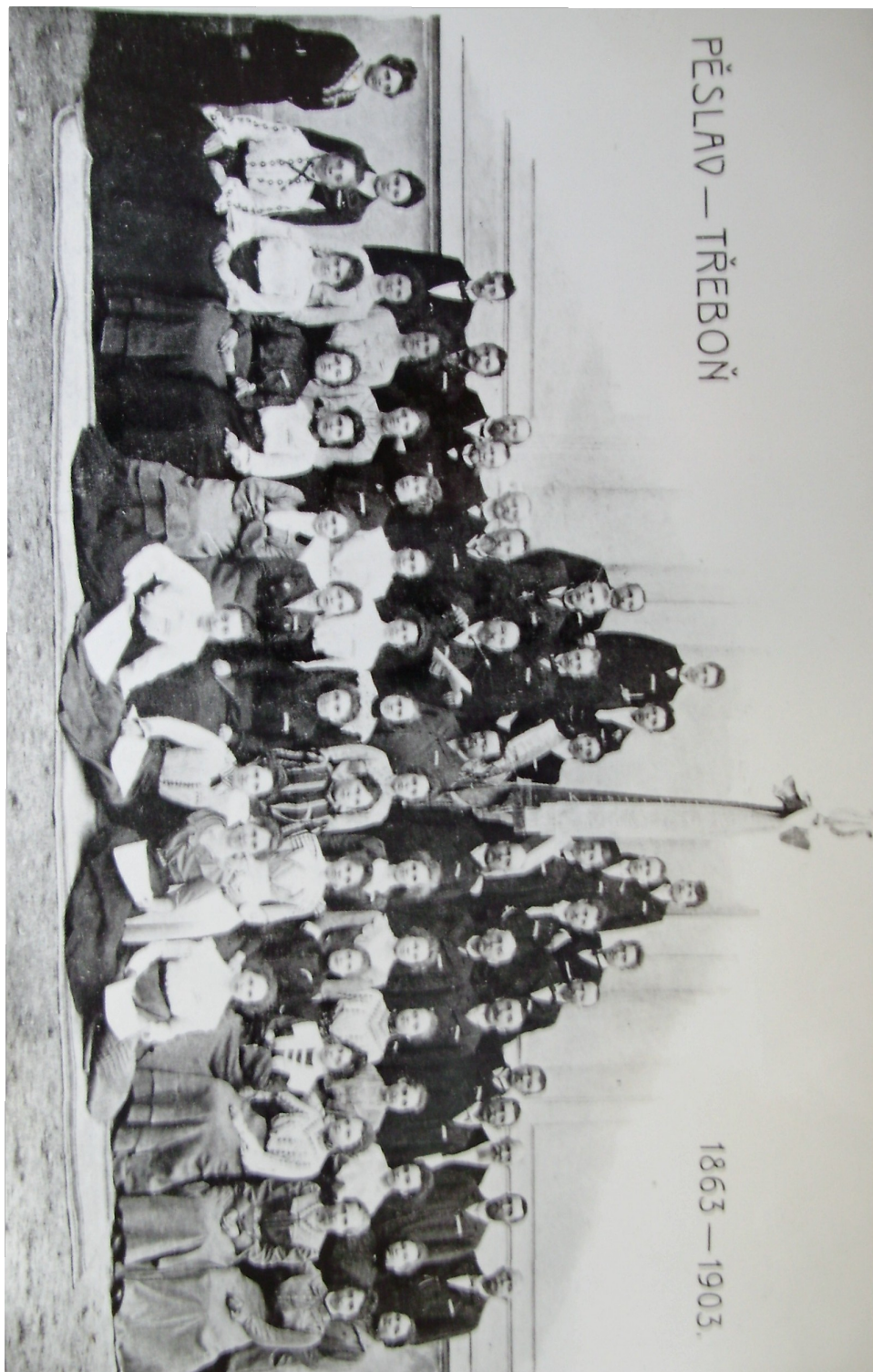
6. Oslava výročí 40 let činnosti Pěslavu