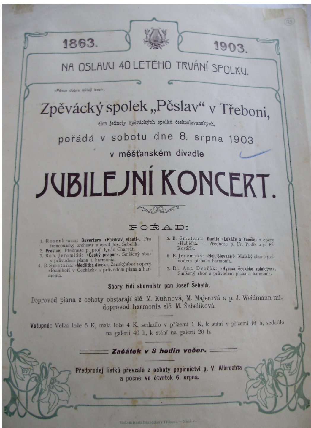
5. Program slavnosti u příležitosti výročí založení Pěslavu