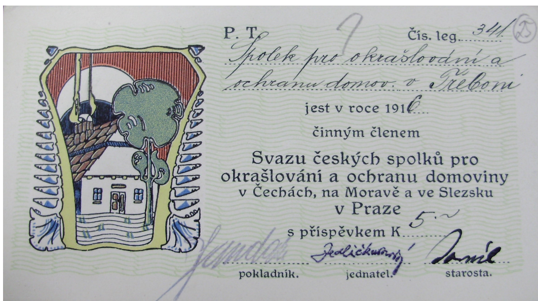
8. Členská legitimace Svazu českých spolků pro okrašlování a ochranu domoviny v Čechách, na Moravě a ve Slezsku