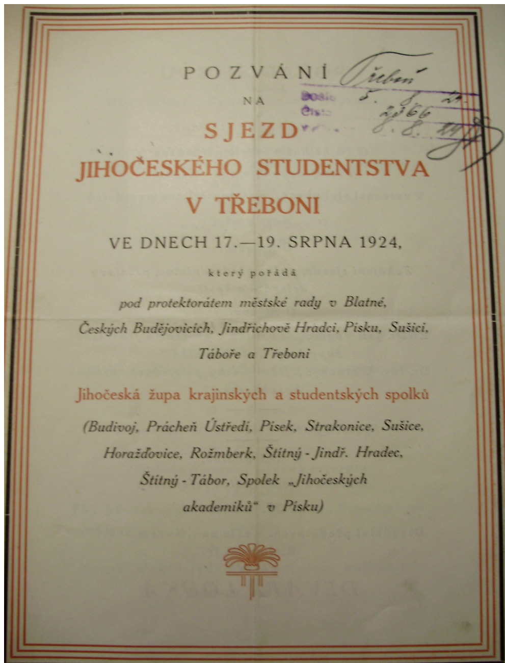
13. Pozvánka na sjezd studentstva do Třeboně.