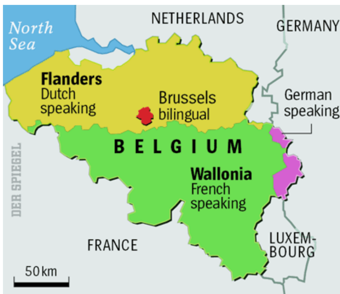
Obrázek č. 2: Mapa Belgie: regiony, jazykové komunity