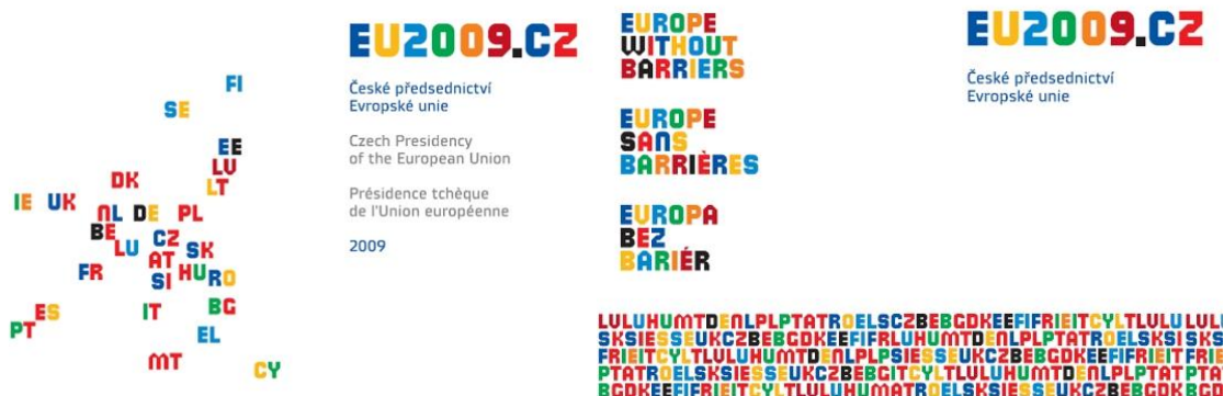
Obrázek č. 3: Logo a motto Českého předsednictví