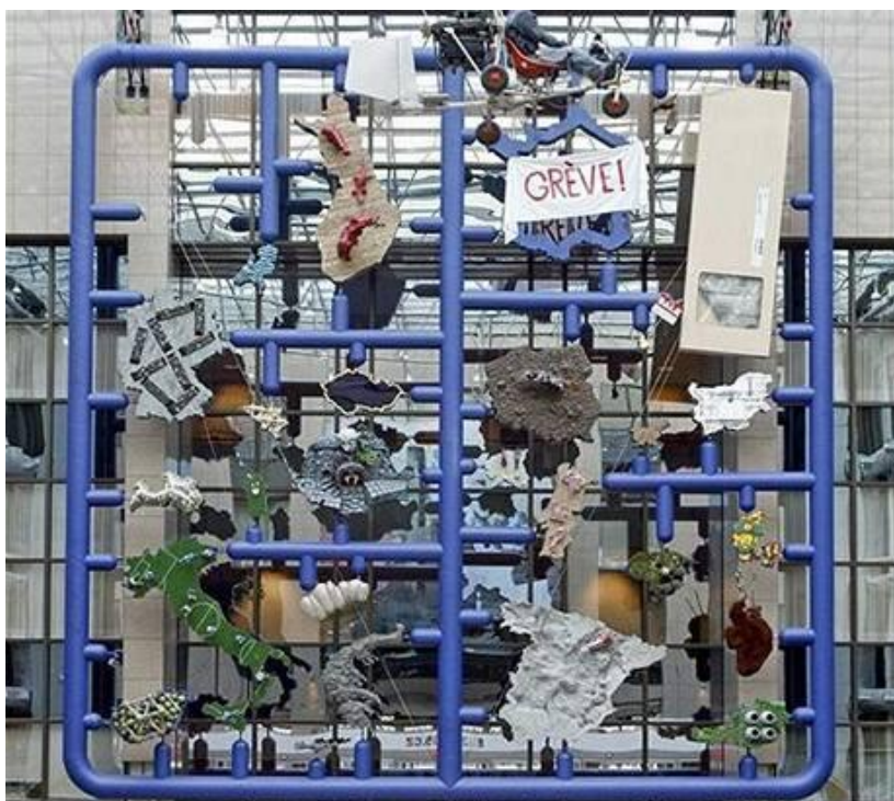
Obrázek č. 4: Entropa

Zdroj: http://www.davidcerny.cz/cz/entropa.html