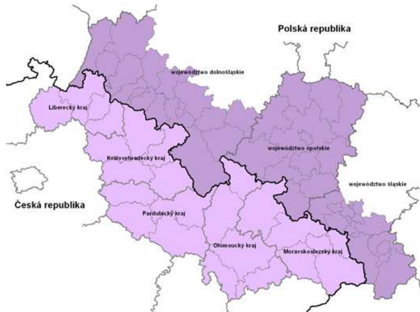
Obrázek č. 2: Mapa přeshraniční spolupráce ČR – Polsko