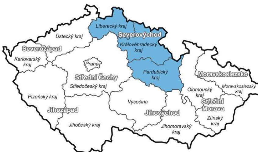
Obrázek č. 1: Vymezení regionu soudržnosti NUTS II Severovýchod na mapě ČR