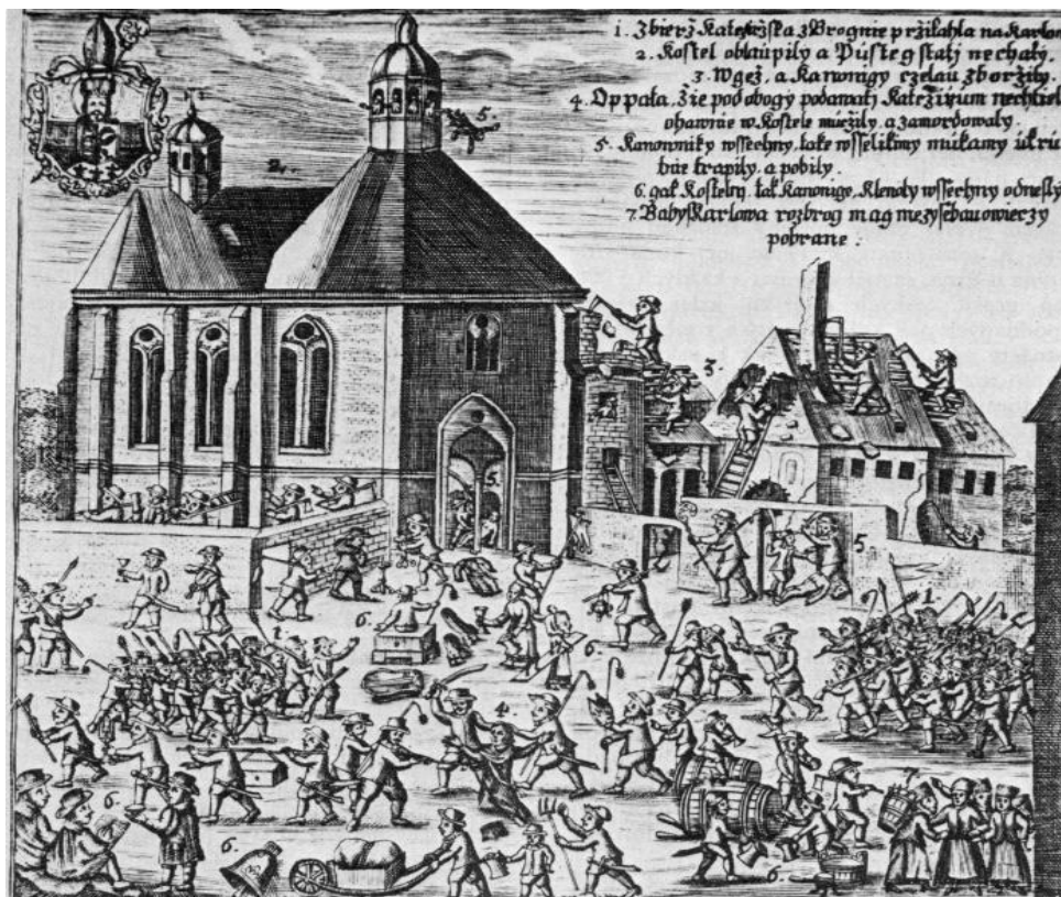
7.2.2. Útok na karlovskou kanonii s dobovým komentářem.