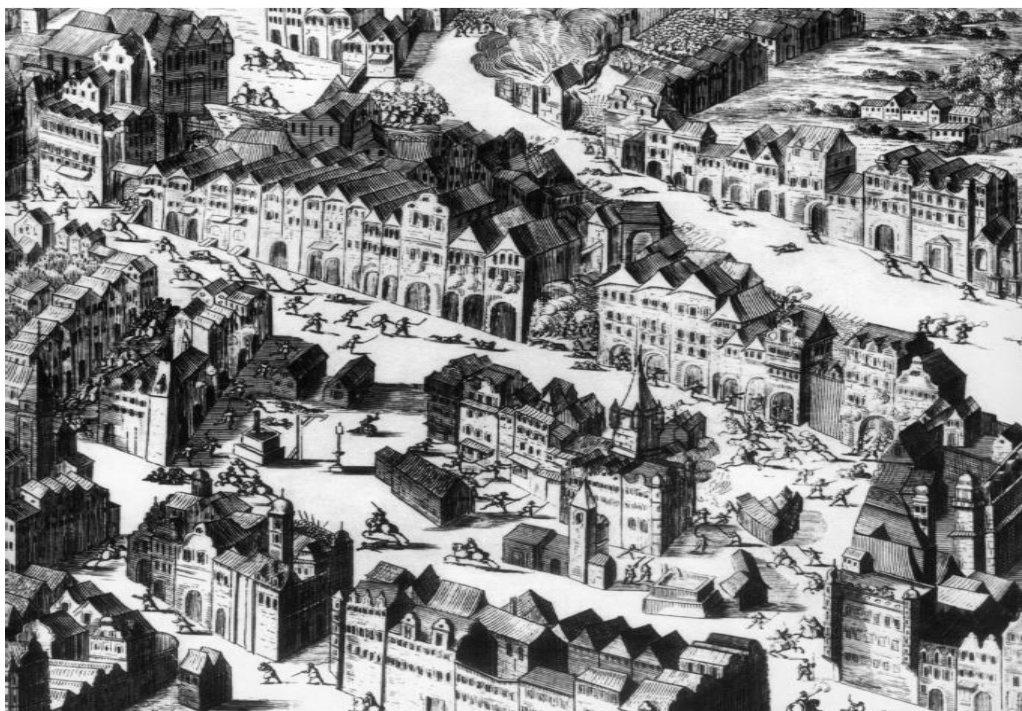
7.2.1. Výjev z pasovského vpádu na Malou Stranu.