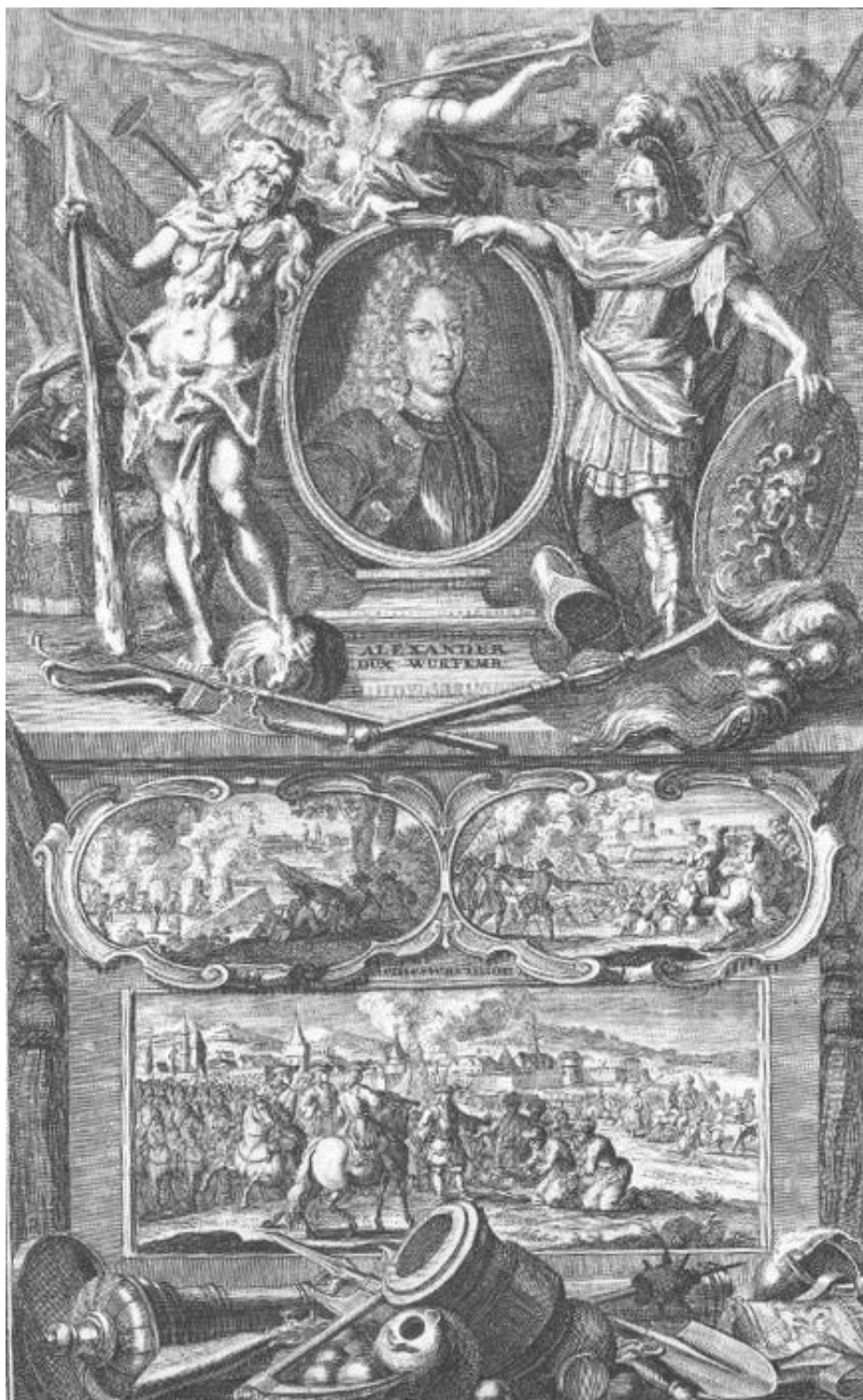
5. Oslava Karla Alexandra Württenberského se scénami dobývání a kapitulace Temešváru. Mědiryt Jacoba Andrease Friedricha.