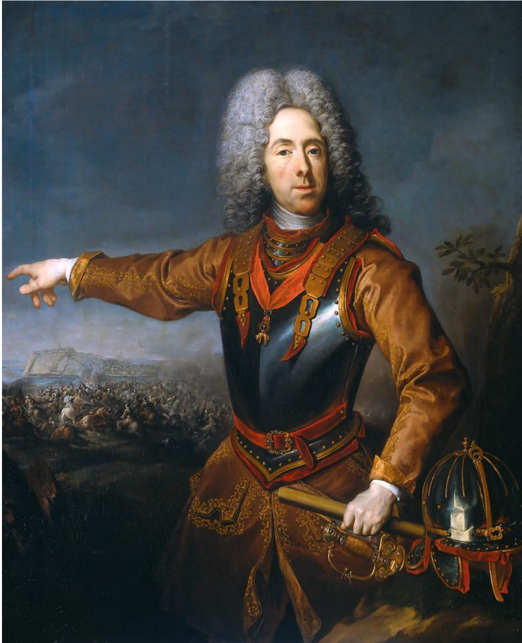
2. Jacob van Schuppen- Prinz Eugen von Savoyen (1718)