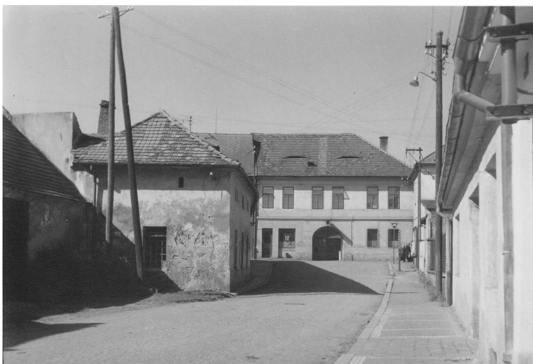
4. Křižovatka ulic Na Bezděkově s Vlašimskou před asanací