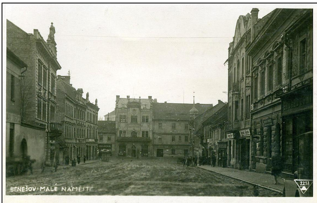
14. Původní podoba Malého náměstí před asanací