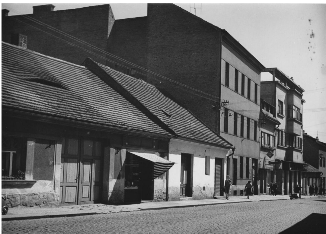
22. Severní strana Tyršovy ulice před asanací