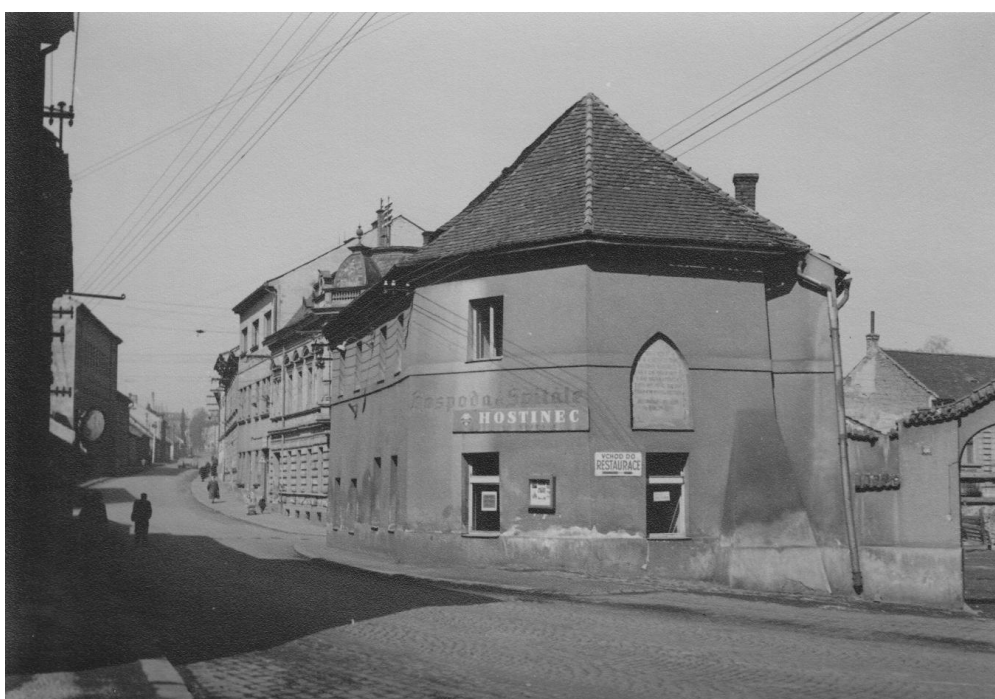
20. Pražská ulice s hospodou, svým tvarem prozrazuje bývalý kostel, před asanací