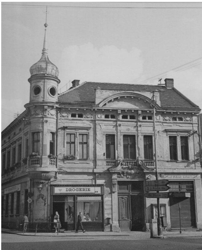
7. Severovýchodní nároží Malého náměstí před asanací