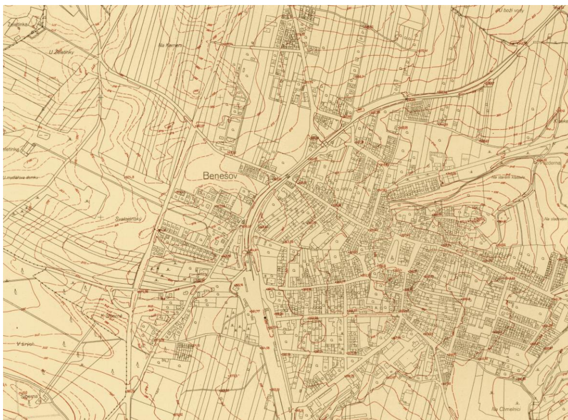
2. Odvozená státní mapa z roku 1950