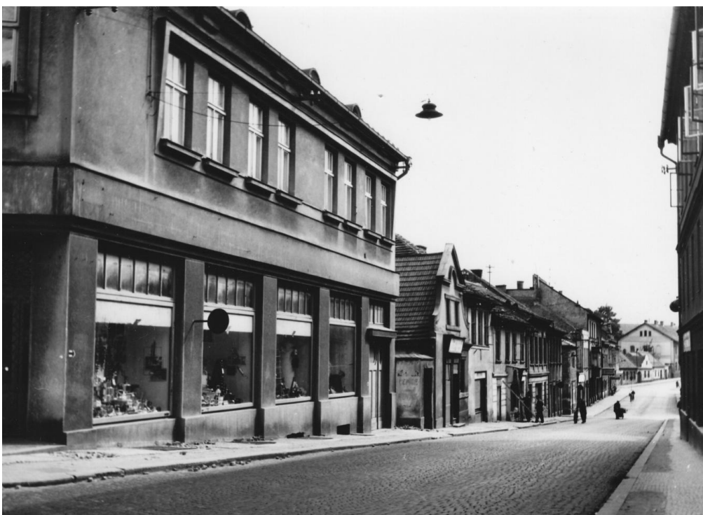
8. Ulice F.V.Mareše (dříve Zápotockého) před asanací