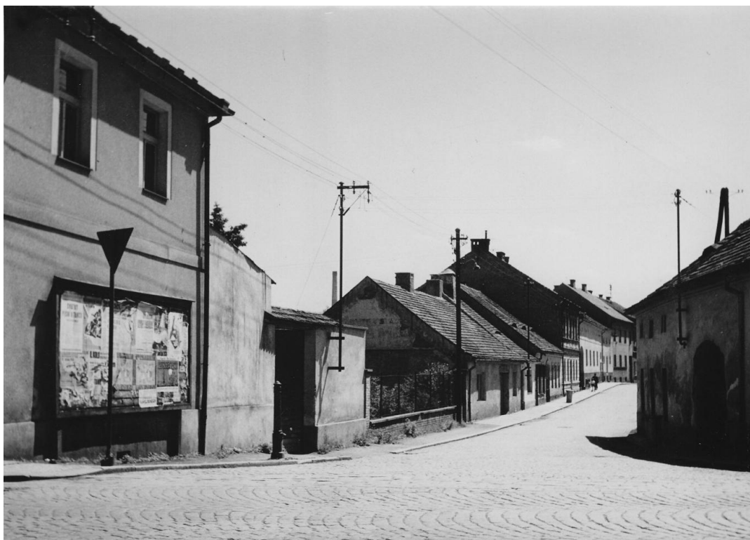
3. Ulice Na Bezděkově před asanací