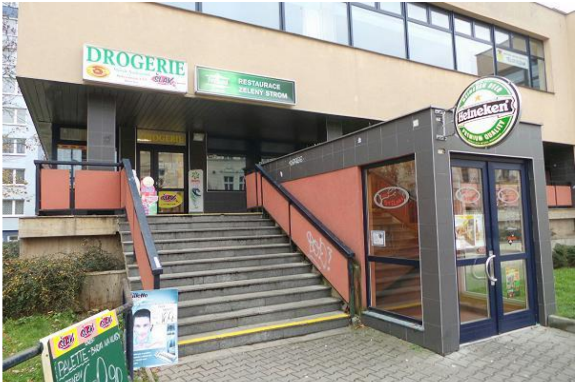
5. Současný stav severovýchodního nároží Malého náměstí.