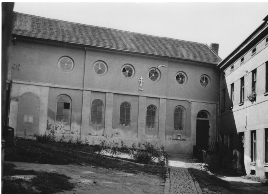
16. Synagoga v ulici Pod Brankou před asanací;