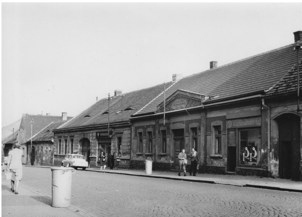
23. Jižní strana Tyršovy ulice před asanací