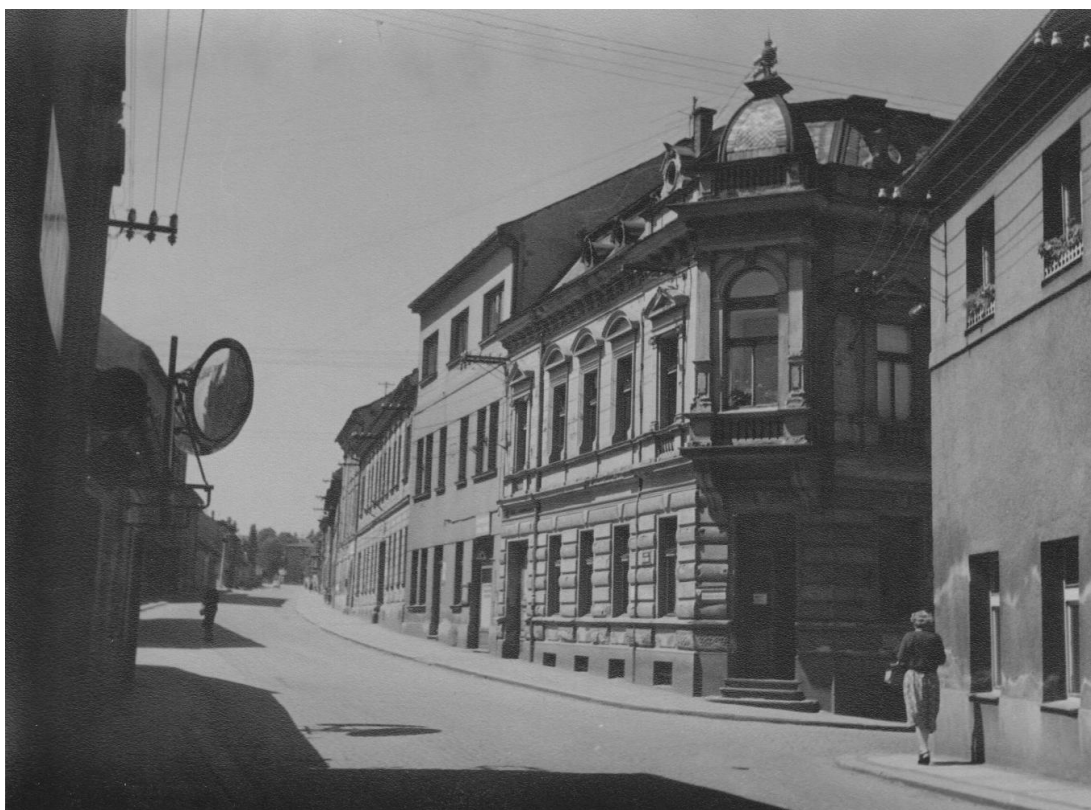
12. Pražská ulice před asanací