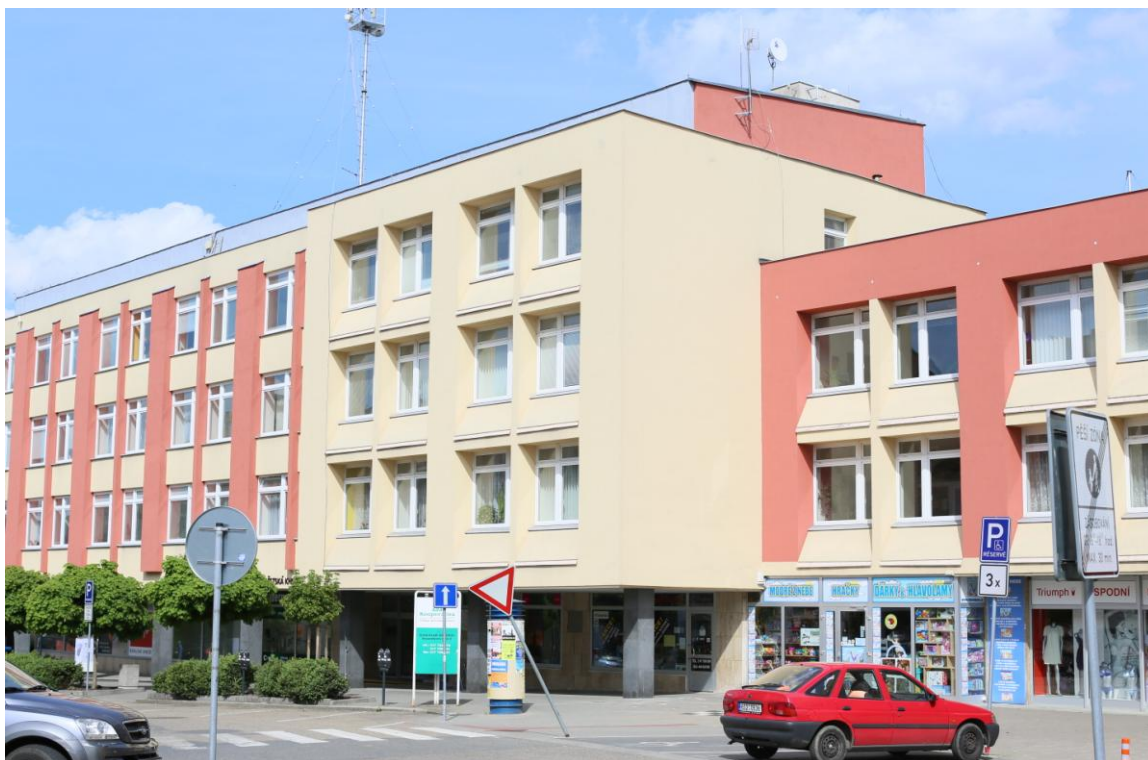
15. Současná podoba východní strany Malého náměstí, bývalá budova OV KSČ