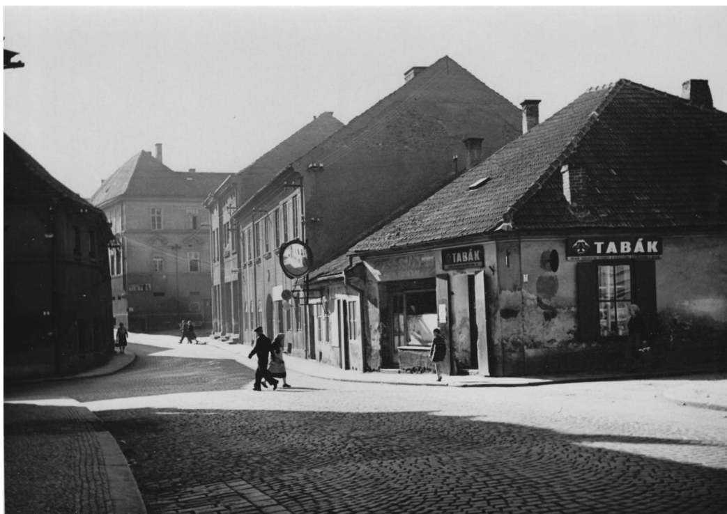
21. Křížení ulic Vnoučkova, Pražská a Nová Pražská, před asanací