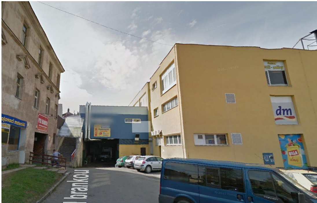
17. Roh ulic Pod Brankou a Pražské, současný stav