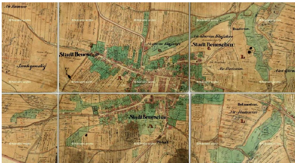
1. Mapa Benešova z roku 1840