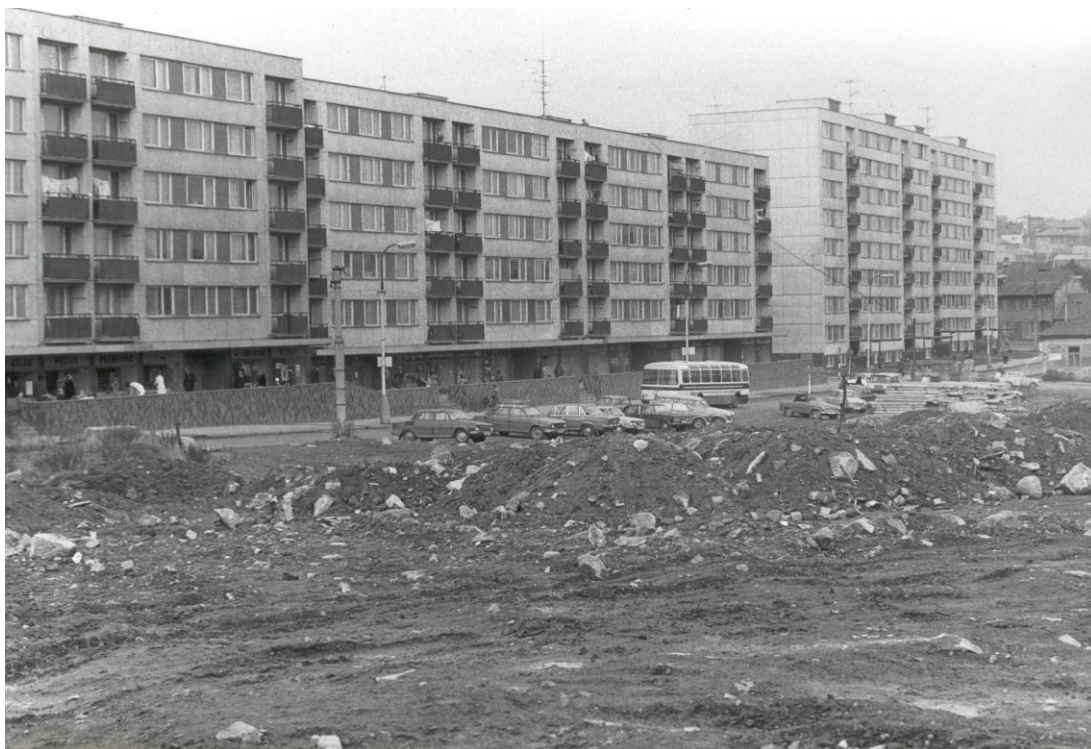
11. Ulice Nová Pražská (dříve Fučikova) po asanaci a panelové výstavbě