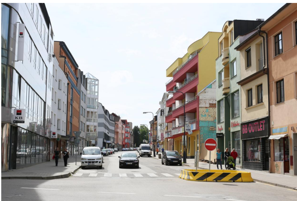
24. Současný stav Tyršovy ulice