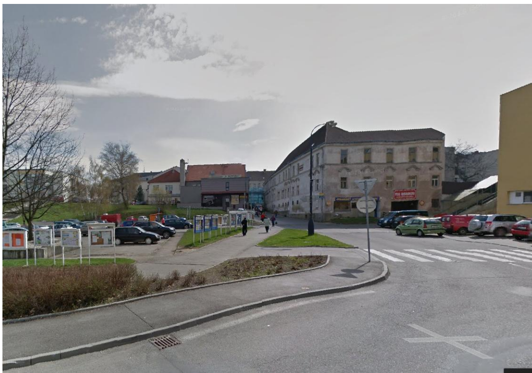
19. Současná podoba křížení ulic Vnoučkova, Pražská a Nová Pražská