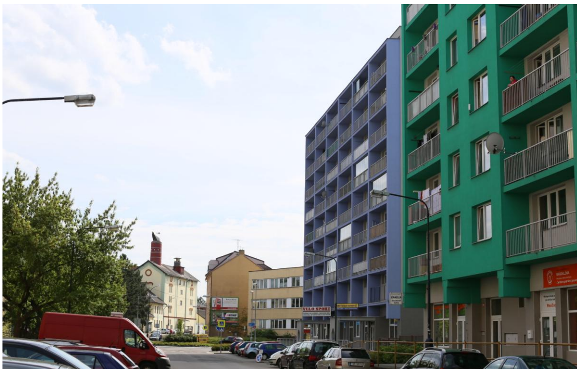
9. Současná podoba panelové výstavby v ulici Na Bezděkově