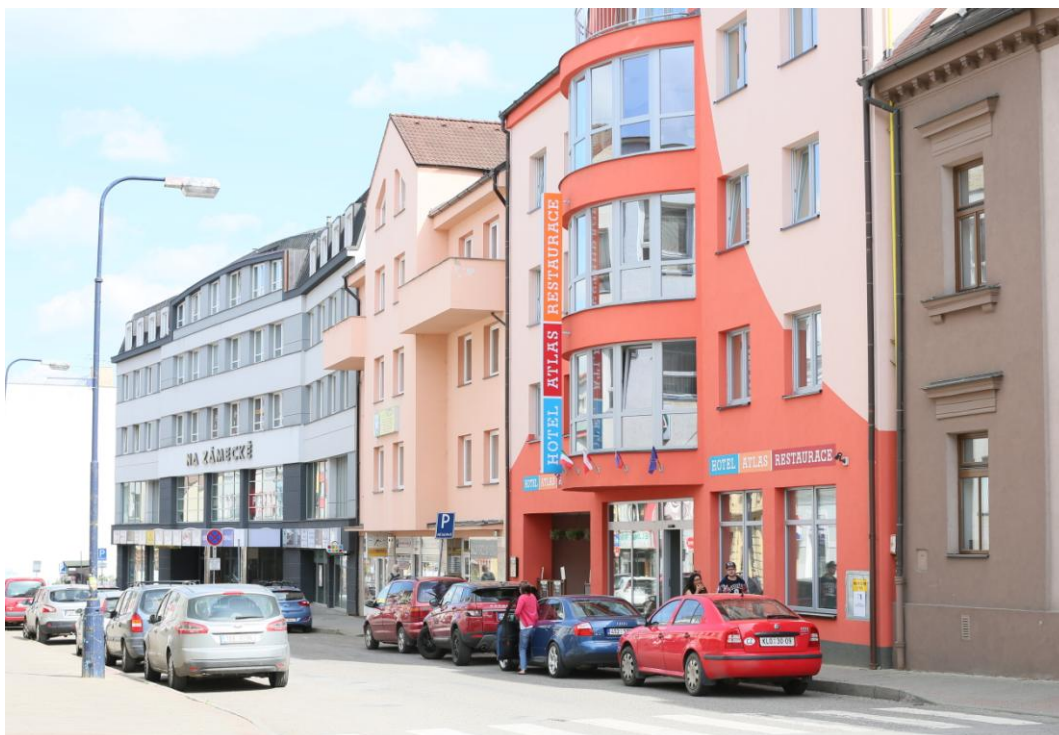
25. Současný stav Tyršovy ulice