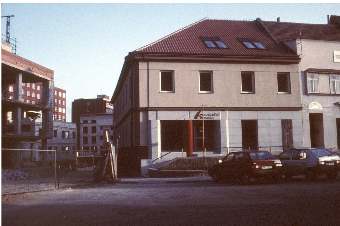
10. Ulice F.V.Mareše (dříve Zápotockého) v průběhu přestavby