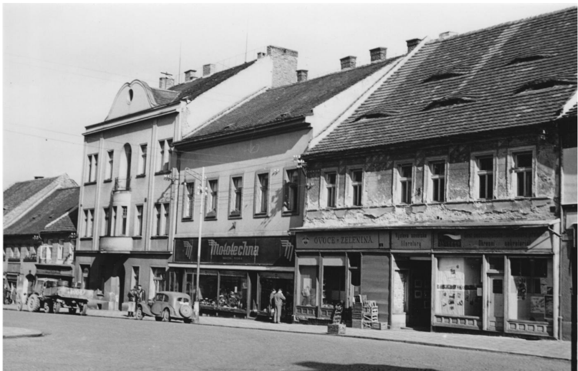
6. Východní strana Malého náměstí před asanací