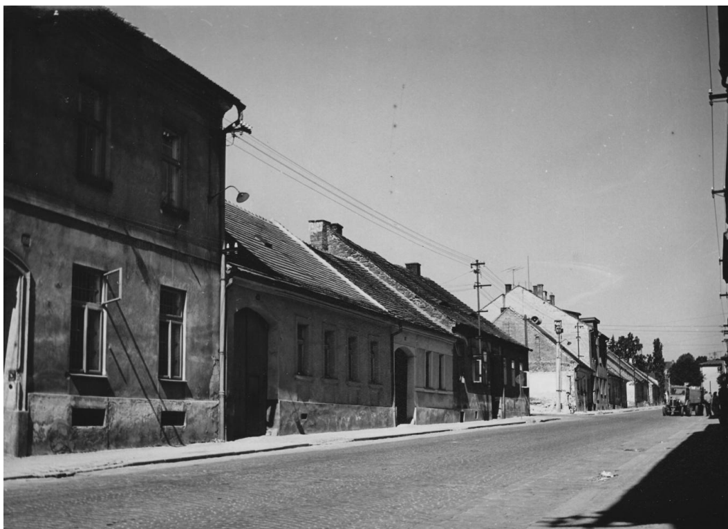
13. Pražská ulice před asanací