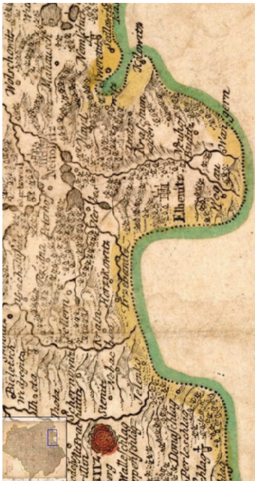
Mapa č. 1: Poloha Lhenic v Prácheňském kraji 1780-1800 (zdroj: Mapy ze sbírek Jihočeské vědecké knihovny v Českých Budějovicích, digitalizováno na http://www.kohoutikriz.org/data/mapy.php )