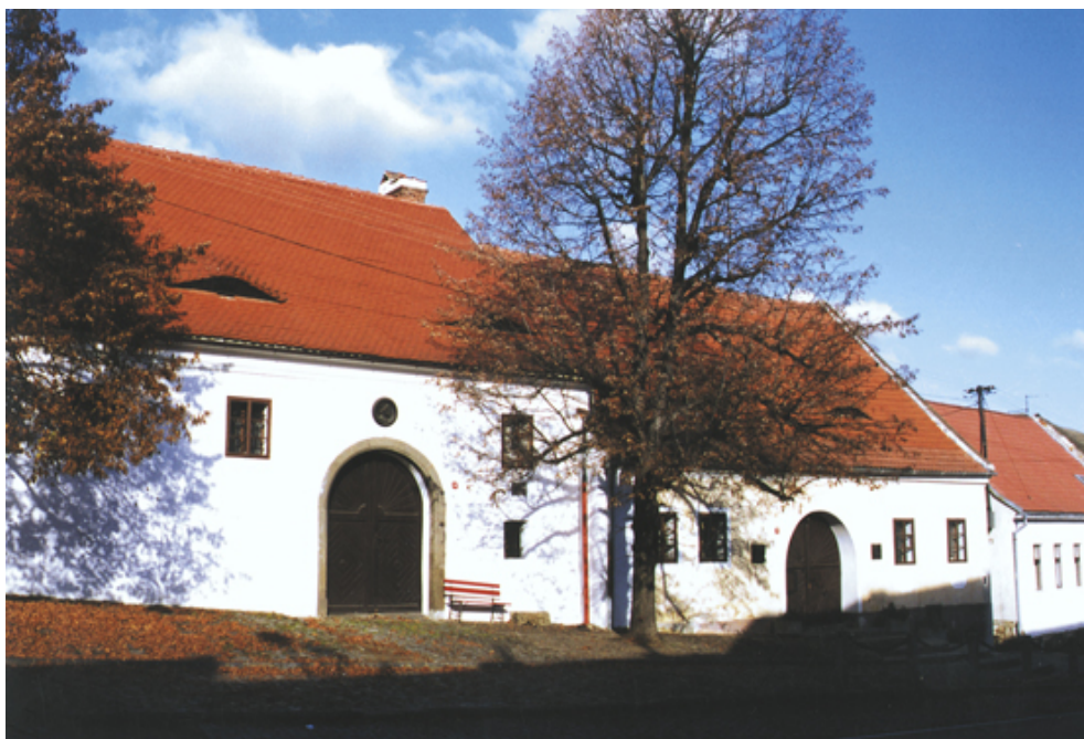
Obr. 1 – rodný dům Mistra Jana Husa