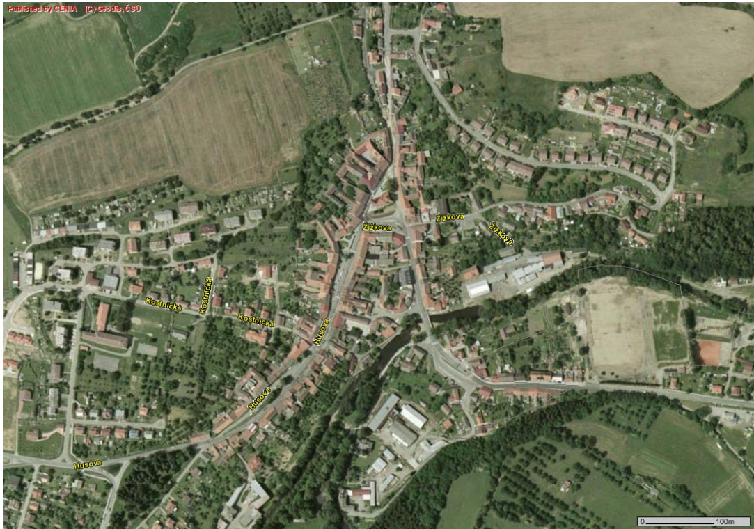
Obr. 1 – Husinec - zástavba (ortofoto)