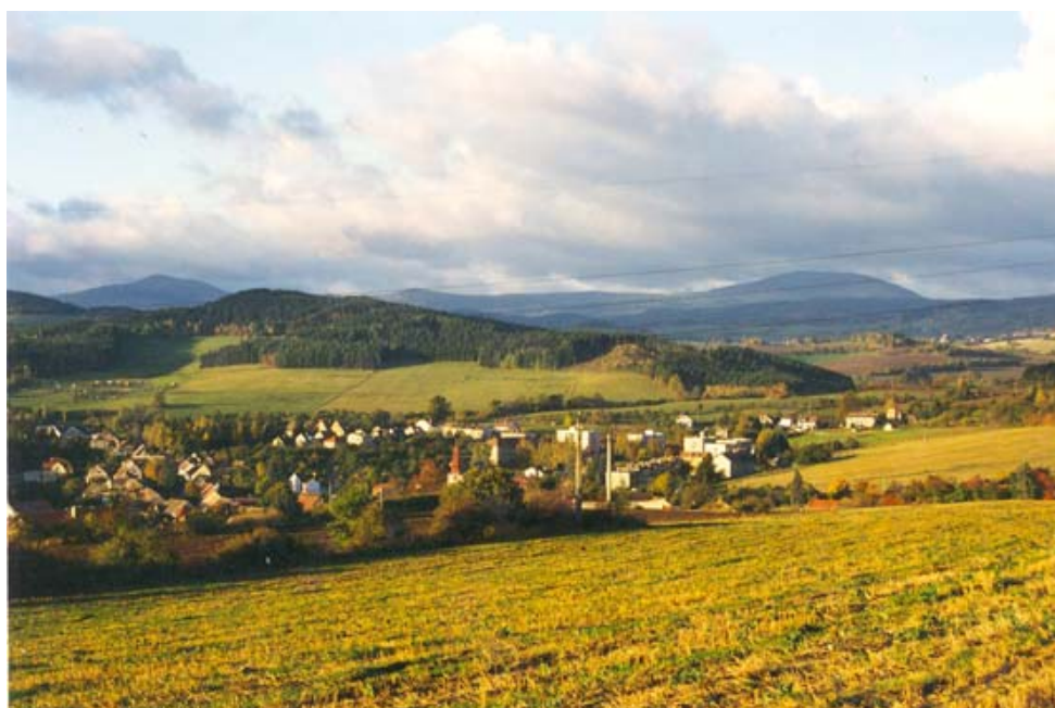
Obr. 6 – typické siluety Bobíku a Boubínu