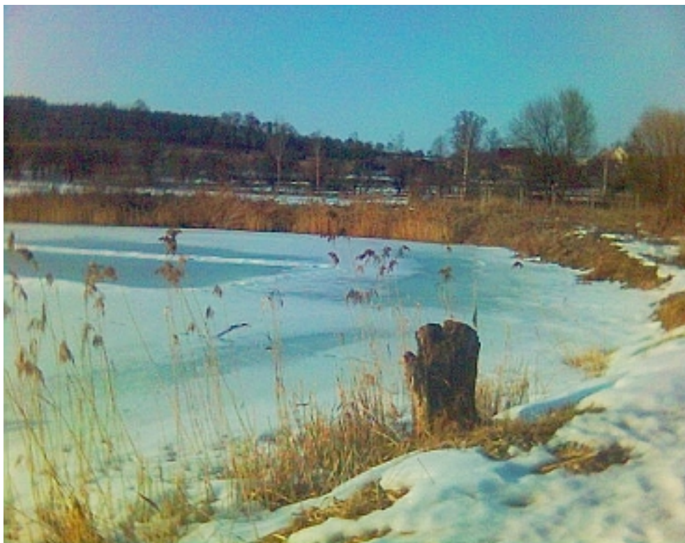
Obr. 3 – nádrž na Drozdovském potoce