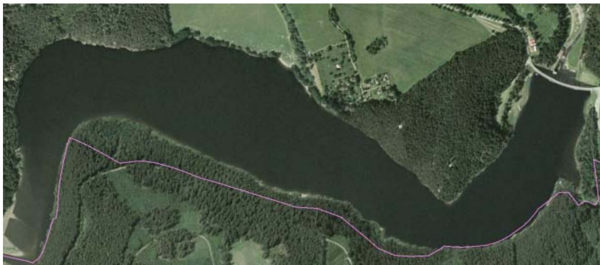
Obr. 1 – přehradní nádrž Husinec (ortofoto)