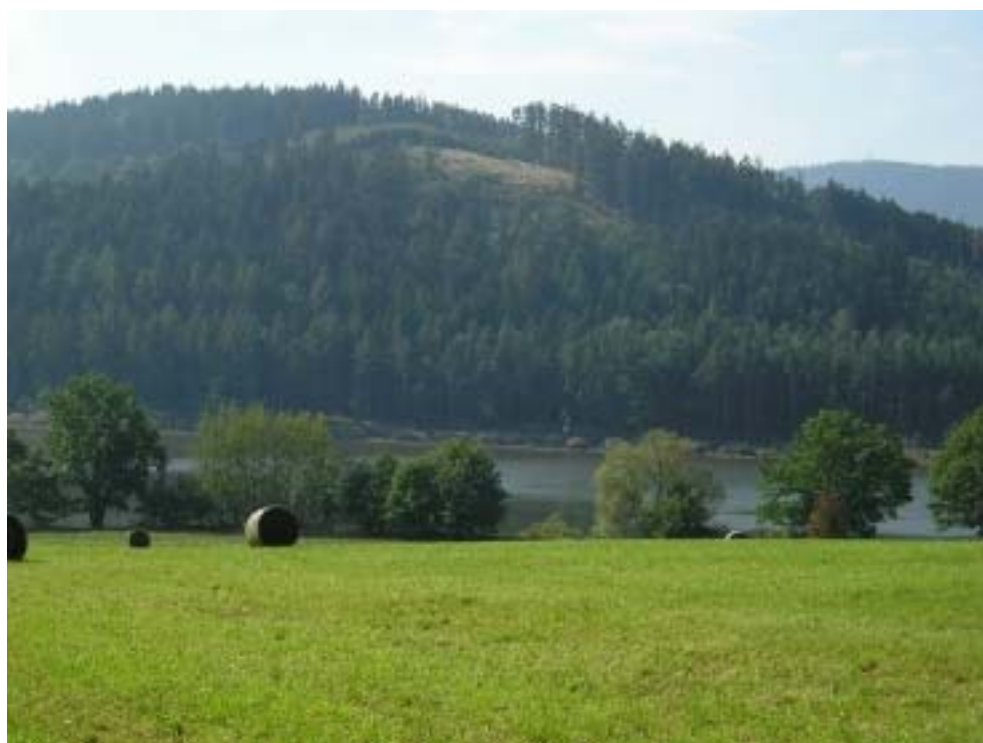
Obr. 2 – přehradní nádrž – pohled ze severní otevřené části