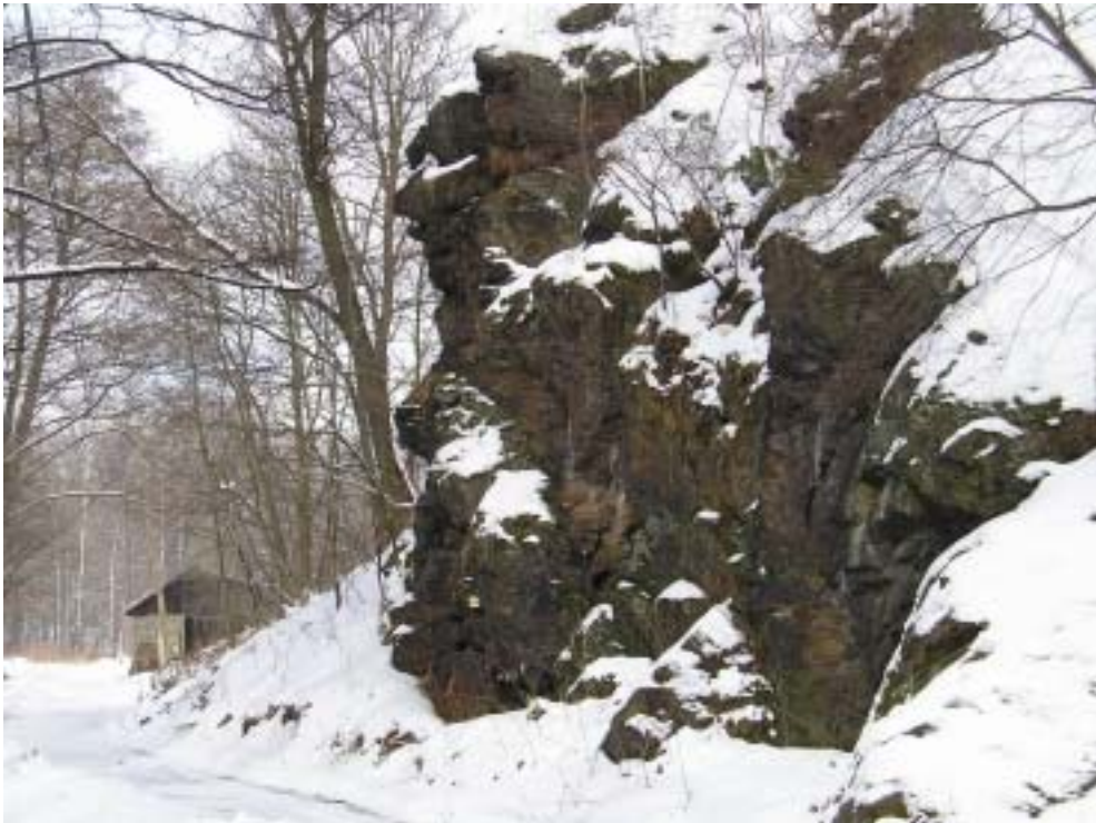
Obr. 5 – Husova skála