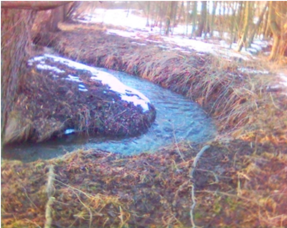
Obr. 1 – přirozené koryto Drozdovského potoka