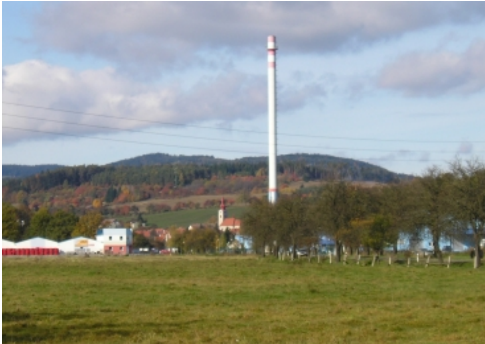
Obr. 11 – východní pohled na Husinec Průmyslový komín zastiňuje kostel jak dominantu.