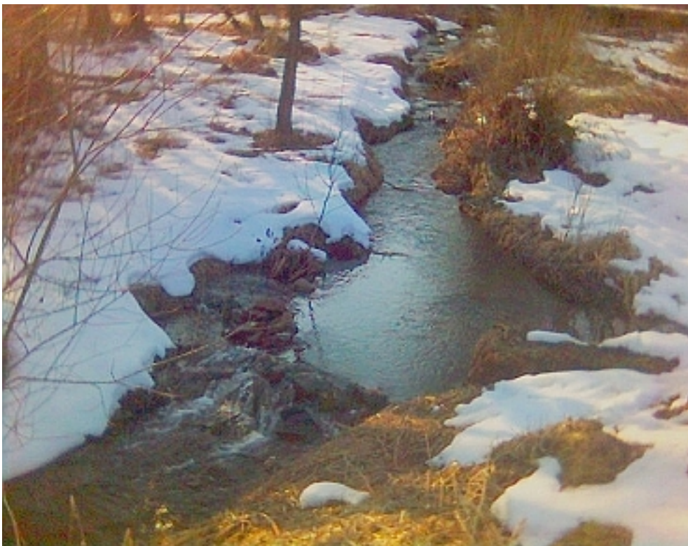
Obr. 2 – Drozdovský potok – tůňka