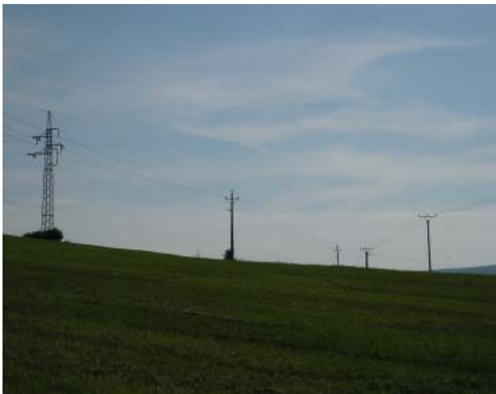
Obr. 1 – sloupy vysokého napětí v polní krajině