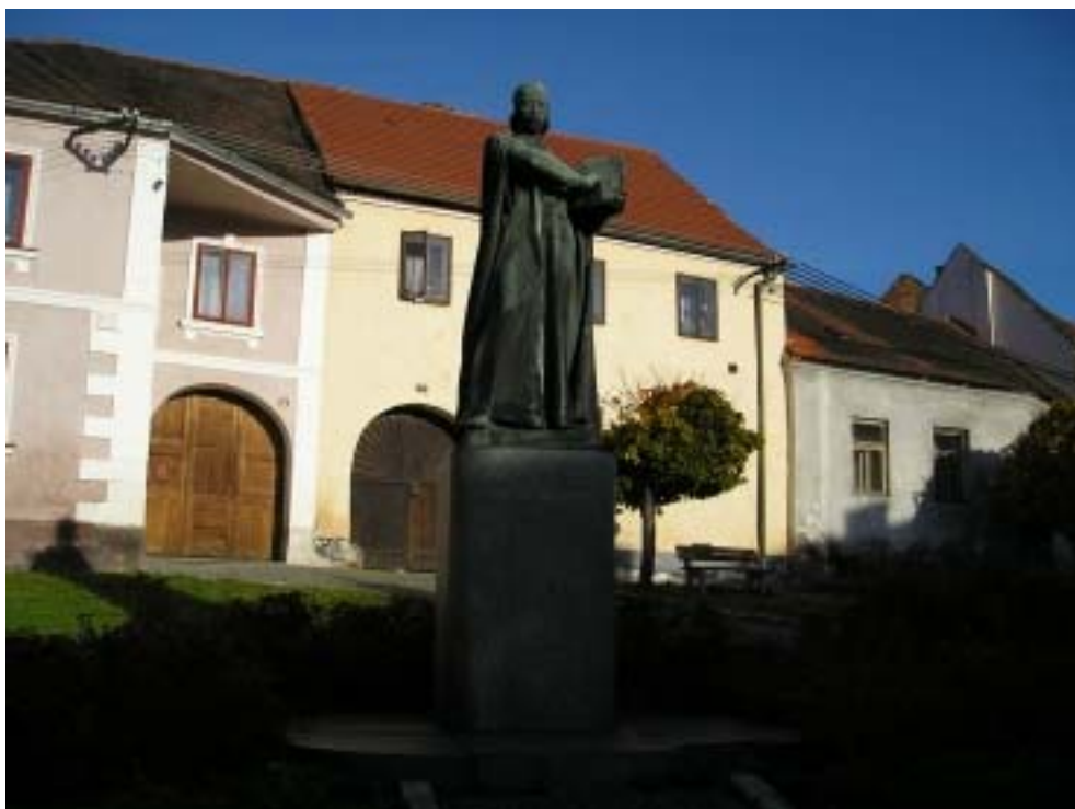
Obr. 2 - socha Mistra Jana z roku 1958 od Karla Lidického