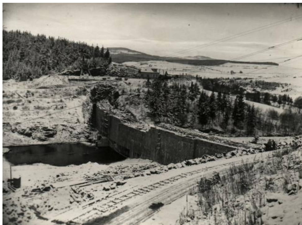
Obr. 4 – výstavba přehradní nádrže