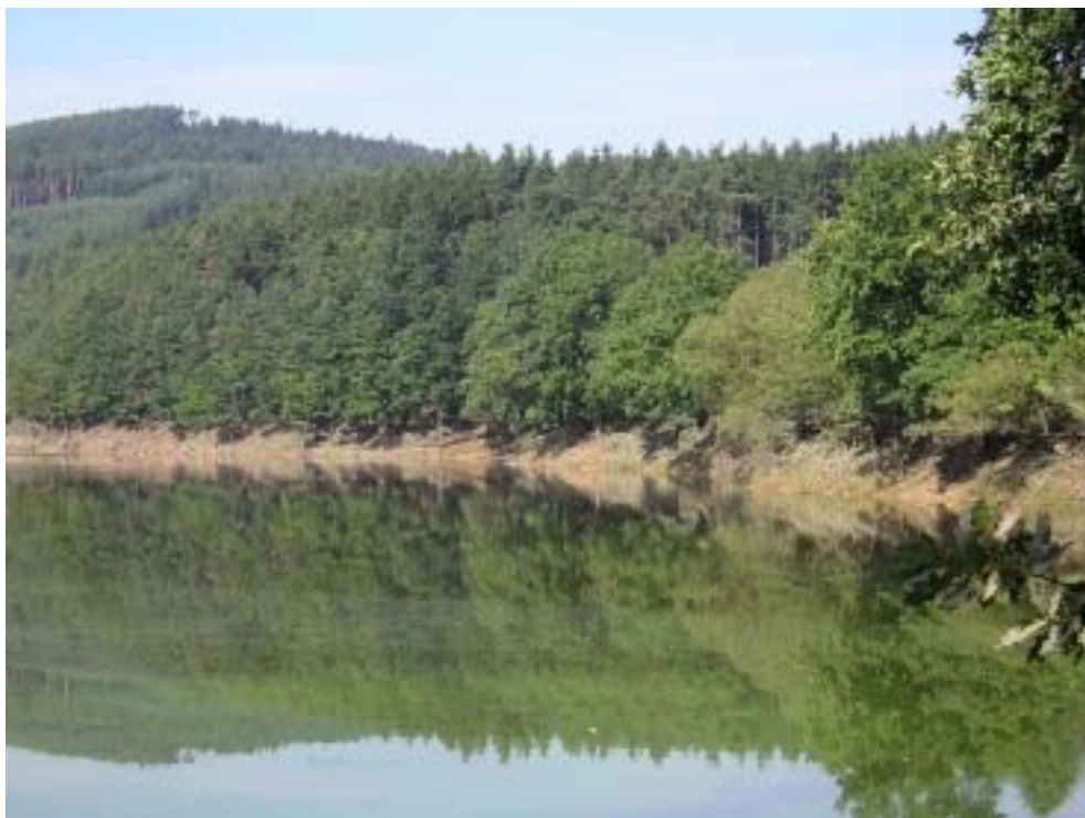
Obr. 3 – přehradní nádrž – typický pohled na břehové společenstvo