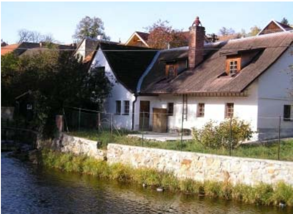
Obr. 7 a 8 – zástavba u řeky