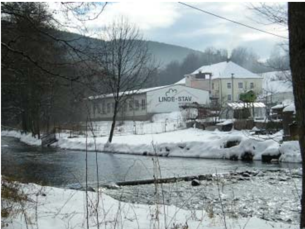
Obr. 6 – průmyslové stavby u Husovy skály