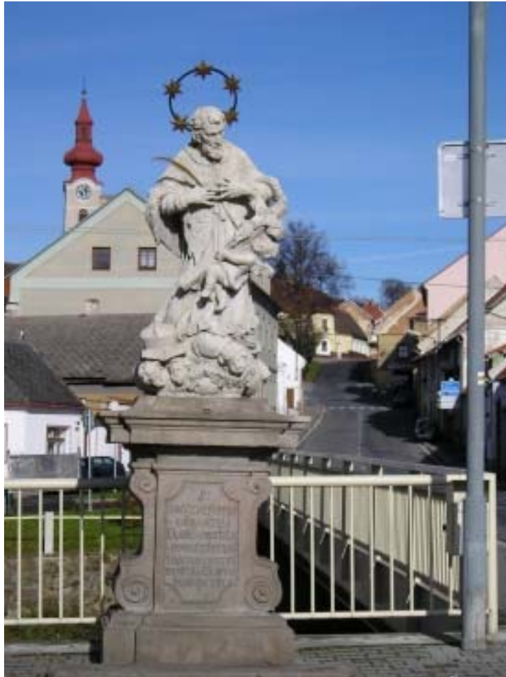
Obr. 5 - socha sv. Jana Nepomuckého