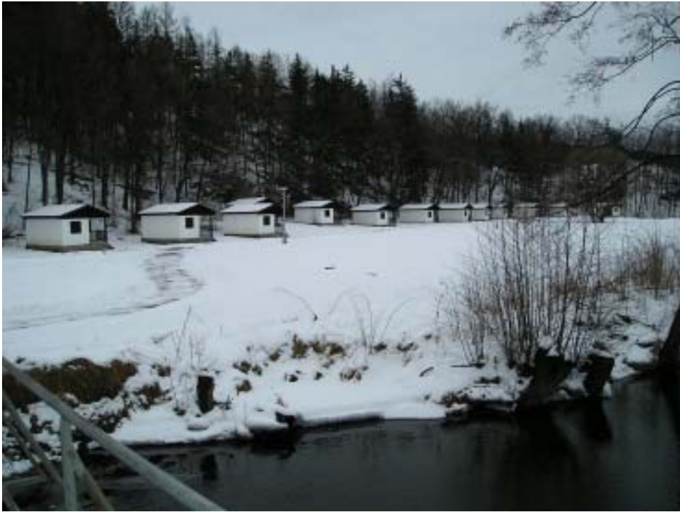
Obr. 9 – chatová oblast u řeky