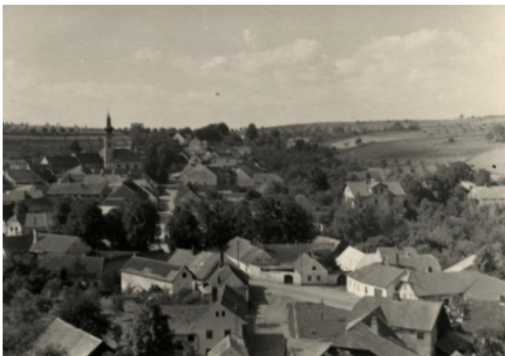
Obr. 2 – Polní krajina v roce 1940