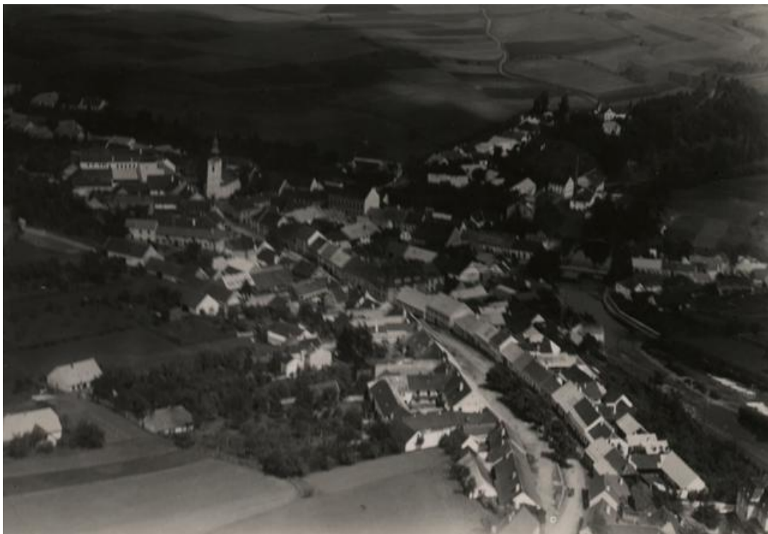
Obr. 2 – Husinec – letecký snímek z roku 1934