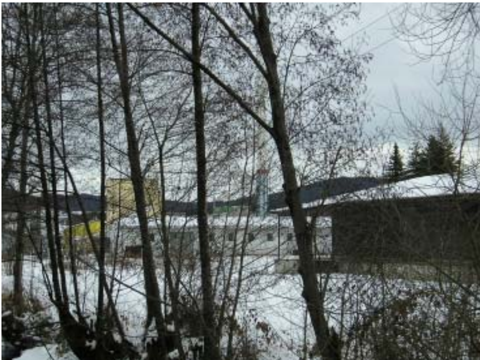
Obr. 10 – průmyslová zóna pohled od řeky