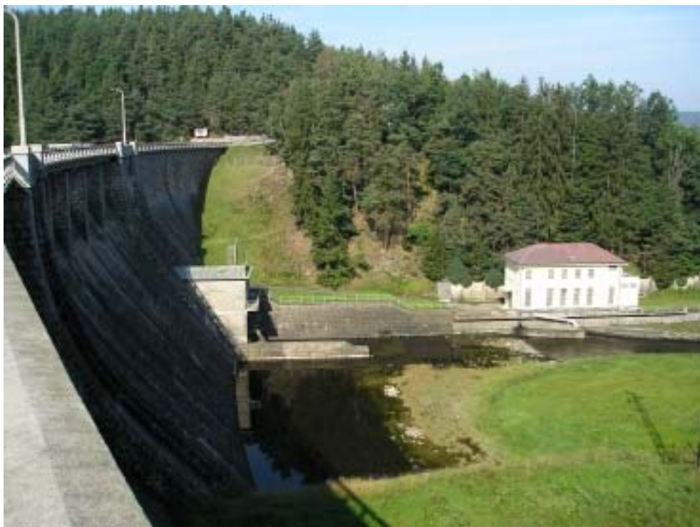
Obr. 5 – hráz s elektrárnou