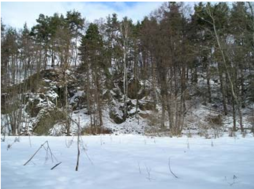
Obr. 1 a 2 – údolí řeky