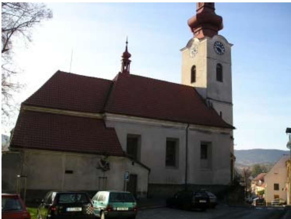
Obr. 3 - kostel sv. Kříže