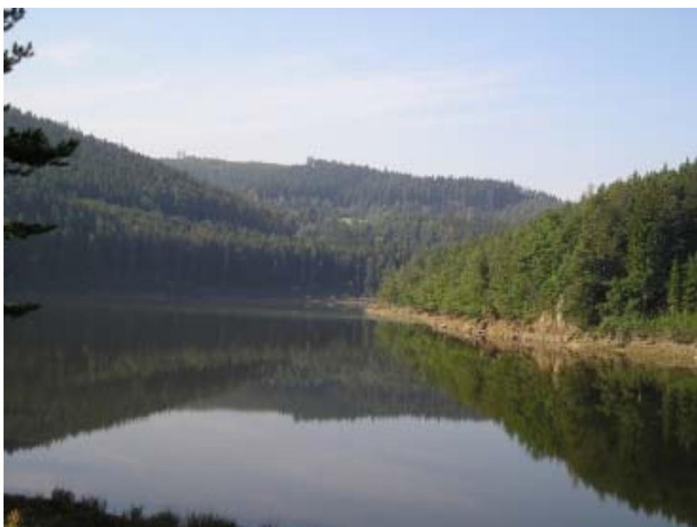
Obr. 7 a 8 – přehradní nádrž – pohled z hráze