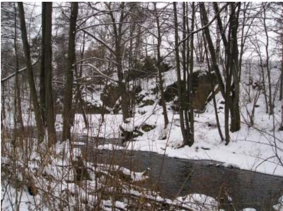
Obr. 3 a 4 – typické porosty olší