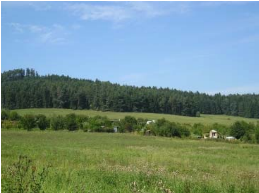
Obr. 1 – zahrádkářská kolonie zasazená do luční krajiny