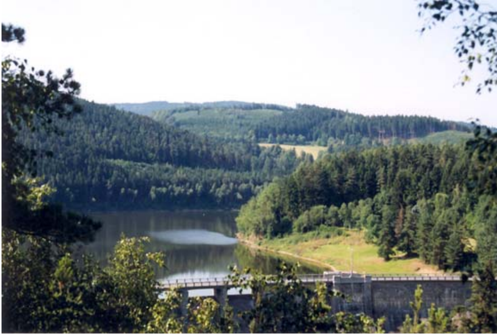
Obr. 9 – přehradní nádrž - pohled z Výrovky