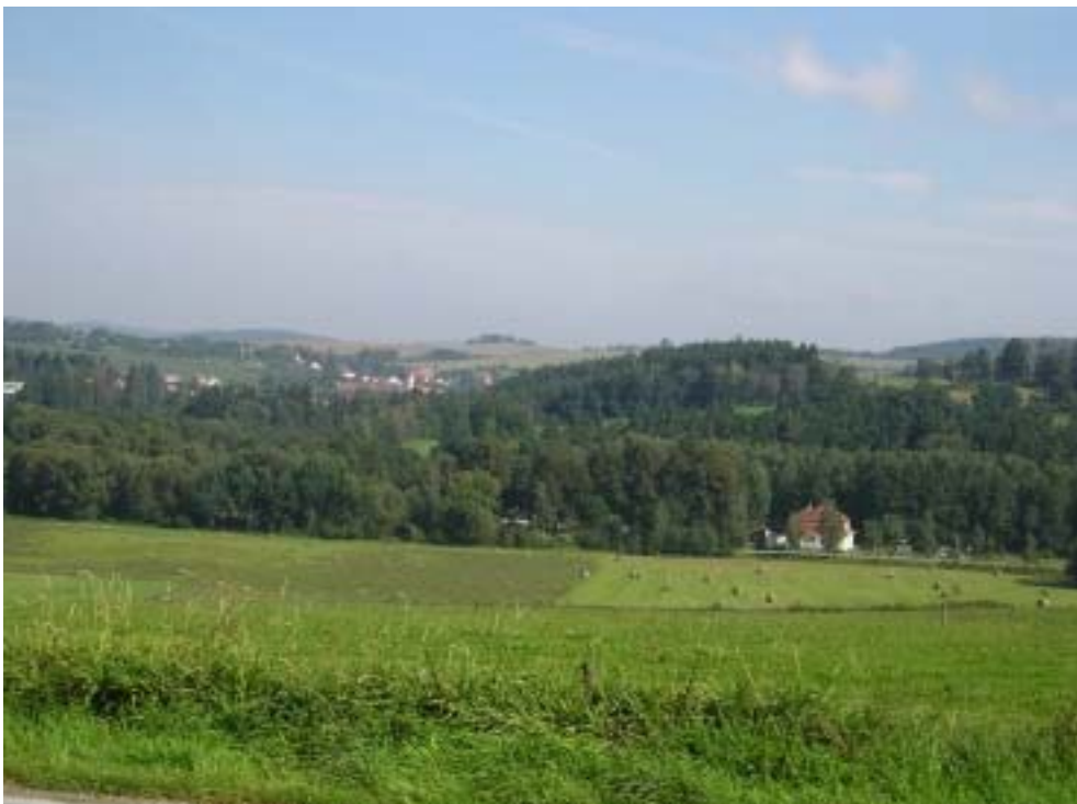
Obr. 2 – široký pohled přes Husinec