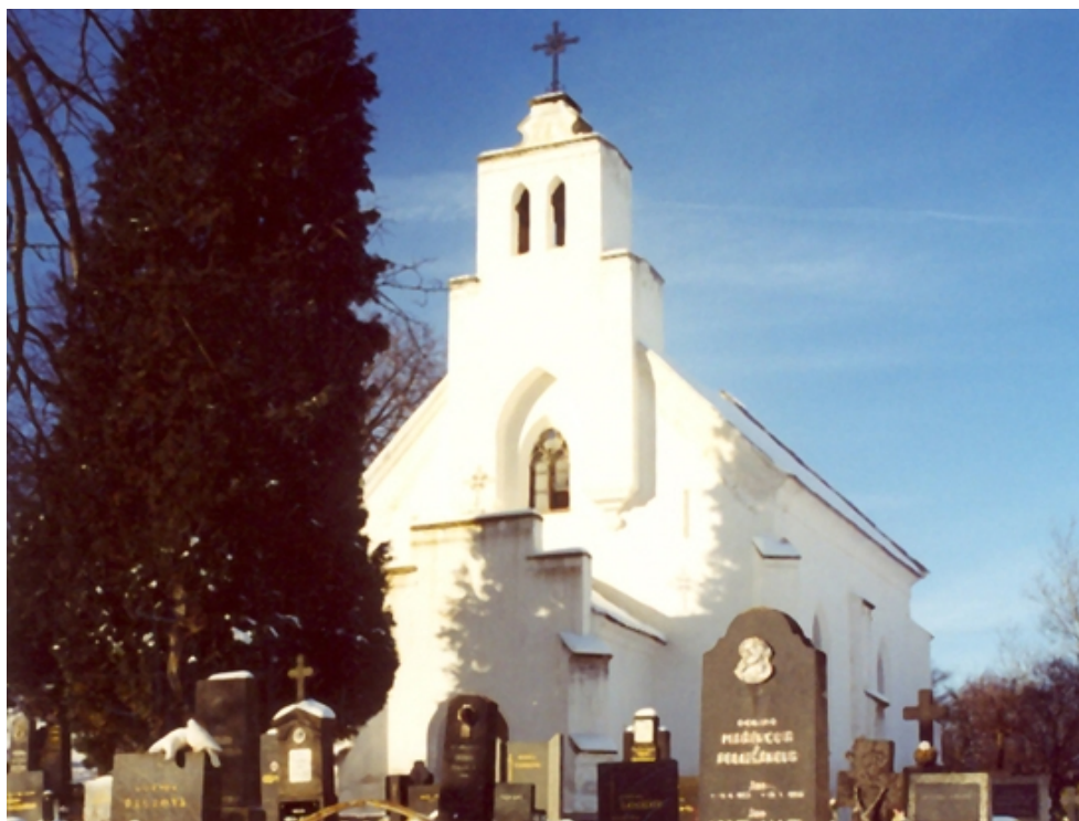
Obr. 4 - hřbitovní kostel sv. Cyrila a Metoděje