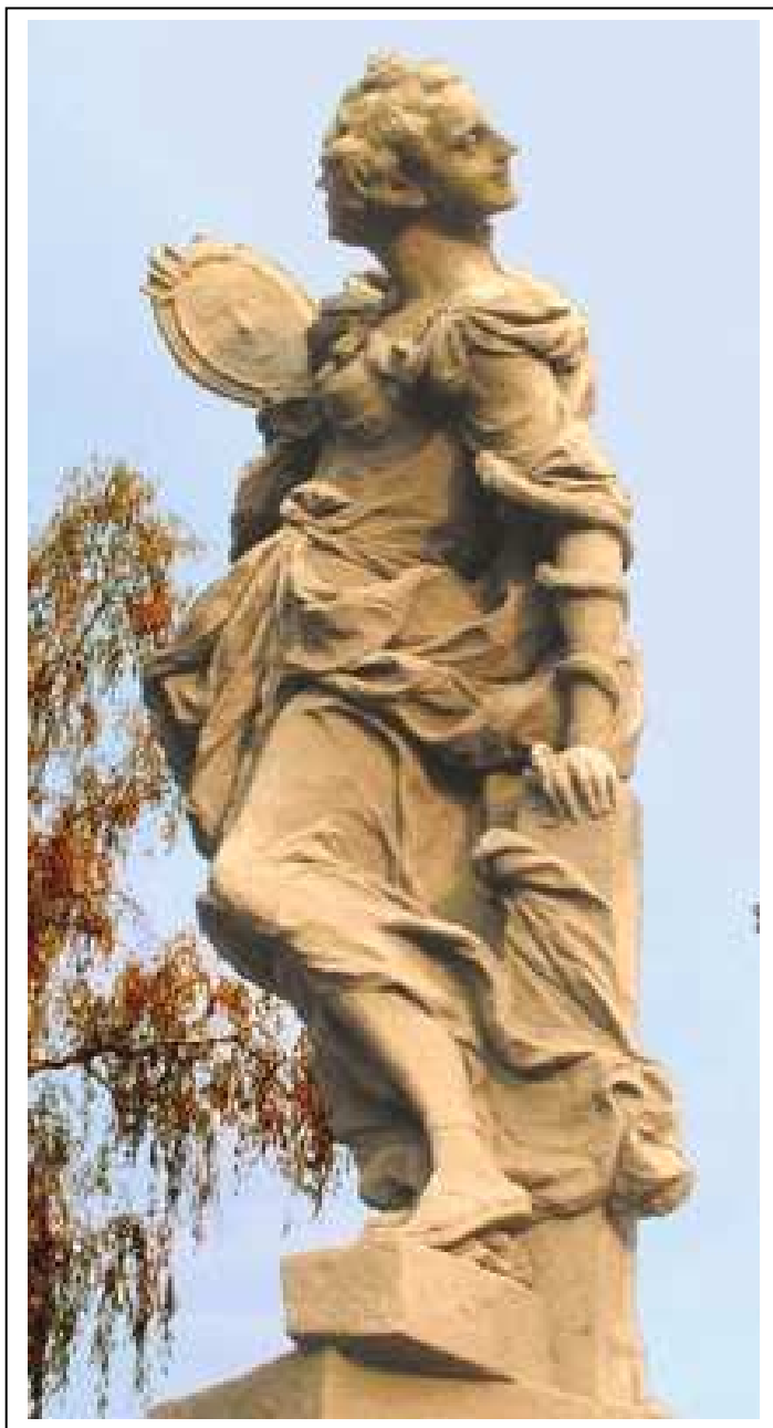
Příloha č. 6 Sochy alegorií ctností a neřestí od Matyáše Bernarda Brauna 1712-1715 v Kuksu „Moudrost“