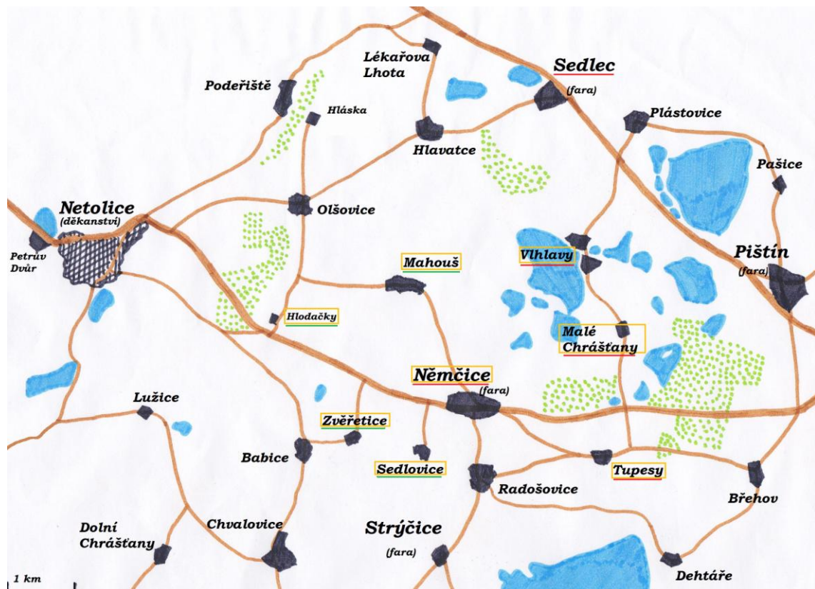
Mapa č. 2: Vývoj obvodu němčické farnosti