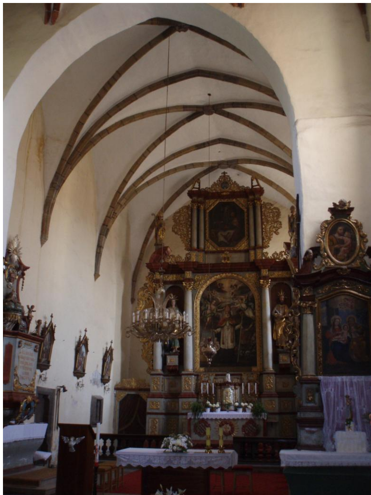
Obrázek č. 14: Pohled do presbytáře