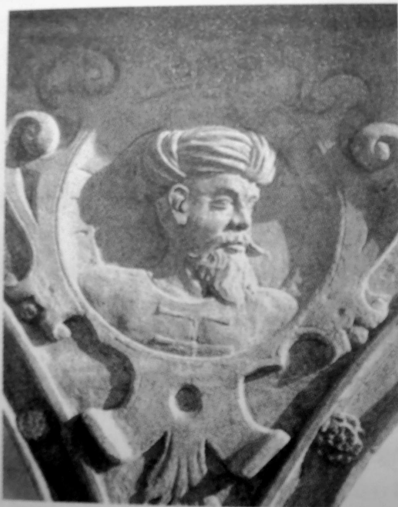
Obr. 54. Renesanční reliéf s poprsím Turka na zámku Račicích nedaleko Vyškova, po roce 1585.